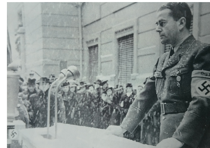
Minister for rustning og ammunisjon, Albert Speer, i 1942