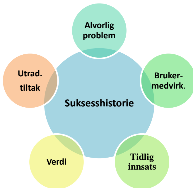
Figur 3: Tema fra trinn en.

I stedet for 10 suksesshistorier bestående av 15 sider med tekst, hadde jeg ved inngangen til trinn to av analysen nå fem tema, som jeg ga midlertidige navn/merkelapper. På dette trinnet skal en være varsom med å systematisere, men jeg valgte likevel å foreta en skjematisk oppsummering (se figur 3) over funn så langt: