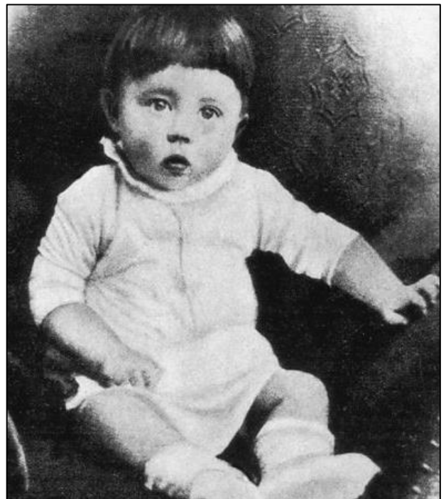
Adolf Hitler als kleines Kind.

Der Vater von Adolf, Alois Hitler, war sehr streng und verlangte absoluten Gehorsam von seinen Kindern, sowie von seiner jungen Frau, Klara (Glenewinkel, 2007). Wenn man sich dem Vater nicht unterwerfen würde, würde es Konsequenzen geben und man würde vor den Augen aller geschlagen (Glenewinkel, 2007). Wegen dieser schwarzen Pädagogik und der dunklen Familienverhältnisse, war jeder Tag für das Kind Adolf, ein Alptraum.