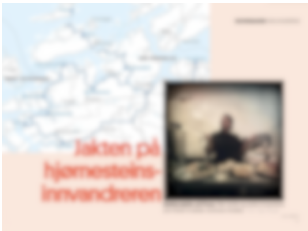
Figur 2. skjermdump digital utgave av ukeadressa publisert 22.11.2014