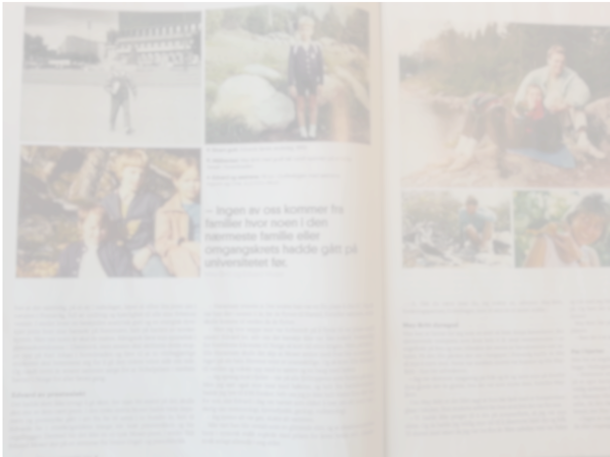
Figur 6.

Informasjonskobling mellom skrift og bilde er tilstede gjennom hele reportasjen. Det er en kort tekst som er plassert i tilknytning til hvert bilde. Pilsymboler er plassert ved teksten som står i tilknytning til hvert bilde. Pilsymbolene peker i retning mot bildet. Dette gjør det enklere for leseren å orientere seg i teksten, og forstå hvilken tekst som hører til hvilket bilde. Teksten som står i tilknytning til bildene gir informasjon om hvem som er på bildene og hvilken anledning bildene er tatt i. Her kan vi se at det oppstår en informasjonskobling mellom tekst og bilde, hvor skriften forankrer bildene. På nest siste side i reportasjen står det med uthevet skrift: "Last ned Ukeadressa-appen. Da kan du se bildene og høre May-Britt og Edvard Moser kommentere reisene sine med egne ord".