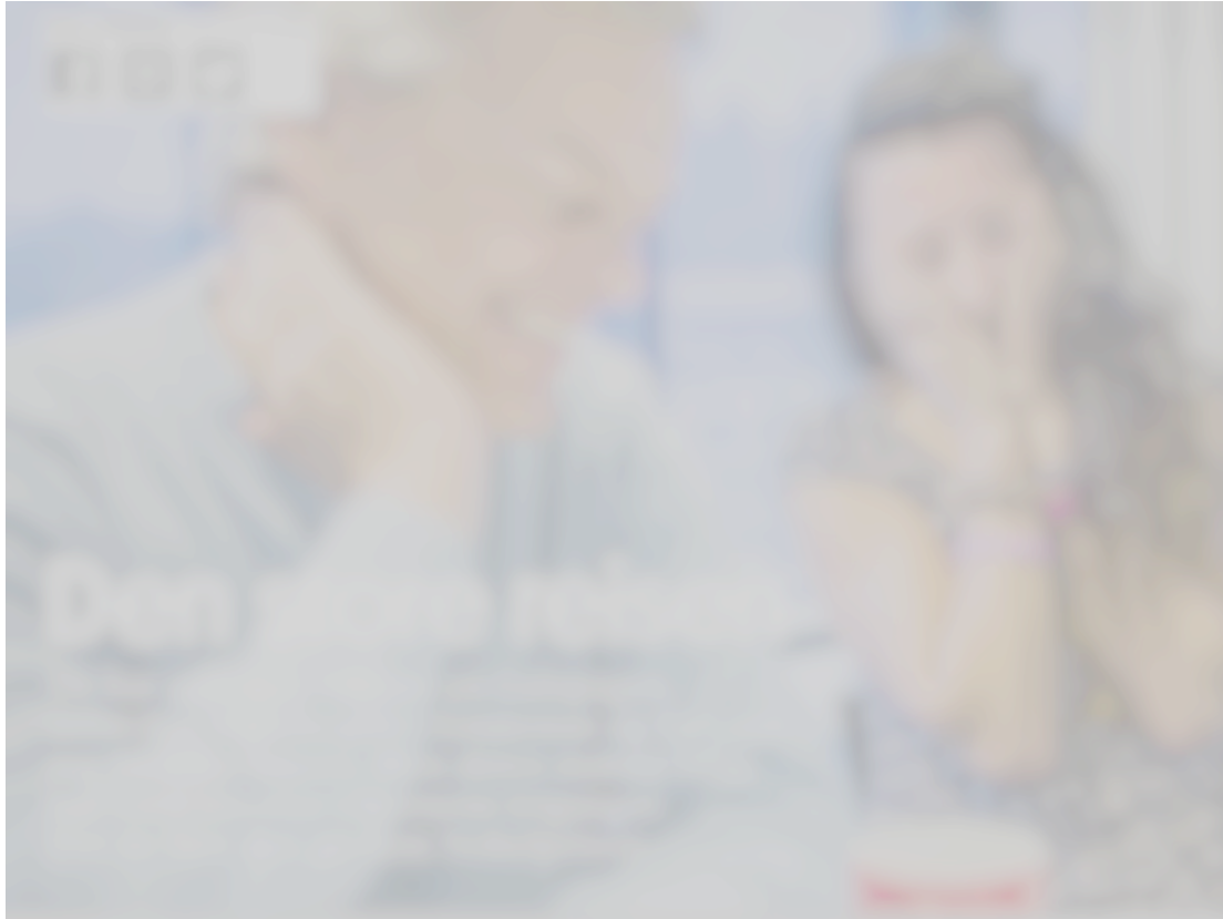
Figur 5. skjermdump digital utgave av ukeadressa publisert 06.12.2014

Tittelen er uthevet i større skrift enn det som står under tittelen, og er det man først legger merke til når det gjelder det skriftlige innholdet. Fargen på skriften er hvit, og samspiller godt med fargene på bildet. (Den lyse blå genseren til Edvard Moser som skriften er plassert over matcher bra med den hvite skriften). I bildet oppstår det en frakopling mellom elementene, hvor grafikkens komposisjon gjør at det ser ut som om det ikke hører sammen med de andre elementene i bildet. Den videre reportasjen inneholder grafikk i form av to symboler man kan klikke på. Symbolene er plusstegn. Her kan det oppstå en dialog, ved at leseren responderer med å klikke på grafikken. Ved det første pluss-symbolet står det: "Se og hør Moser paret fortelle om sine reiser". Når man klikker på symbolet dukker det opp en video av paret hvor de forteller om sine reiser. Under det første pluss-symbolet er det et til identisk symbol der det står: "Derfor fikk de Nobel-prisen i medisin for 2014".