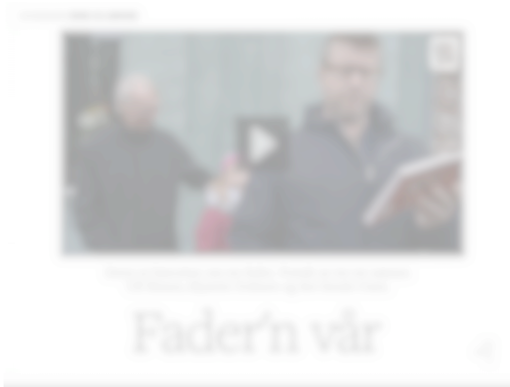
Figur 4.