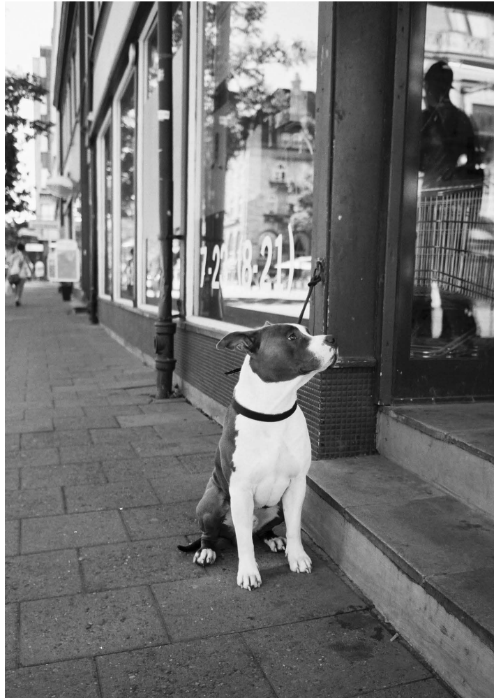
"Ventende hund"