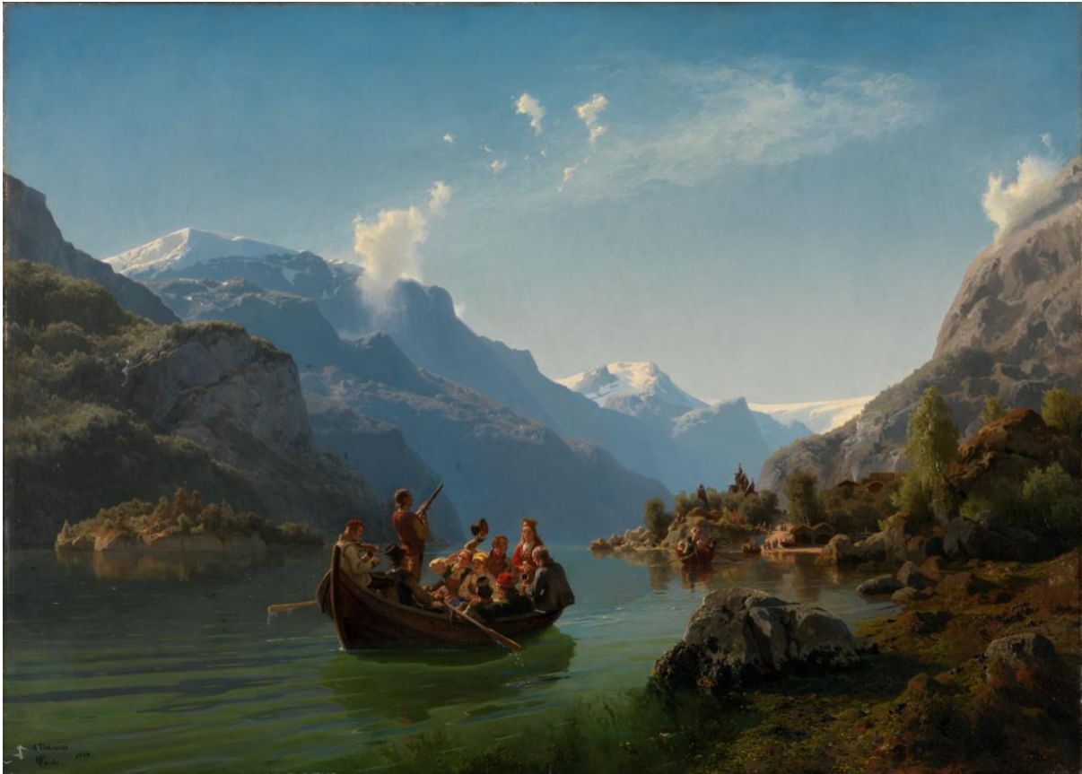
Figur 1: Brudeferd i Hardanger, Av Adolf Tidemand og Hans Gude, 1848. ( https://www.nasjonalnuseet.no/samlingen/objekt/NG.M.00467 ). Lisens: Falt i det fri.