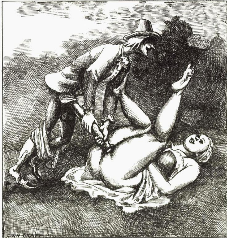
Figur 3: Steke vafler, illustrasjon av Finn Graff, 1977, i Erotiske Folkeeventyr.