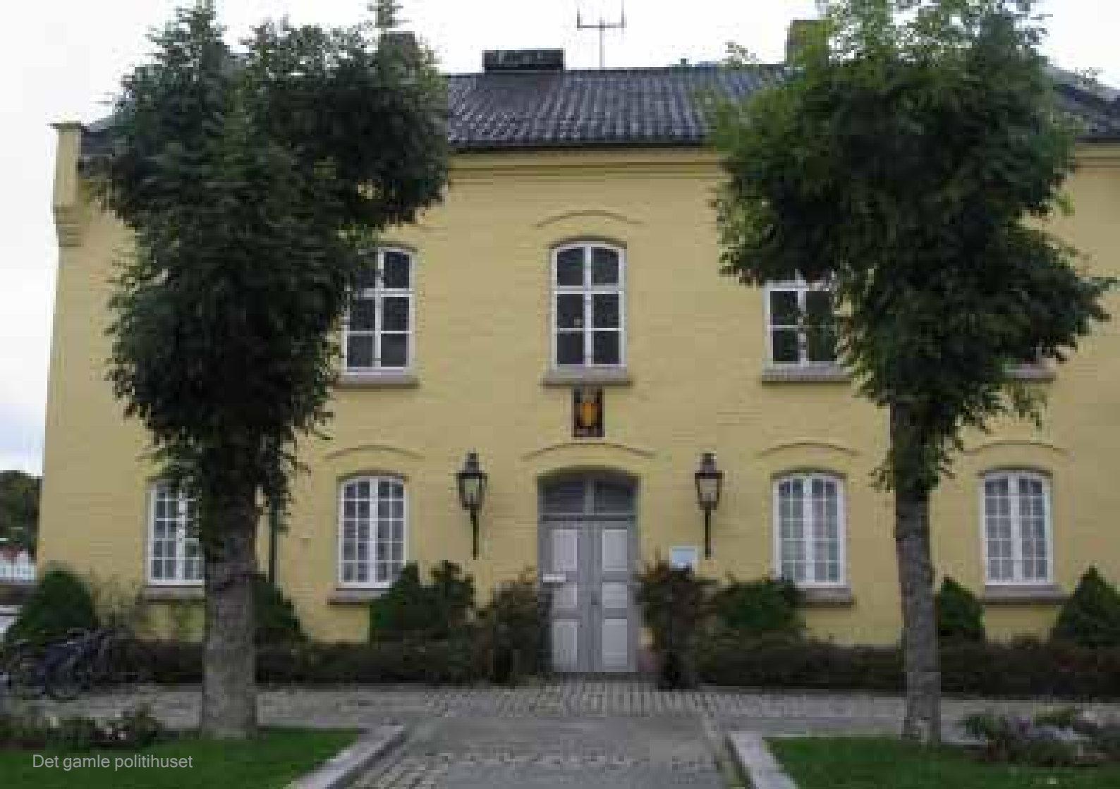
Det gamle politihuset