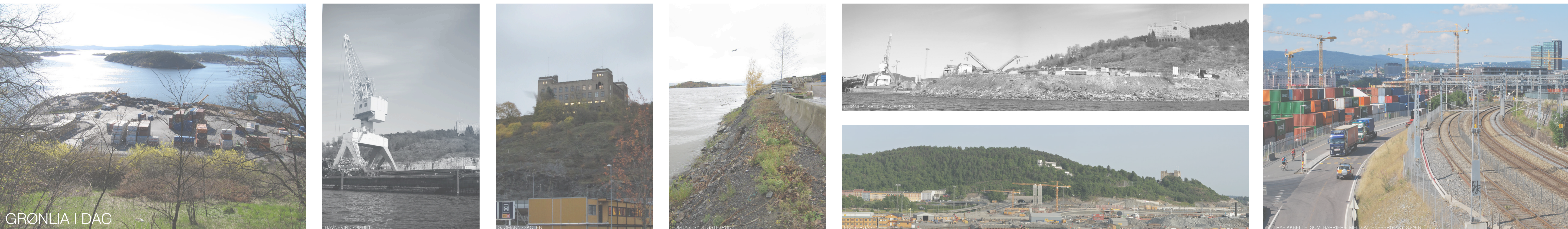
GRØNLIA I DAG