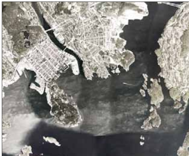
3) Odderøya sett i en større kontekst. Øya står som en kontrast til Kristiansands bysentrum; Kvadraturen. Den er et unikt friluftsområde tett på det urbane. Fra den høyeste toppen på øya kan man få panorama-utsikt over området.

På øya har det blant annet vært jordbruk så langt tilbake som 4000 år. 7 Den har huset en livlig handelshavn; Odderøyhullet, der regnskap fra 1602-1603 viser at 32 tollpliktige fartøyer besøkte Hullet. 8 En av Norges tidligste kanaler, Gravane, gjorde at Odderøya først levde opp til navnet sitt i 1647. 9 Området var et attraktivt ved- og fisketorg for Kristiansands befolkning, og er et populært sted også den dag i dag.