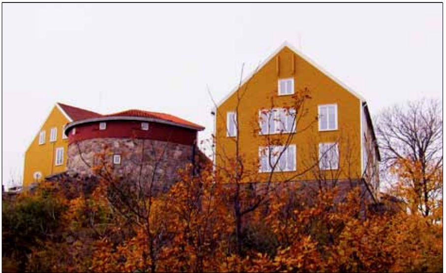
4) Lasarettene med et gammelt kruttlager mellom dem. Disse setter et historisk preg på Odderøya, og utgjør for mange en stor del av øyas identitet.

Odderøyas militære bakgrunn utgjør den største andelen historiske spor. Den er for mange, spesielt de eldste generasjoner, det som karakteriserer øya mest. 14 Det vil ikke være galt å påstå at disse fortidsminnene troner det historiske hierarkiet på øya. En rekke militære fortifikasjoner og befestninger har blitt utført opp gjennom tidene. Dette startet tiden etter grunnleggelsen av Kristiansand i 1641, og etter at byen ble garnisonsby i 1666, 15 ble øya befestet for fullt. I 1686 fikk den norske skjærgårdsflåten sin hovedbase i Kristiansand, og kongens krigsskips-produksjon ble flyttet til byen. 16 Odderøya stod sentralt i forsvaret av krigsskips-produksjonen frem til denne ble flyttet rundt tiden da karantenestasjonen anlegges. Gjennom perioden som karantenestasjon, under napoleonskrigene på tidlig 1800-tallet, ble deler av Odderøyas forsvarsverk opprustet og utbygd på ny. Flere kanonbatterier ble anlagt. Den eldste delen av den vaktmannsboligen som i dag finnes på Odderøya er fra 1812 17 og heter Søndre Batteri. Her driver Odderøyas Venner kafé, og stedet er idyllisk om sommeren.