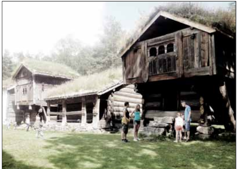
7) Setesdalstunet på Kongsgård der Vest-Agder Museet holder til. Disse bygningene er vakre og trenger mer oppmerksomhet enn de får i dag, men hører de hjemme, og er det plass til dem på Odderøya?

Prosjektet Odderøya Utvikling er et samarbeid mellom Vest-Agder Museet, Vest-Agder Fylkeskommune og Kristiansand Kommune, der målet for utviklingen på Odderøya er å skape et moderne senter for formidling av Kristiansandsregionens historiske arv og identitet, med særlig vekt på det maritime og militære grunnlaget for byens framvekst . 26 Prosjektet skal strekke seg over flere år og utviklingsfaser. Det skal etableres en museumshavn i Nodeviga på øya, ordnes en utleiestrategi for bygningsmassene i og utenfor museumsområdet og reises et nytt formidlingsbygg for kristiansandsregionens historiske arv og identitet. 27 Siste punkt i planen var flytting av friluftsmuseet på Kongsgård ut på Odderøya, noe som skulle starte rundt 2020. 28 I 2011 fikk Vest-Agder-museet utredet en planløsning for flytting av de antikvariske bygningene til Flaten på øya, hvor bygningene skulle plasseres i tun. 29 Siden er arbeidet ikke fulgt opp med ytterligere tiltak. 30