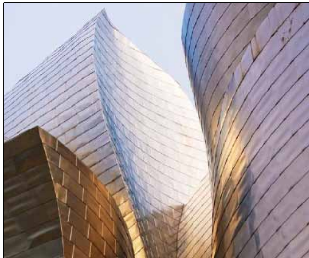
12) Bildet viser Frank Gehrys Guggenheim Museum i Bilbao og er hentet fra Vest-Agder Museets brosjyre om planene på Odderøya. Er dette den moderne og nyskapende arkitekturen museet ser for seg? Vil slik arkitektur passe inn på øya?

Noe av det kommunen legger til grunn når det kommer til utleiestrategi for Odderøya under punktet; aktivitet, er: Det vil bli satt krav om aktivitet i lokalet og manglende bruk anses som mislighold. Plikt til deltakelse på fellesaktiviteter bør videre være utgangspunktet. Under ingen omstendigheter skal det foregå overnatting i lokalet. 81 I dagens samfunn er avstanden mellom jobb og hjem blitt kortere, og det å jobbe i sitt eget hjem er blitt ganske normalt. 82 Ved kreative yrker, noe det er mye av på Odderøya, er gjerne skillet mellom arbeid og fritid enda mindre. Det å tillate folk og overnatte i leielokalene, dermed få behandle disse som sitt hjem på Odderøya, er viktig for å kunne skape engasjerte mennesker og ildsjeler, også for å styrke samholdet og naboskapet der.