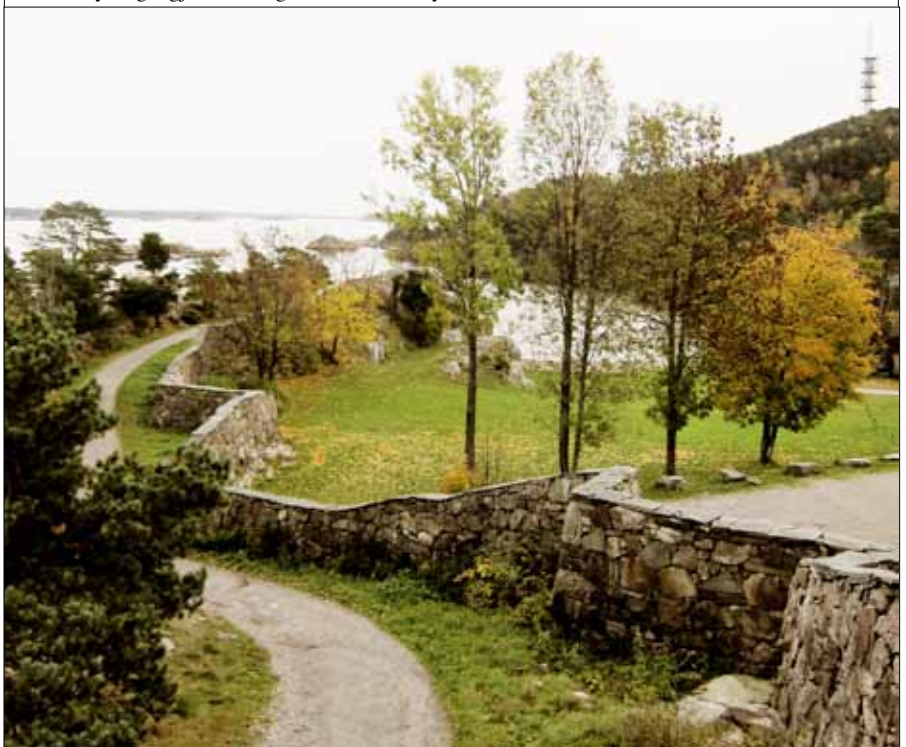
5) Koleramuren som svinger seg nedover langs det gamle Odderøyhullet hadde en viktig funksjon; forhindre at pesten ble spredd. Nå står den igjen som et vakkert estetisk element.