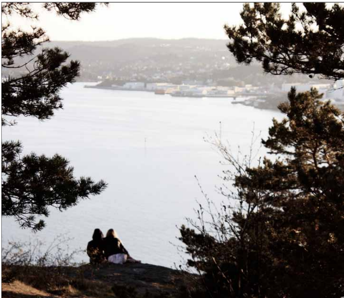
16) Kjærestepar på toppen av Odderøya nær hovedkommandoen.

Det finnes altså lovende muligheter for arkitekter til å påvirke Odderøya mot en mer bærekraftig fremtid, men det kan komme til å kreve at arkitekten må tre ut av komfortsonen og inkludere flere roller.