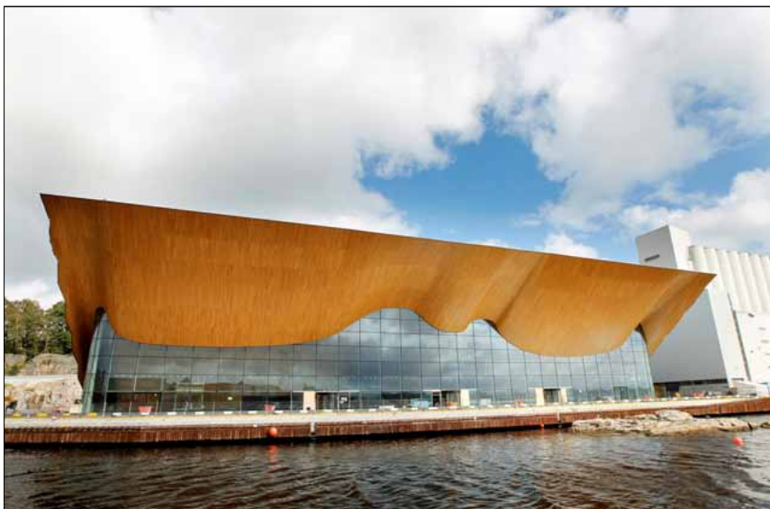
8) Kristiansand Kommunes satsningsprosjekt; Kilden, på Silokaia på Odderøya. Den spennende organiske fasaden imponerer riktig nok mange båtførere og passasjerer, men vender den ryggen til Odderøya?

Det finnes mange måter å gjøre de historiske sporene på Odderøya mere tilgjengelige og spennende for besøkende, samtidig som de historiske aspektene kan formidles. Man kunne drøftet rimeligere måter å friske dem opp på enn kun å restaurere dem tilbake til sin opprinnelige form. Installasjoner og temporære innredninger kunne utføres av kunstnere og andre interesserte, på denne måten gjort et slikt friluftsmuseum mer unikt og attraktivt. Arkitekter kunne fungert som veiledere og organisatorer, og kommet med idéer for ny bruk. Bunkere og bomberom uten bruk i dag kunne vært spennende øvingslokaler for musikere. Ved å gi enkelte av disse fortidsminnene et nytt program kunne man også skapt en anledning vedlikehold kunne skjedd i.