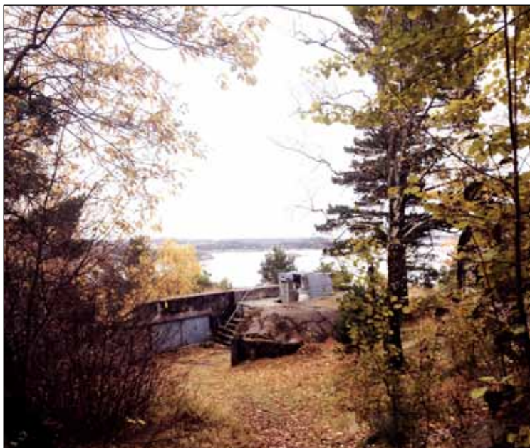
10) Odderøyas karakter: røff natur krydret med historiske spor av forsvarsmessig karakter. Bildet viser Østre Batteri, og her er den originale Haubitzer-kanonen hentet tilbake.

viktig å være klar over at det som skjer nå på Odderøya kommer til å bli en del av dens historie i fremtiden. Hvilke historier ønsker vi at øya skal formidle for de kommende generasjoner?