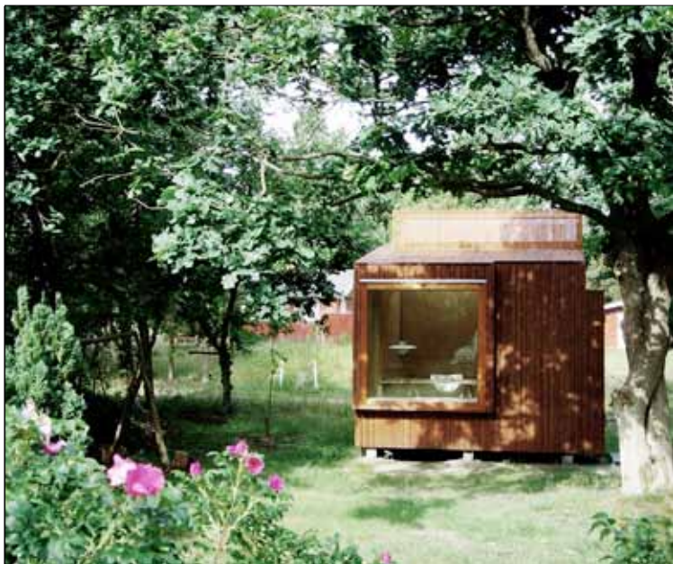
14) Bildet viser Dorte Mandrup Arkitekters "Read-Nest." Kunne en slik minimal måte å bo på vært aktuell for Odderøya? Ville det styrket øyas identitet?

På Odderøya det er muligheter for å studere ulike og alternative måter å bo på. Stadig flere søker alternative måter å bo på, og det er en del av arkitektens rolle å bevisstgjøre rundt potensialet slike boformer innehar. Et eksempel på dette er The Tiny House Movement som består av flere organisasjoner og grupperinger for mennesker som ønsker å bo minimalt. 83 Én av disse er; Small House Society som beskriver seg selv som; a cooperatively managed organization dedicated to the promotion of smaller housing alternatives which can be more affordable and ecological. 84 Ved en slik boform vil det miljømessige fotavtrykket kunne begrensnes. Når man er ferdig med boperioden pakker man