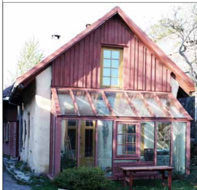
13) Gaia Arkitektur Tjøme sitt kontor, oppført sommeren 1997 i tre-konstruksjon med halmvegger. Kaprer denne arkitekturen litt av den sjelen som eksisterer i miljøet på Odderøya allerede? Er den mer aktuell for øya?