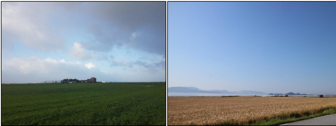
Figur 2. Jordbrukslandskap i rød støysone.

landskap og lokalklima blir disse forholdene trukket fram og beskrevet som følgende: «[d]et sammenhengende fulldyrkede jordbrukslandskapet er intensivt drevet og preget av moderne stordrift. (...). De fleste brukene er velstelte og veldrevne» (2014b, s. 23, se også figur 2). Når det gjelder området rundt flybasen som blir påvirket av flystøyen, drev omtrent halvparten av de 75 gårdsbrukene med melkeproduksjon da kampflybaseutbyggingen startet, mens eiere av øvrige bruk hovedsakelig var kornprodusenter (Forsvarsbygg 2014a).