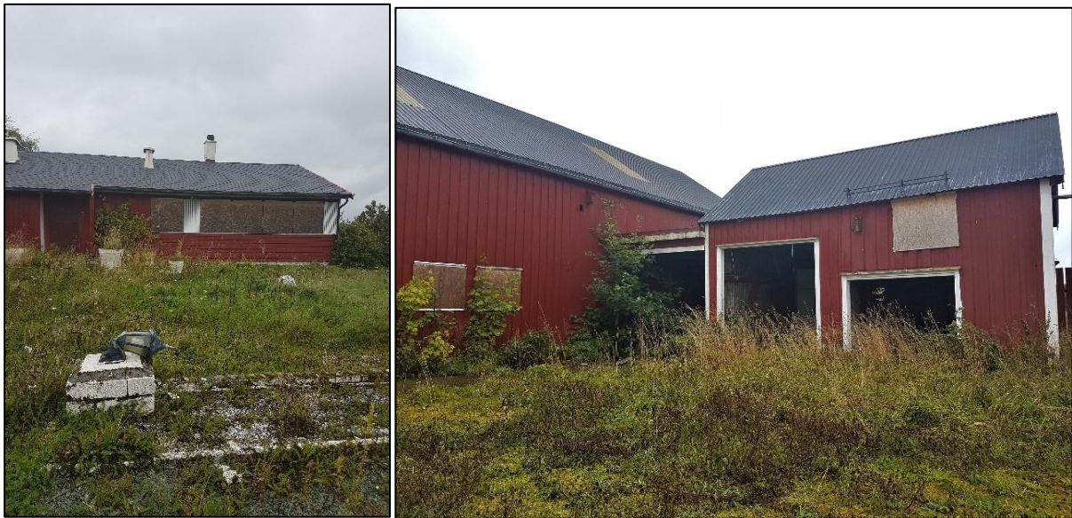
Figur 4. Gård i rød støyson som ble innløst til Forsvarsbygg tidlig i prosessen. Dører og vinduer er gjenspikra og tunet begynner å bli tydelig gjengrodd. Gården har nærmest blitt et symbol på 'spøkelsesgrenda' bøndene frykter området skal ende opp som, og er 'obligatorisk stoppested' på omvisningen Støygruppa Ørland gir studenter, journalister og politikere som kommer til Ørlandet i anledning støysaken.

hevet vernebestemmelsene for å kunne flytte bygningene ut av støysonen, eller rive bygningene og «vurdera om det er andre liknande bustader i området utanfor støysona som kan vernast» (Forsvarsbygg 2020) i stedet.