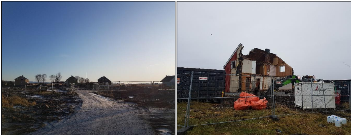
Figur 5. Arbeidet med å rive bolighus i rød støysone var godt i gang høsten 2019. Til venstre er avbildet 'restene' av boligfeltet 'Blomsterbyen' etter at 12 boliger har blitt revet.