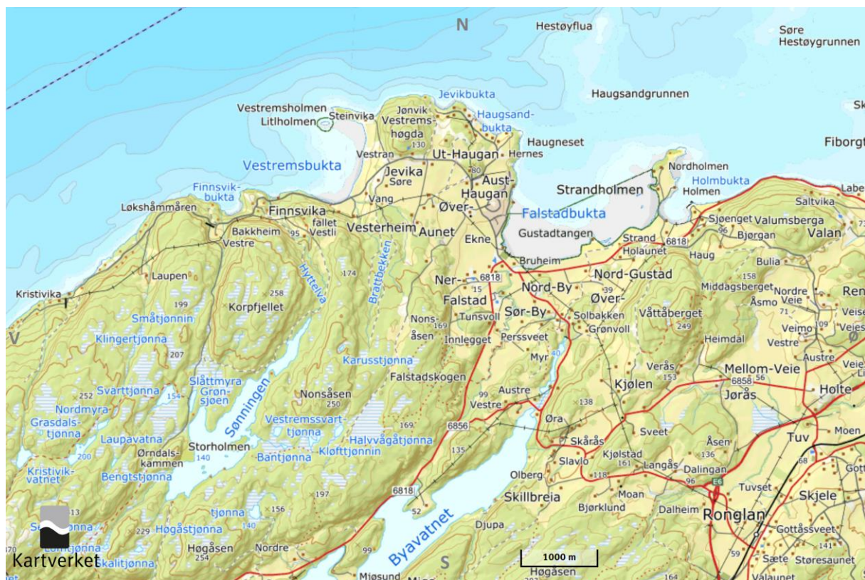
Figur 1.3: Kartutsnitt av Ekne og omegn med lokale stedsnavn (Kartverket, 2019b).