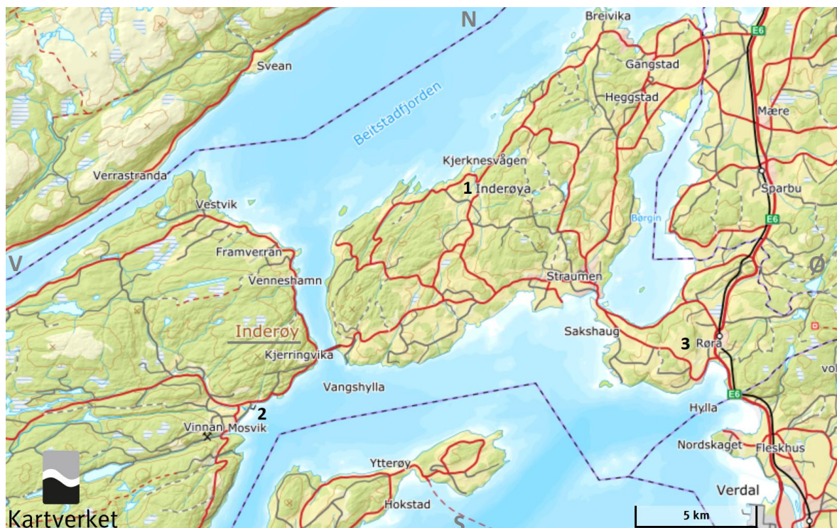
Figur 1.1: Kartutsnittet viser plassering av 1. Inderøya, 2. Mosvik og 3. Røra i Inderøy kommune (Kartverket, 2019c).