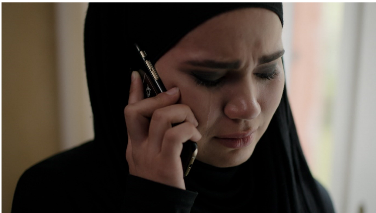
Bilete 4: «Bare vær så snill, tilgi meg.»