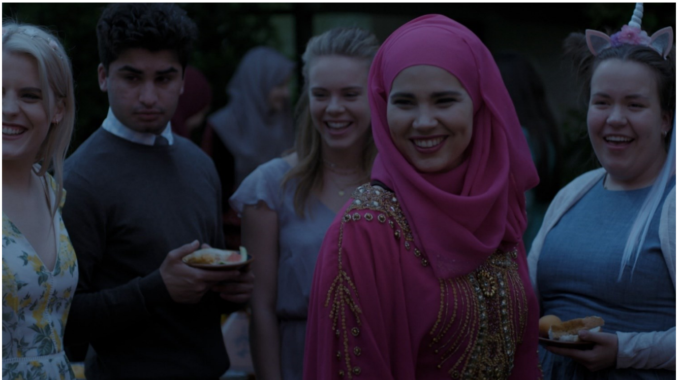
Bilete 2: «Den harmoniske Sana.»