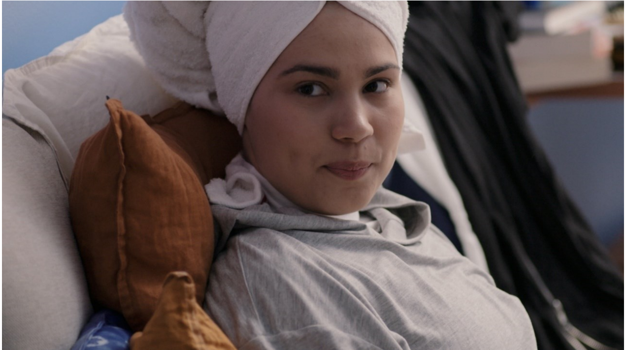
Bilete 10: «Den nakne og sårbare Sana.»

Eit anna døme der vi ser Sana usminka, er i episode ni (25:00-), då ho ber på rommet sitt og bestemmer seg for å gå på date med Yousef. Her er alle kledda svarte, men Sana verkar tilfreds. Då ho vert avbroten i bønna, går ho til og med ut på balkongen, noko som indikerer at ho ikkje er redd for å visa den usminka versjonen av seg sjølv. Dette gjev signal om at ho er i ferd med å verta «den harmoniske Sana». Her kan vi sjå korleis ho har slutta å skamma seg fordi ho ikkje lenger kjenner på ei like stor skuld som ho gjorde tidlegare. Denne skulda har sannsynlegvis fått Sana til å skamma seg over den ho er, og dersom ein ser det andre vegen, kan det ha vore dette som fekk ho til å handla slik ho gjorde. Når skuldkjensla vert mindre, kan òg skamkjensla verta mindre. Av dette ser ein korleis skamkjensla går direkte på sjølvidentitet (jf. Oxfeldt, 2018). Idet Sana bestemmer seg for å gå på date med Yousef, står ho midt i nok eit «skjebnesvangert augeblikk» og eitt av «sjølvets dilemma» (jf. Giddens, 1991).