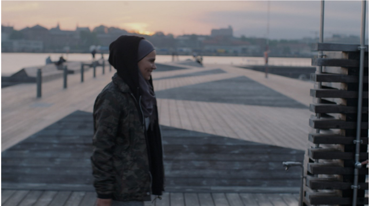
Bilete 8: «Den kamuflerte Sana.»

Eit anna funn som ikkje aktantmodellen kunne fanga opp, er korleis kjensla av skam og skuld viser seg i kleda og sminka til Sana mellom episode ein og episode ti. Dette vert nemnt over i samband med Sana sine mørke klede og sminke, men i det følgjande vert dette gått grundigare inn i.