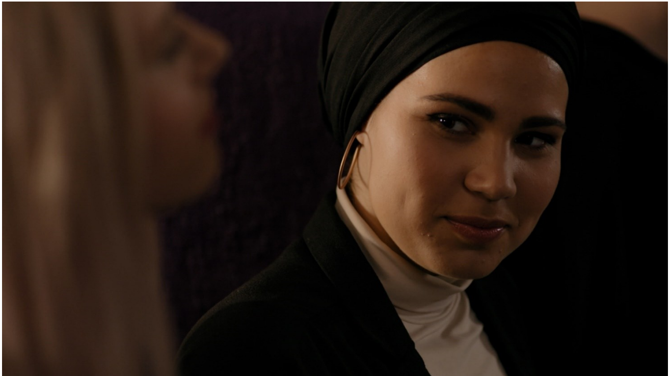
Bilete 7: «Den drøymande Sana.»

er svart, men leppestifta er ljøs og glinsande og i tillegg har ho på seg store øyreringar. Dette står i stil med at heile Sana strålar fordi ho ventar på at Yousef skal koma på festen. Her ser vi òg at ho miksar mørke og ljøse klede, men endå tydelegare er det at ho har sminka og pynta seg annleis, fordi ho er glad. Endå gladare vert ho, då ho les ein SMS frå mor si som ber om orsaking (21:54): «Unnskyld for at jeg snoket i tingene dine. Du er smart og sterk, og klarer deg uten mine dumme råd.»