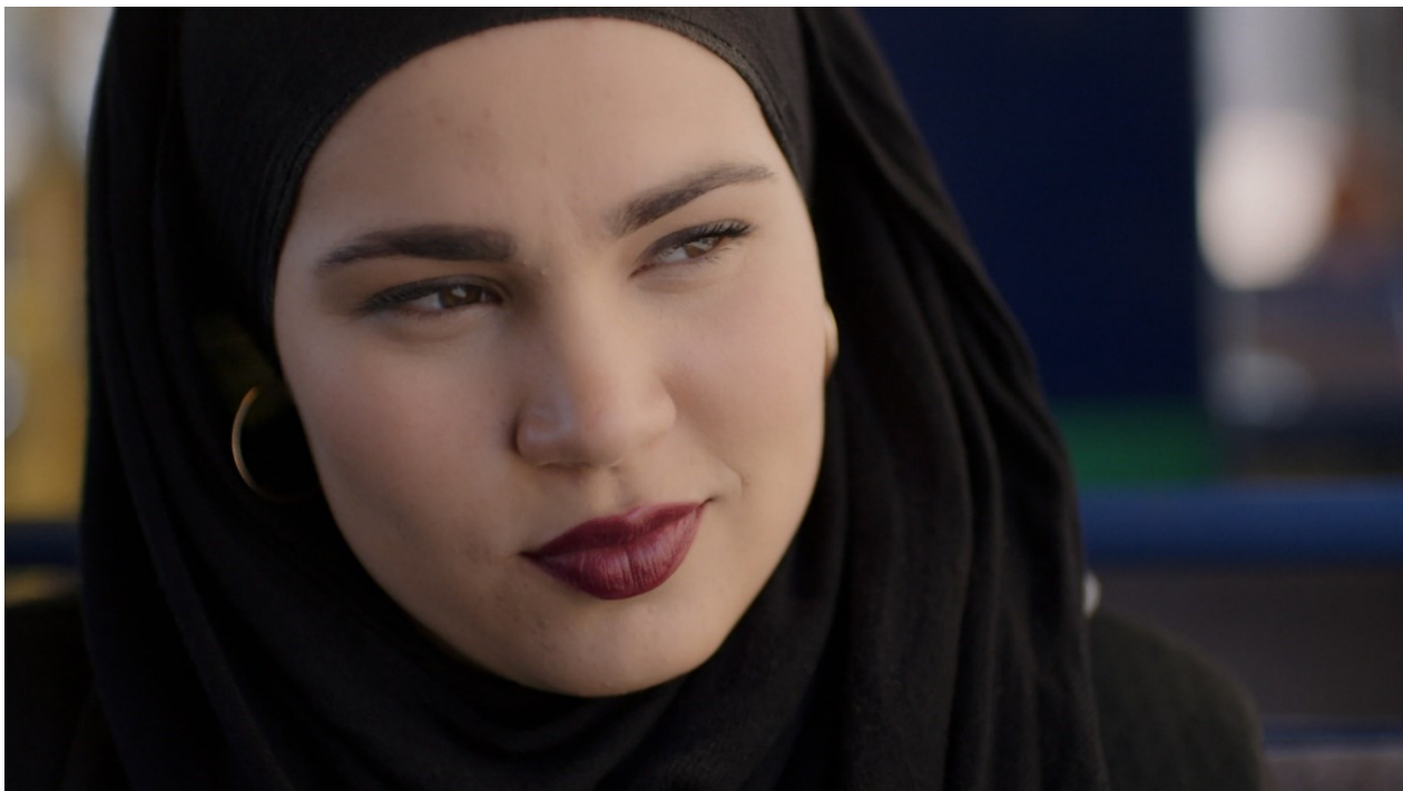
Bilete 1: «None of dem work for me. None of dem make me feel anything?» ©NRK.

Så avbryt eit bønerop Sana. Det er tid for middagsbøna Duhr. Ho er rask med å slå av lyden på mobiltelefonen, lèt att augo og prøver å gjennomføra bøna, men ho klarar ikkje å konsentrera seg. Rett overfor ho sit ei dame og ser på ho med eit skeptisk og dømande blikk. Sana «blikkar» ho attende, no er ho tydeleg irritert (00:00-01:24).