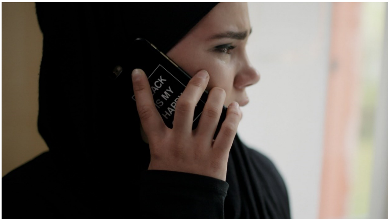
Bilete 3: «BLACK ISN'T MY HAPPY COLOR». ©NRK.

at ho verkar hard og sterk. Trass dette verkar det ikkje som om den svarte fargen gjer ho glad, men han fungerer heller som eit vern for å få andre til å tru at ho er trygg.