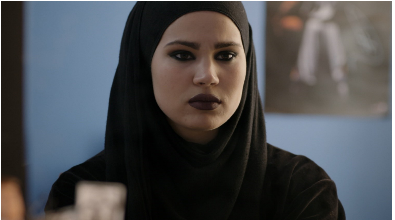
Bilete 6: «Ikke snakk til meg.»