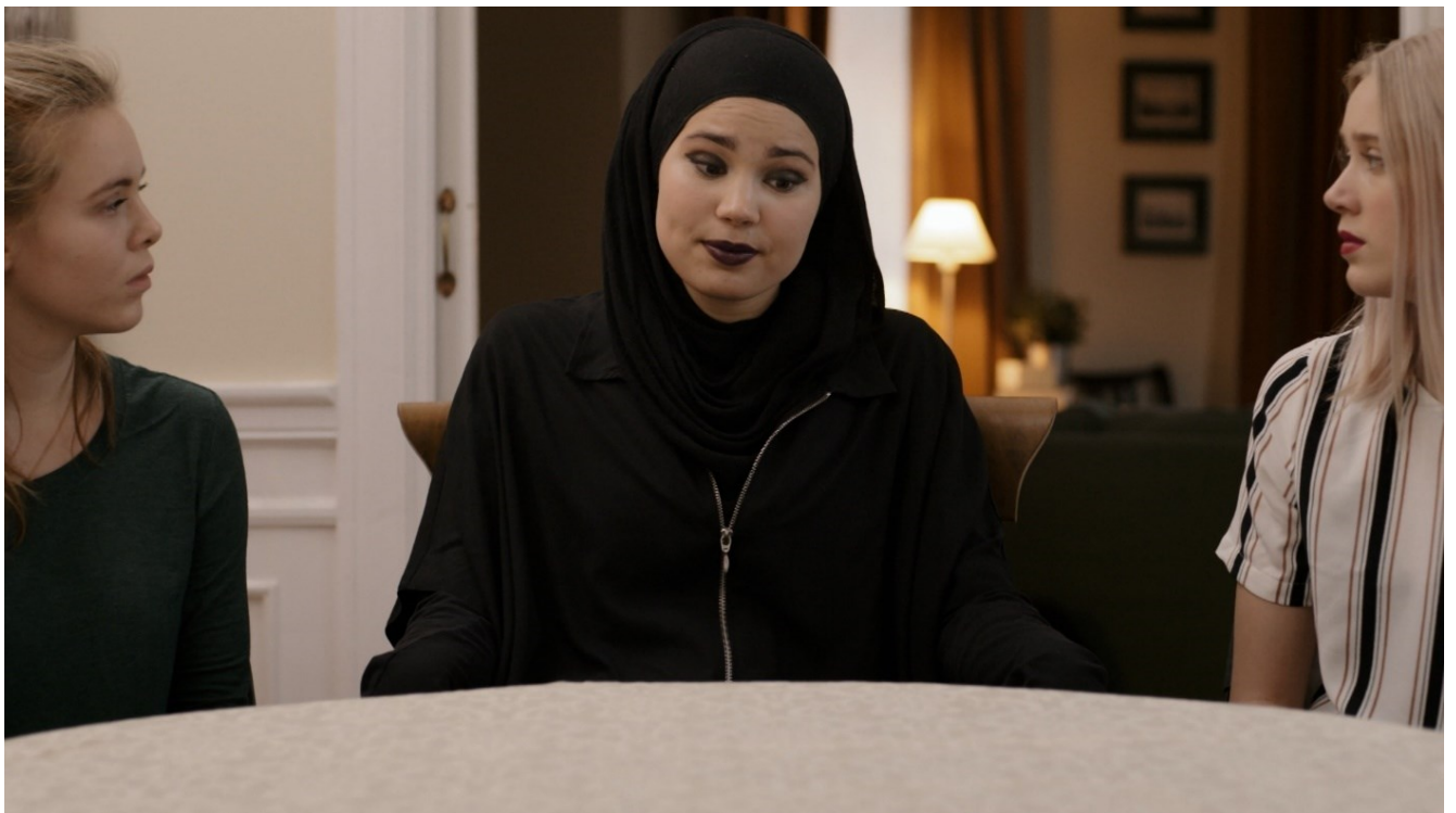
Bilete 5: «Jeg dømmer ingen.»

I slutten av episode tre (19:29-) kler og sminkar Sana seg nok ein gong heilt i svart. Her har ho invitert inn til russebusmøte heime hjå seg og teke på seg den strenge «maska» si. Til og med leppestifta er svart, og signaliserer korleis ho prøver å gøyma seg bak eit hardt skal. Her dominerer den svarte fargen Sana og kan vera eit teikn på sinne og protest. Som ei muslimsk jente som ikkje drikk alkohol, står det i ein kontrast til den norske russefeiringa. Dette vert særleg tydeleg då Sana får spørsmål frå jentene om dei kan drikka, og svarar: «Jeg dømmer ingen.» Her kan Sana sitt svarte uttrykk vera eit symbol på at ein del av ho protesterer, samt at ho er sint på den delen av seg sjølv som gjer at ho ikkje er «som dei andre». Samstundes ser vi at ho som buss-sjef vil bestemma over alle, og slik vert den svarte fargen eit uttrykk for at ho er hard. Dette viser korleis Sana sin minoritetskultur vert undertrykt, og at ho nyttar seg av mimikry (jf. Bhabha, 1994). Ho prøver å etterlikna dei andre ved å vera russ, samstundes med at ho forsvarar seg med den svarte fargen slik at ho ikkje skal stå fram som underdanig.