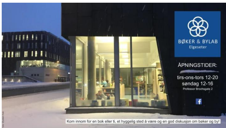
Figur 1. «Bøker&Bylab Elgeseter», 2019, av Ask.

https://biblioteket.trondheim.kommune.no/innhold/om-biblioteket/avdelinger/boker--bylab/#heading-h2-3