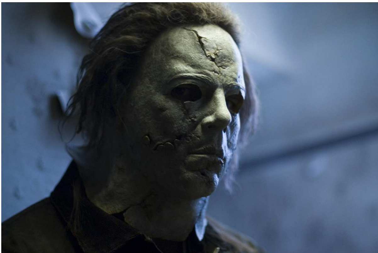
Figur 21 Masken til Michael i 2007

Masken i denne filmen har en overholdt likt uttrykk som Carpenters. Bildet nedenfor.