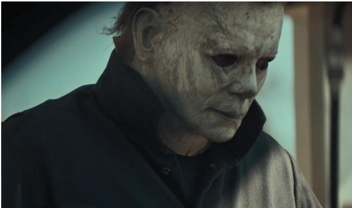
Figur 23 Fra Halloween 2018

Masken er en meget god oppfølger i seg selv. Den originale masken har falmet og blitt solgt videre over tid til samlere av filmrekvisitter. Den nåværende eieren kjøpte masken av Dick Warlcok og postet et bilde for en liten stund tilbake og viste oss at den ikke har tålt tidens tann (Cavanaugh, 2017). Som nevnt i analysen av tidligere filmer, i underkapittelet « Halloween 1978 », så viser den nye masken en sterk kontinuitet fra tidligere filmer som styrker troverdigheten av det fiktive universet.