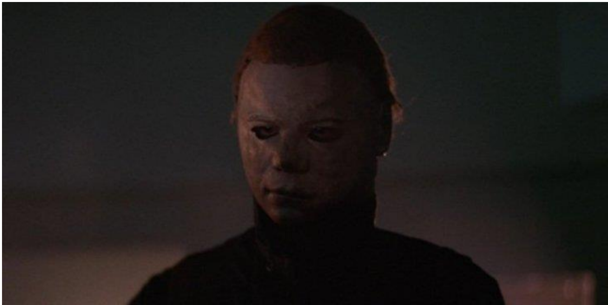
Figur 4 Bildet er fra H2