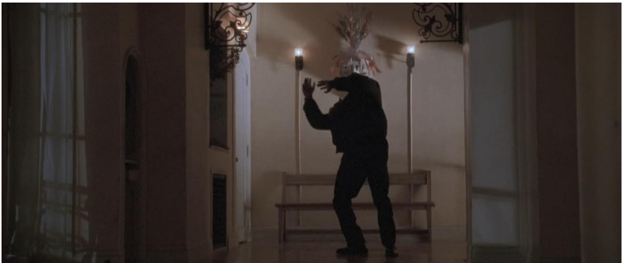
Figur 15 Skjermbilde: Halloween H2O: 20 Years Later (1998, Steve Miner). Helt tydelig LL Cool J