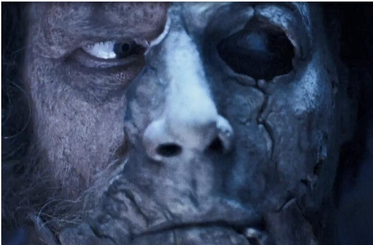
Figur 22 Fra Halloween II 2009

Masken i filmen er ganske slitt og falmet. Det er overholdt et kontinuitets preg over masken etter Michael har vært borte i en lengere periode. Nedenfor finner man et bilde, der ser man at det mangler en bit av masken. Hendelsen forekom når Michael gikk amok på en strippeklubb tidligere i filmen, og en stripper rev av en bit.