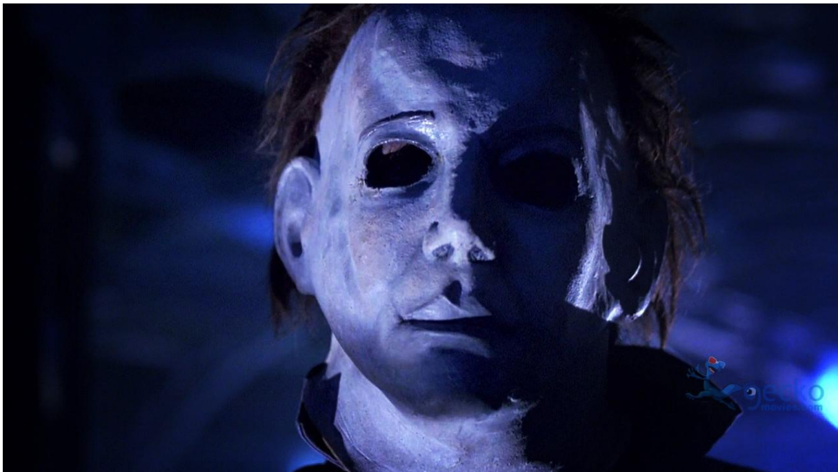
Figur 9 Avbildet Michael Myers i Curse

Det finnes altså to ulike versjoner av denne filmen. Kun kinoversjonen er tilgjengelig for kjøp og strømmetjenester, slik var det i mange år. I 2015 ble det tilgjengelig for folket å få tak i produsentversjonen (Sparks, 2018). Der produsentversjonen er fansens foretrukket versjon. Masken er selvfølgelig annerledes fra den forrige, nå i litt mer lik stil til den første filmen. Bare denne gang har han et par tynne øyenbryn, som ikke helt passer stilen til masken. Bildet nedenfor.