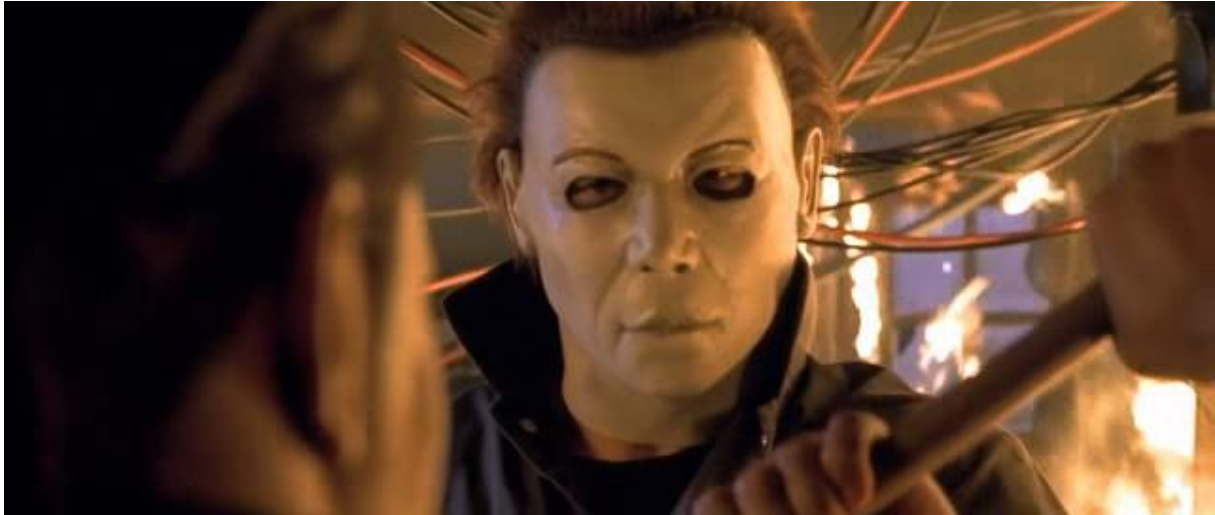
Figur 18 Fra Halloween: Ressurrection

Klimaks kommer mot slutten når det er Busta Rhymes mot Michael Myers i videovillage hvor Rhymes har oppholdt seg selv med Tyra Banks sin karakter. En brann oppstår når Sara Moyer, filmens protagonist, skal angripe Myers med en motorsag som fører til at hun treffer noen kabler som henger ned fra taket deretter kommer det gnister og det tar fyr i en brennbar væske på gulvet. Rhymes kommer inn og det blir nå en duell mellom Myers og Rhymes i flammene. Rhymes vinner duellen ved å gi Michael elektroshjokk og forlater han i flammene. Nå er det nesten slutt på filmen, vi er i et likhus, Michael ligger i en likpose med masken nesten brent opp og smeltet inn i hans ansikt, men han åpner øynene. En stor cliffhanger som dessverre ikke aldri fikk en oppfølging. Grunnen til dette er at gudfaren av filmserien, Moustapha Akkad, døde. Han har medvirket i en stor rolle siden den første filmen. Han døde i 2005 under Amman bombing utført av Al-Qaeda, sammen med han var hans datter og rundt 60 andre mennesker som mistet livet. Samt 3 selvmordsbombere.