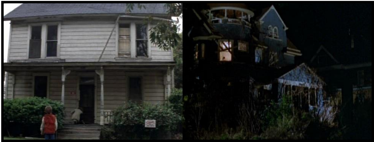
Figur 8 To forskjellige Myers hus

Huset til venstre er barndomshjemmet til Myers, huset til høyre ser ut som et ufint kråkeslott. Disse filmene eksisterer i det samme fiksjonsuniverset. Det er merkelig at produksjonen bak filmen ikke prøvde å finne et noenlunde likt hus.