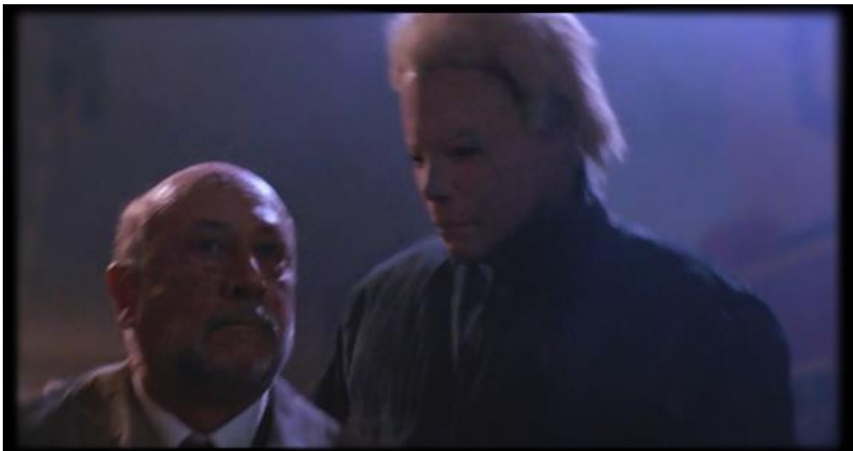
Figur 6 Fra Return of Michael Myers