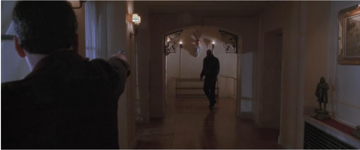
Figur 16 Skjermbilde: Halloween H2O: 20 Years Later (1998, Steve Miner).