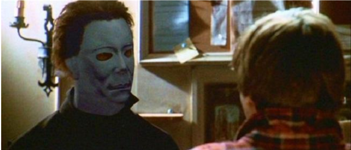
Figur 12 CGI Maske

Denne masken setter publikum ut fordi masken fremstår på en måte som ikke gjør den troverdig. Det er tydelig at masken er CGI og ikke ekte. Den drar deg helt ut av det fiktive universet, og det som skjer på skjermen, og du vil ikke føle med karakteren som blir myrdet. Alt ødelagt på grunn av ett skudd, en maske, en sekvens, og noen få sekund. Ikke at resten av maskene i filmen er perfekte, men denne kunne produksjonen spart seg for. Den beste masken er helt i starten av filmen som er The Buechler mask, som er relativt lik den fra film nr.6. Det er den masken øverst i venstre hjørnet i bildesamlingen. For å sitere special make-up effects artist, Mike McCarty (som lagde praktiske effekter til Texas Chainsaw 3D ) «CGI can go fuck itself» (Dead Meat, 2019, 08:42).