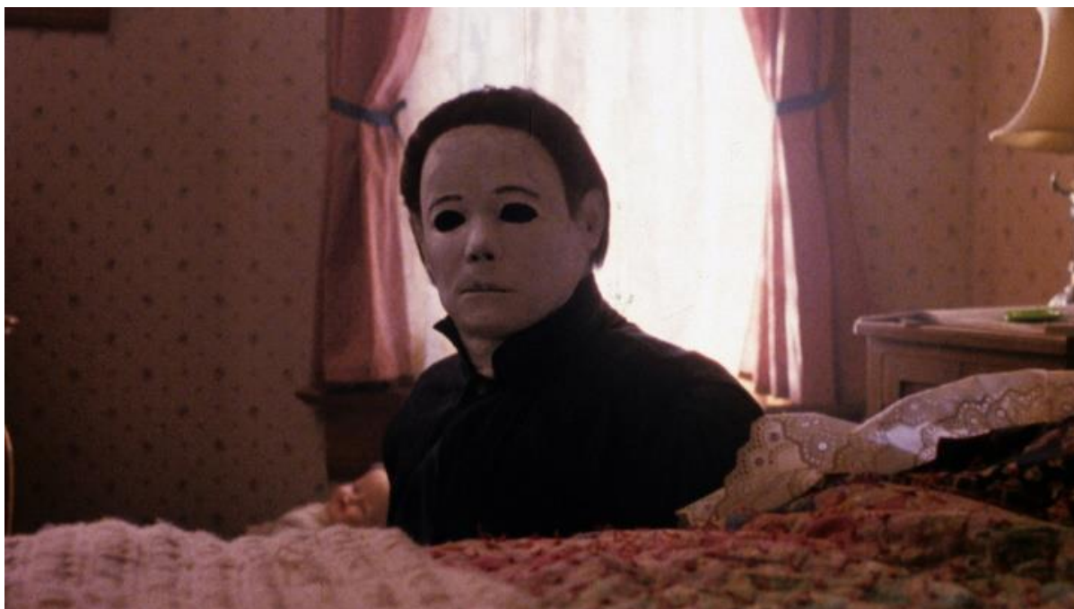
Figur 5 Fra Return of Michael Myers