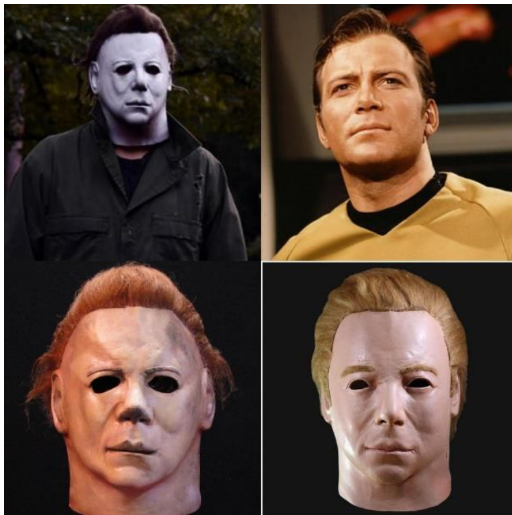
Figur 3: Maske opprinnelse i Halloween 1978

Masken i den første filmen er ikonisk, og folk har kledd seg som antagonisten hver eneste allehelgensaften siden. Det nok ikke alle vet er at masken er basert på William Shatner sitt fjes. Opprinnelig var det en James T. Kirk maske, en karakter fra Star Trek (1966).