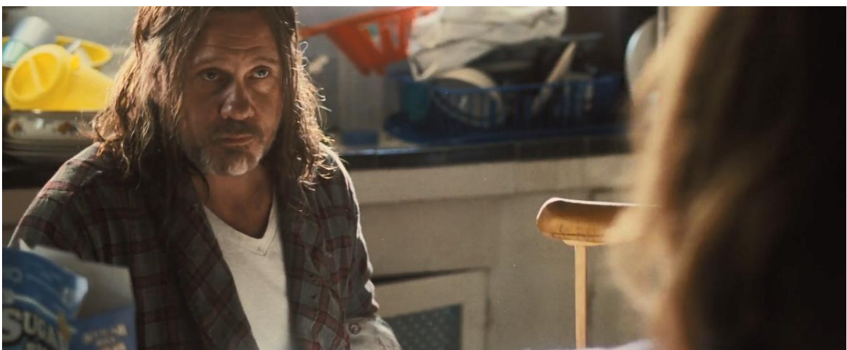
Figur 20 Ronnie i 2007 Halloween

En ny versjon av John Carpenter sin originale film. Denne gang mye mer fokusert på Michael Myers sin barndom og hvordan han ble en morder. Han vokser opp i et hjem med en mor som jobber som stripper spilt av Sheri Moon Zombie, hun bor med sine barn og sin kjæreste ved navn Ronnie. Det er en indikasjon på at dette er kjæresten og ikke faren til barna. Ikke akkurat en god bonuspappa, filmen viser han som en dårlig person med småtendenser til å være tiltrukket av dette universets Judith Myers. I motsetning til originalen er hun en mer vulgær karakter enn i originalen. For i dette nye fiksjonsuniverset ser vi mer av henne.