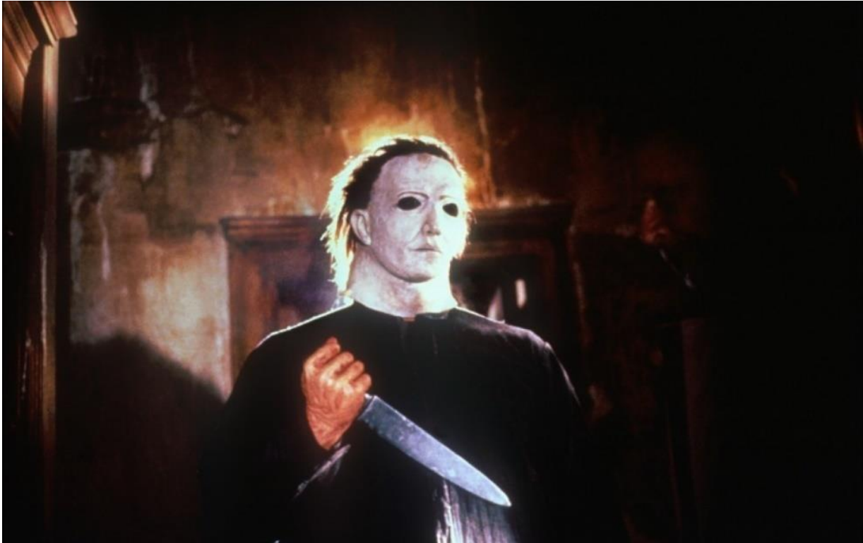
Figur 7 Masken fra Revenge of Michael Myers