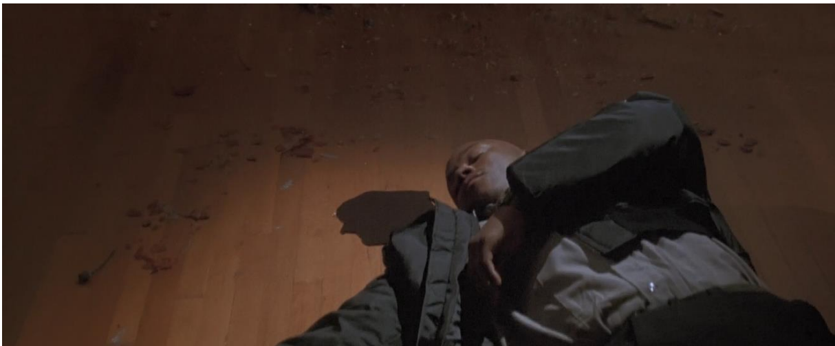
Figur 17 Skjermbilde: Halloween H2O: 20 Years Later (1998, Steve Miner).

Mot slutten av H2O er det en kamp mellom Michael og Laurie, Michael faller fra andre etasje etter at Laurie stakk ham i magen med en stor flaggstang. Laurie går så ned for å sikre seg om at han er død, hun skal til å stikke ham i hjel med en kniv, men LL Cool J kommer og stopper henne fra å utføre hendelsen. Senere kommer det ambulanser og brannmenn, samt politi, Laurie tar så en øks fra en av brannmennene og kjører av gårde med bilen Michael ligger inne i. Michael ligger i en likpose. Laurie har stjålet en likbil. Michael våkner, Laurie bråbremses og Michael fyker ut av frontruten, deretter kjører hun på ham. Bilen går ned en lang grøft. Michael blir fastklemt mellom bilen og en tømmerstokk. Videre ser vi at Michael blir halshugget av Laurie med øksen. Neste film plukker opp direkte hvor denne filmen avsluttet. I neste oppfølger lærer vi at Laurie drepte en ambulansperson som ikke kunne snakke fordi Michael har ødelagt strupen hans (Kennedy, 2019).