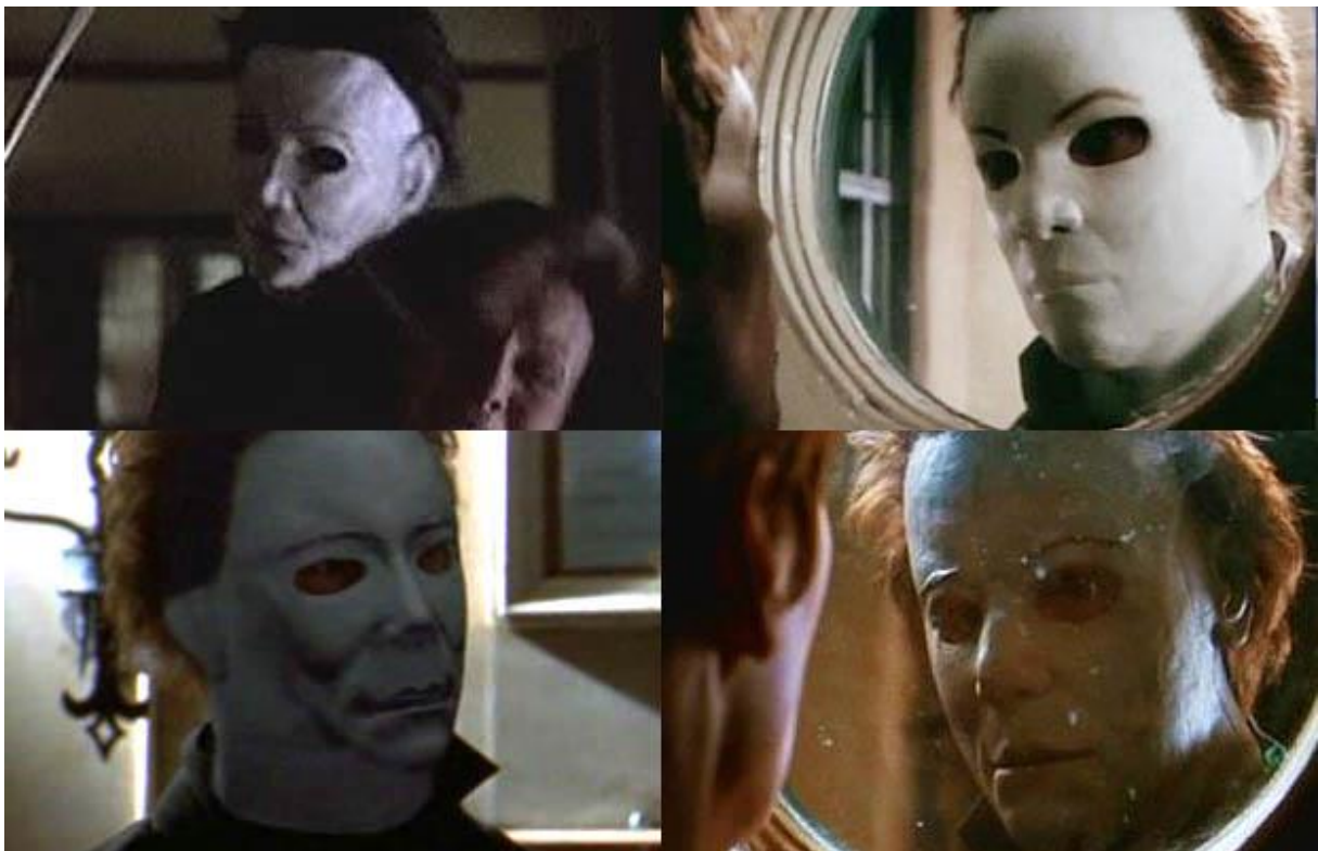
Figur 11: De fire forskjellige maskene brukt i H2O

Stan Winston masken (nederst i høyre), og CGI masken (nederst i venstre). CGI masken er en av de maskene som ikke ble veldig godt tatt imot av tilskueren. «...ability for high-budget productions to now achieve “more convincing” special effects using computer technology has affected virtually all genres and has led to other, non-horror remakes in recent years. Many purists decry the use of CGI in horror» (Church, 2006). Nedenfor kan dere se hvor tydelig annerledes den er, og hvordan teamet bak filmen burde gått i en annen retning. Sekvensen med denne masken varer ikke lenge, men nok til at tilskueren mister troverdigheten. Spesielt med fire forskjellige masker brukt igjennom filmen.