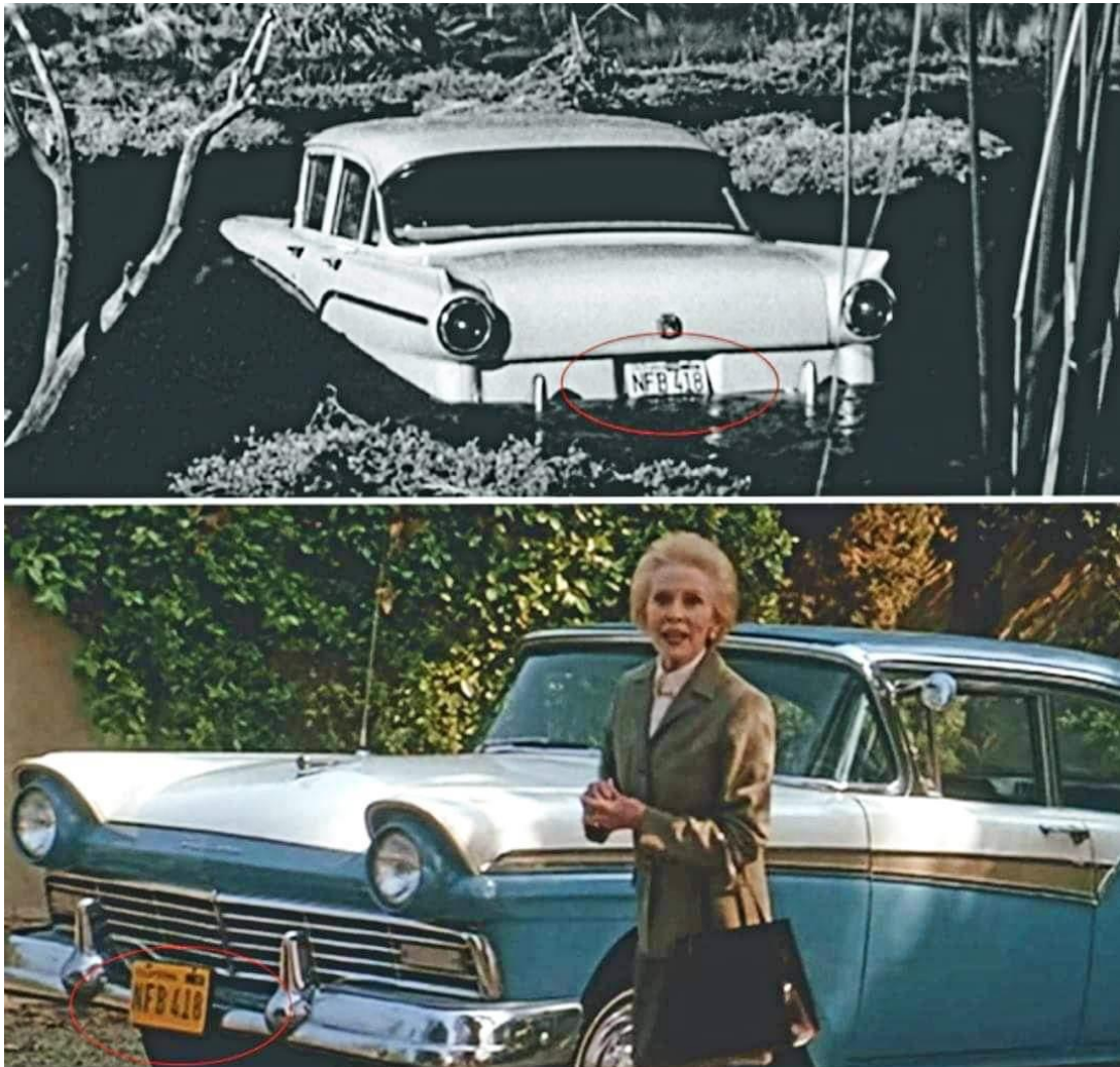
Figur 13 Øverst; Psycho . Nederst; H2O

Curtis. Her fører det til selvreferanse til den første Halloween filmen når Leigh sier « Well, it's Halloween. I guess everyone is entitled to one good scare ». I den første sier sherrifen akkurat det samme til Curtis. Fordi som har et godt øye for detaljer at Janet Leigh sin karakter kjører akkurat den samme bilen her, som hun gjorde i Psycho fra 1960. Se bildet nedenfor.