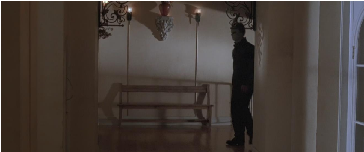
Figur 14 Skjermbilde: Halloween H2O: 20 Years Later (1998, Steve Miner). Helt klart Myers.

av en gang, læreren ser en skikkelse. Som det er helt tydelig at er Michael Myers når vi ser skikkelsen i et totalt skudd. Læreren tar pistolen til Laurie og fyrer av et skudd i retning skikkelsen, som de er helt sikre på er Michael Myers, tilskueren ser dette også meget tydelig. Når de kutter tilbake til et større totalt skudd ser vi nå at skikkelsen var sikkerhetsvakten på campus, spilt av den amerikanske rapperen LL Cool J.