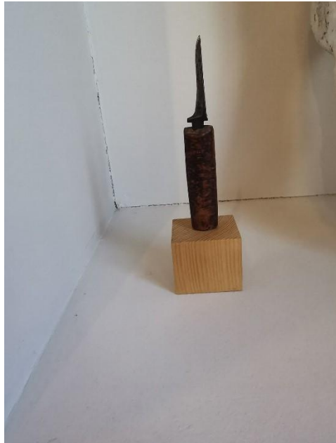
Ill 9: Nils Aas. Kniv/ Arvegods. 2005. Readymade av Knivstål, flammebjørk. H: 24,5cm. Nils Aas Kunstverksted, Inderøy.