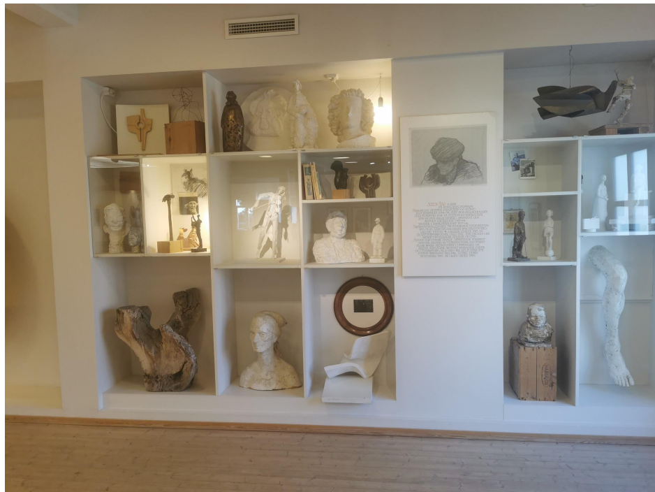
Ill4: Nils Aas Kunstverksted, 1996. Interiør veggen bak på høyre side av rommet.