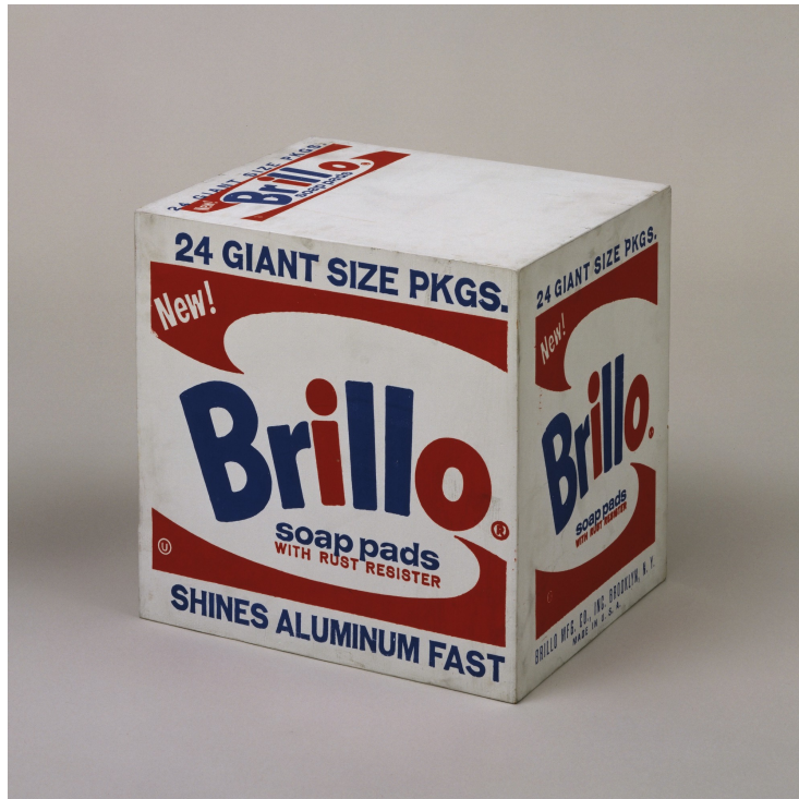
Ill 13: Andy Warhol. Brillo Box. 1964. Syntetisk polymer maling og blekk for silketrykk på tre.