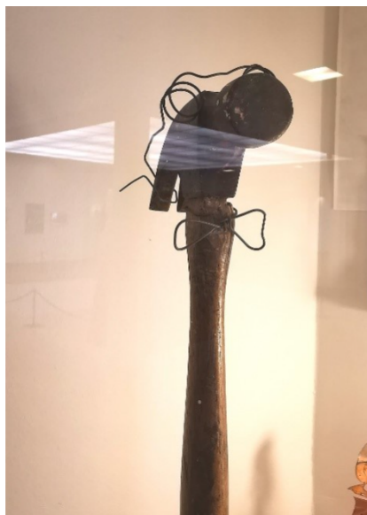
Ill 6: Nils Aas. Portrett av en hammer. 1996. Detalj.