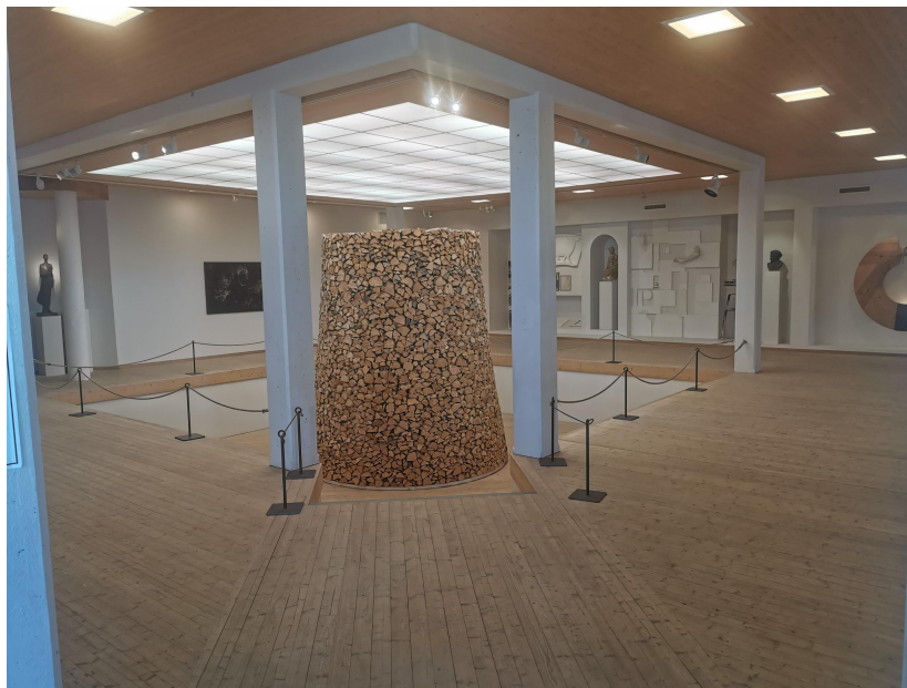
Ill 2: Nils Aas Kunstverksted, 1996. Interiør fra inngangen.