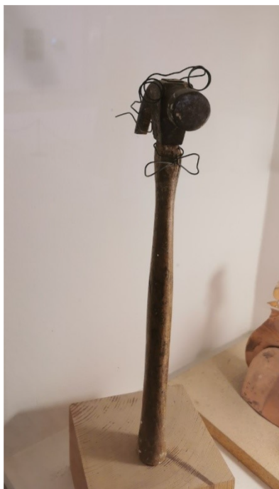
Ill 5: Nils Aas. Portrett av en hammer. 1996. Readymade av tre, jern og ståltråd. H: 46cm. Nils Aas Kunstverksted, Inderøy.