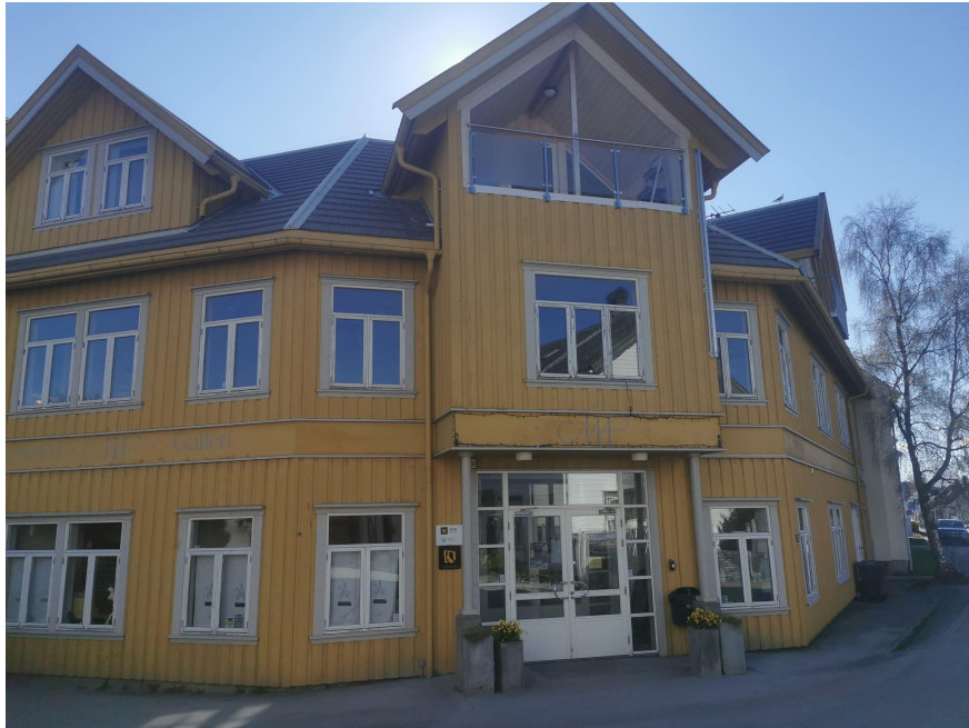
Ill 1: Nils Aas Kunstverksted, 1996. Fasade.