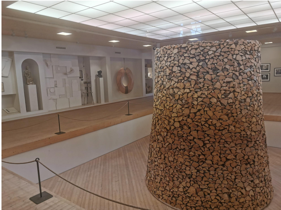
Ill 3: Nils Aas Kunstverksted, 1996. Interiør fra venstre side tatt fra Haakon VII.