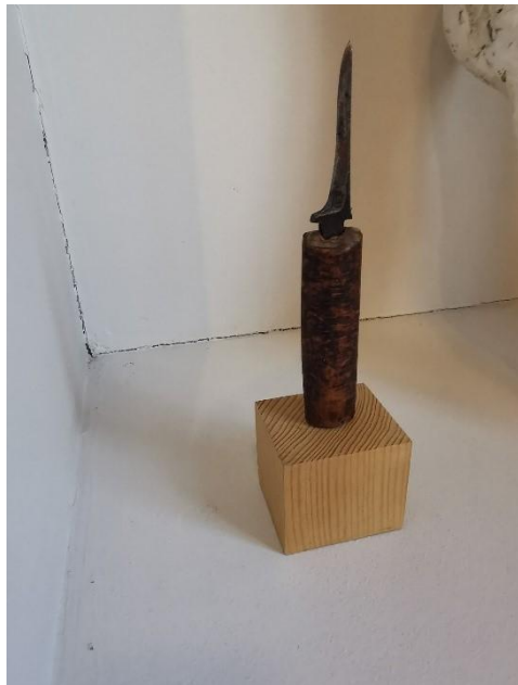
Ill 10: Nils Aas. Kniv/ Arvegods. 2005. Detalj.