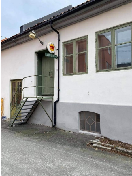
Bilde 4. Moss Bryggeris museum.