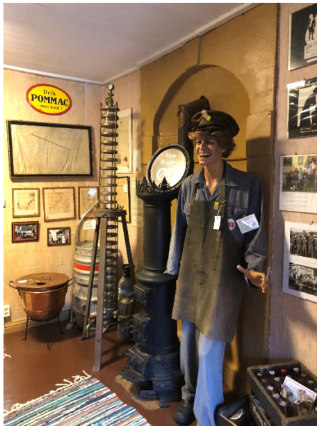
Bilde 5. Moss Bryggeris Museumsutstilling. 20.01.2021

Det vi gjorde først når vi skulle hente gjenstandene var å signere giverkontrakten. Under første henting avtaler man også hvilken orden man skal hente gjenstanden og hvilke gjenstander man skal hente først. Vi fokuserte i første omgang på å hente med oss bilder og annet arkivmateriale. Det er greit å få med seg arkivmateriale først slik at dette forttest mulig kan gå igjennom en prosess der man ser på historikken ved det.