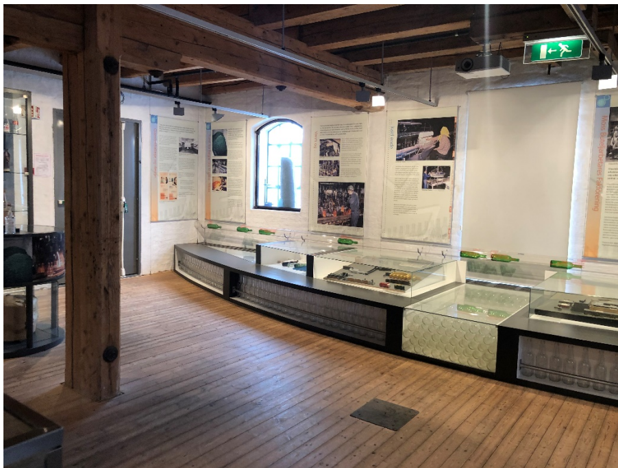
Bilde 1. Museets basisutstilling om Moss Glassverk.

som befant seg inne i bygningen 21 . Museet fokuserer på industrien i Moss, og basisutstillingen deres viser glassemballasje fra Moss Glassverk og PLM, papirindustri, vannkraft og hvordan produksjonen med møllene fungerte når de var i bruk. Det at bygningen tidligere var et industribygg gir et spesielt preg til utstillingen. Når man kan gå gjennom utstillingen og se originale møller fra den tiden de var i bruk, er det noe helt spesielt. Man får en følelse av hvordan det kunne vært på den tiden.