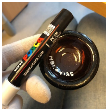
Bilde 12. Merking av flasker. 17.02.2021