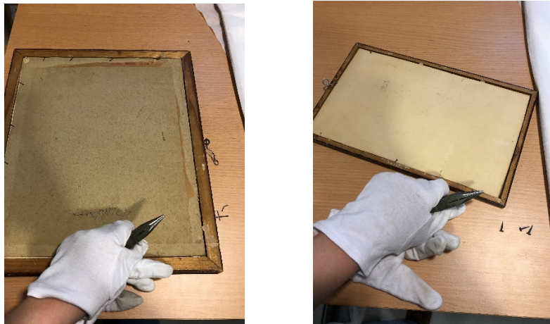
Bilde 6 og 7. Fjerning av ramme rundt bilder.

bildene i små stabler etter hvilken tidsperiode hun mente de var fra slik at de kunne registreres med noenlunde samme historikk.