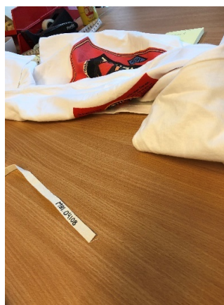
Bilde 10. Merking av tekstil.