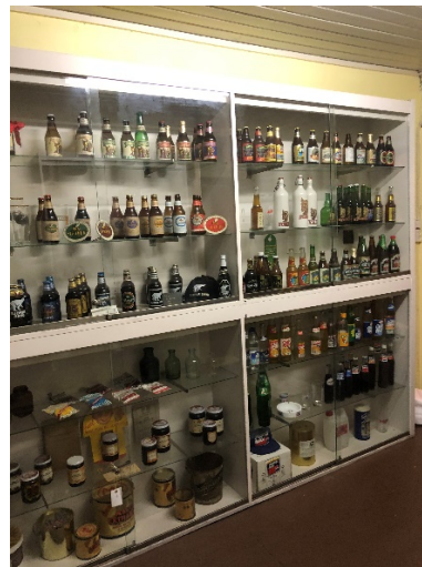
Bilde 2 og 3. Moss Bryggeris Museums utstilling.