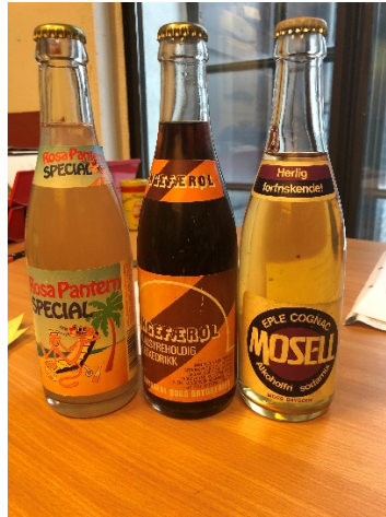
Bilde 11. Flasker med innhold og crown cork fra Moss Bryggeri.

Av alle gjenstandene vi hentet var det flasker det var mest fokus på siden det var gjenstander fra det nedlagte Moss Bryggeris museum.