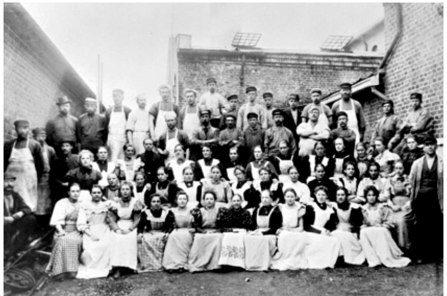
Figur 1 (øverst til venstre): Klasse ved pikeskolen på Hamar, ca. 1884-1887; Figur 2 (øverst til høyre): To telefondamer, ca. 1899; Figur 3 (nederst til venstre): Betjeningen ved Hamar Nøkterhedscafe; Figur 4 (nederst til høyre): Arbeidsstokken ved Hamar Melkefabrikk, ca. 1899-1910. 1