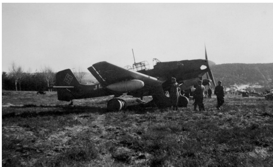
Omslagsbilde: En Junker JU87 «Stuka» på Værnes 1940-1945.