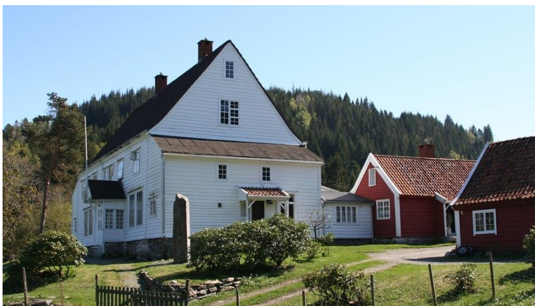
Figur 2: Lillingstonheimen slik den ser ut i dag. På bildet vises hovedhus med tilbygg, og helt til høyre står eldhuset.