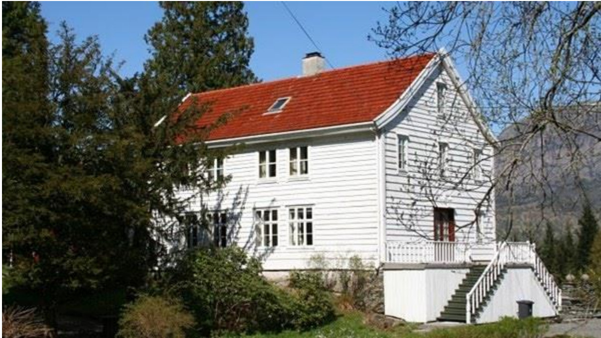
Figur 5: Fagervik slik det ser ut i dag. Her bodde Lillingstonfamilien før de flyttet til Tysse i 1880.