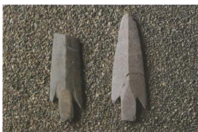
Figur 3 (Fagerli, s. 46, 1989)

Lierne kan ha blitt befolket for så legge siden som 5-6000 år siden. Akkurat når de først bosetningene kom er vanskelig å si, men rundt 4-3000 år f.Kr. er det funnet redskaper fra skiferkulturen som lagde redskaper blant annet fra skifer i stede for flint som var normalt i Fosnakulturen. Skifer er også lettere å ha med å gjøre og mindre tidkrevende å lage redskaper av (Fagerli, s. 45, 1989). Et av disse funnene er funnet ved helt Nord-vest for havdalsvatnet som vist ved bildet ovenfor. Løsfunnet er en skifer spydspiss som ble funnet helt for seg selv under torva helt ved vann kanten. Havadalsvatnet er bare et par mil sør for Tunnsjøen og ifølge Lierne bygdebok bok 1 er det også flere funn skifer spydspiss funn i området. Blant annet skal det være funnet en spydspiss ved Ingelsvatnet som ligger mellom Havadalsvatnet og Tunnsjøen. I tillegg skal det også vær et skiferspydspiss ved Linås i Tunnsjø, og ikke langt unna der igjen skal det ha blitt funnet et tverregget øks fra steinalder tiden (Fagerli, s. 46-47) Disse funnene viser til at det har vert aktivitet i området rundt Tunnsjøen helt tilbake som i steinalderen. selv om det er vanskelig å finne ut av om det var samisk/norsk/skandinavisk folk som holdt til i disse områdene på denne tiden, er det et bevis på at det har vert aktivitet i