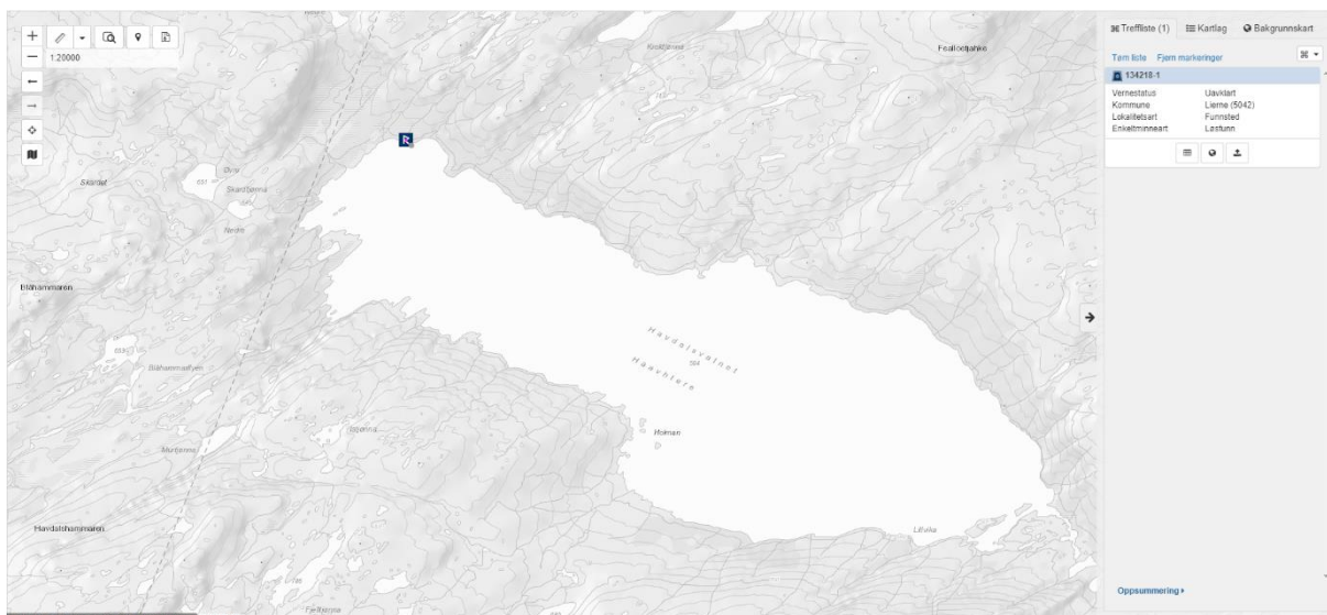
Figur 2 (Askeladden, 2021)