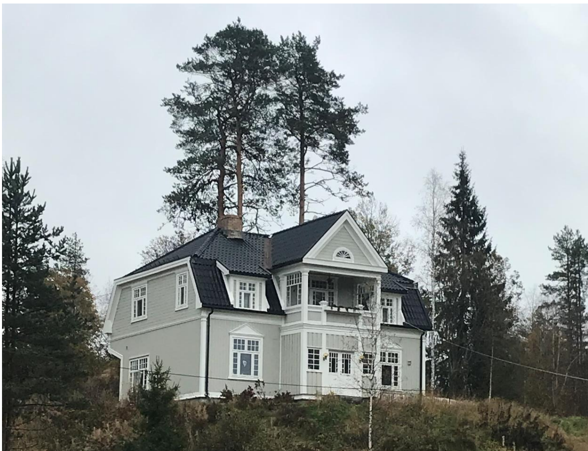
Figur 4 Et av de tidligere landhandleriene på Svullrya, i dag bolighus.

Det er i kombinasjonen av kildene vi får en helhetlig historie og en historie som er formidlingsvennlig til et stort publikum. Historiene bør formidles på en måte som tilgjengeliggjør den til andre enn faglærte som er lært opp til å se, tolke og samle informasjonen, men også til mennesker uten denne kunnskapen. Formidlingen av denne historien kan gi de kunnskap de kan bruke for selv å begynne å se og forstå de fysiske sporene vi har rundt oss.