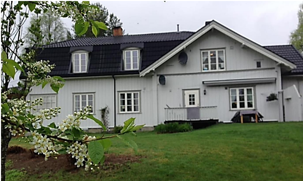
Figur 9 Et moderne bilde av Doktorboligen. Husets to stiler kommer tydelig frem.

Dette huset startet som veldig mange av de andre husene på Svullrya som et lite tømmerhus. Med kjøkken, stue, to værelser og en sval utenfor kjøkkenet. Det er slik huset er beskrevet i 1912 (Norges Brannkasse 1912: 117). En stund etter blir tømmerhuset panelt inn, og fikk et uttrykk i sveitserstil.