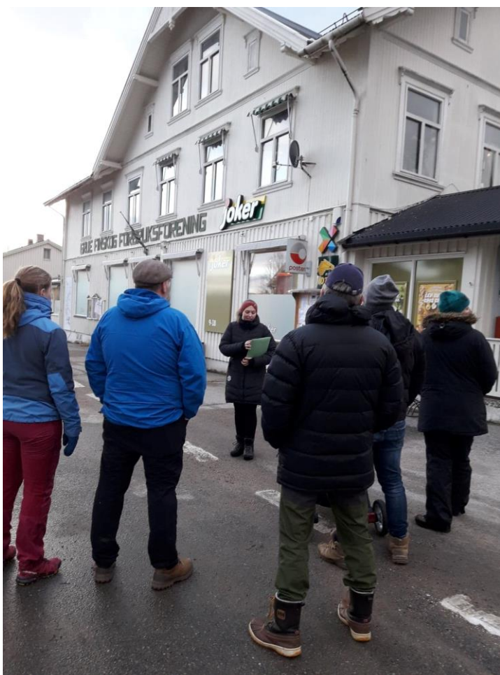
Figur 2 Gruppe 2 utenfor Grue Finnskog Forbruksforening. Like før de får utdelt historiske bilder.

Metoden i denne undersøkelsen er valgt for å kunne gjennomføres på en måte som setter fokus på husene som tidsvitner, og samtidig involverer publikum. Metodene henger sammen med teoriene som er presentert i kapittelet over. Undersøkelsen inneholder derfor en god del praktisk arbeid, og arbeid knyttet til eksterne deltagere. I forkant og underveis i prosjektet er det blitt gjort en del metodiske valg for å gjøre prosjektet gjennomførbart og det er gjort flere avgrensninger underveis. Det blir også reflektert rundt omliggende og usikre elementer som det ikke rådes over, annet enn at man kan forsøke å forminske disse så godt man kan.