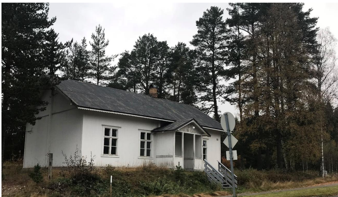
Figur 5 Stedsvandringen begynte ved Bedehuset, på nedsiden av Thygesen-huset. Huset ligger i skillet mellom Svullryas tettbebyggelse og skogen.

På andre siden av veien ligger bedehuset, et lite og enkelt sveitserhus. Det er ikke så mye informasjon om akkurat dette huset, eiere eller bruk. Men det er et av husene jeg fant i regnskapsbøkene etter Røgden Dampsag og Høvleri (Bredesen Opset). Der det var kjøpt en rekke materialer til «bedehuset». Røgden dampsag ble lagt ned og driften flyttet til Bredesen Opset på Kirkenær i 1968 (Ottesen 2017: 150). Huset forteller mer om sammenhengen disse husene har til skogen, og de materialene som ble produsert på det lokale sagbruket. Dette kan gi et interessant perspektiv på hvilke stiler og byggeteknikker som er blitt brukt på husene på Svullrya.