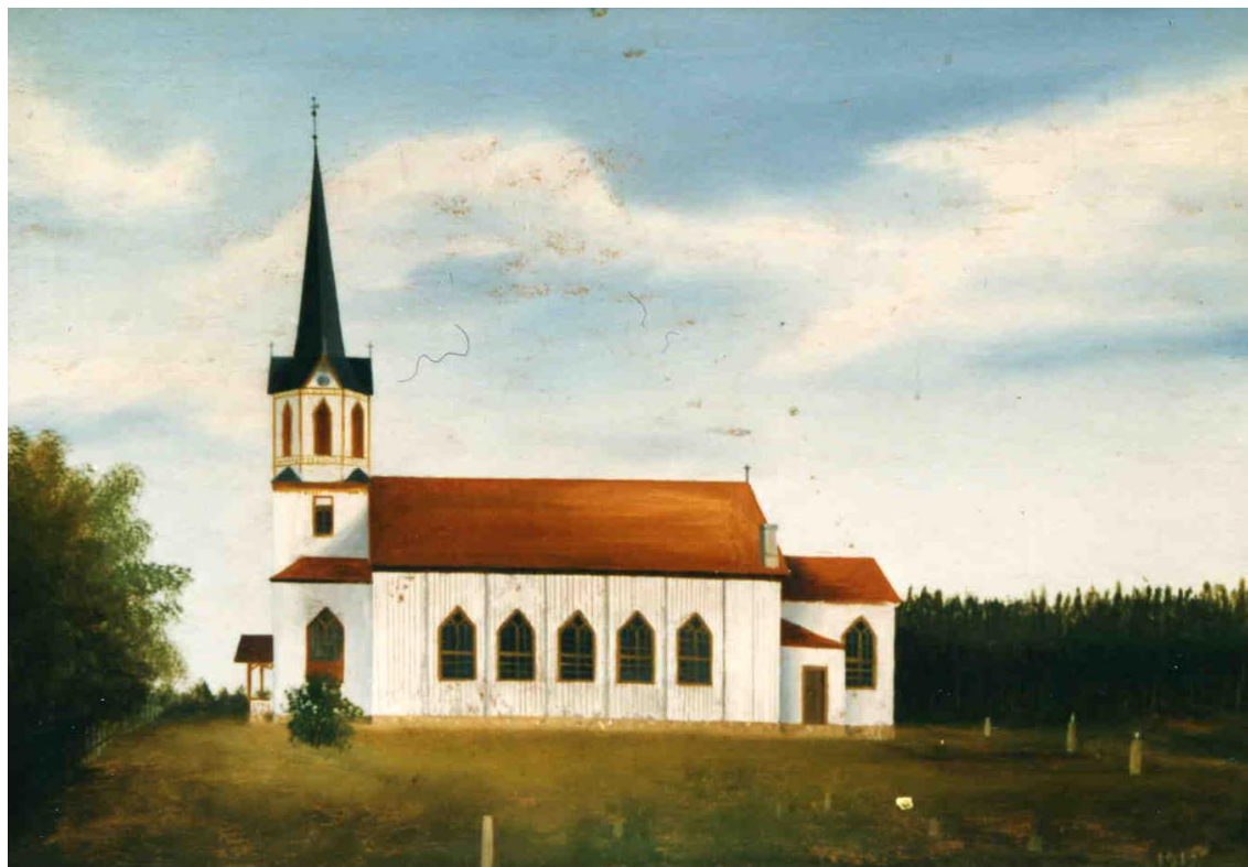
Figur 8 Maleri av Grue Finnskog kirke, trolig fra 1917. Eier: Privat.

Den finske studenten Carl Axel Gotlund var på rundreise på Finnskogen i 1821. Han fremmet et ønske om å bygge en kirke for skogfinnene ved sjøen Store Røgden, denne ble aldri bygget der. Etter dette kjempet skogfinnene for å få en egen kirke, så de skulle slippe den lange turen ned til Grue kirke. Spesielt for barnedåp og gravferd som var ekstra krevende. De forsøkte først ved å avlegge et besøk til kongen i Stockholm i 1823, som ikke ga resultater. Deretter begynte en politisk prosess når formannskapet i Grue ble opprettet i 1838 (Collett 1978: 189).