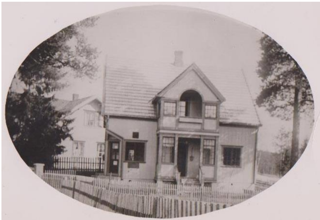
Figur 7 Poståpneriet hadde inngang i det inndradde hjørnet.