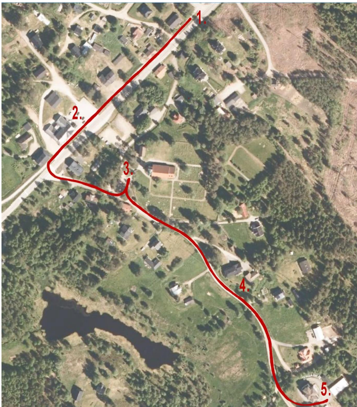
Figur 11 Stedsvandringens rute vist i kart. De fem stoppene er markert.