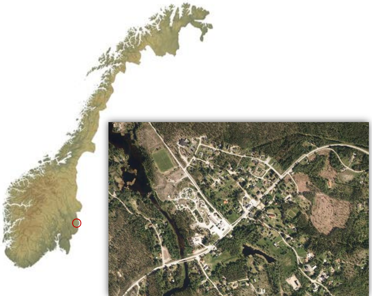
Figur 1 I Innlandet fylke, i Grue kommune finner vi Svullrya. Svullrya er et sentrum i Grue Finnskog. Finnskogen strekker seg geografisk over deler av flere kommuner i fylket, og over grensen mellom Norge og Sverige.