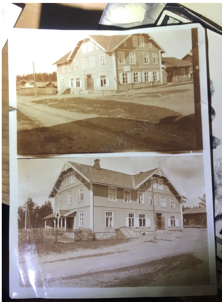
Figur 6 Et foto av Grue Finnskog Forbruksforening fra en samling gamle bilder etter Wiger-familien. Bildet er ikke datert, men trolig fra når butikken nylig hadde fått påbygg og kledning.

Grue Finnskog Forbruksforening ble etablert i 1872 (Trøseid 1990: 516). Landhandleriet har vært i kontinuerlig drift siden etableringen, i samme form og i samme bygg. Forbruksforeningen kan dermed være å regne som en av landets eldste butikker. Trolig den viktigste pådriveren for etableringen av forbruksforeningen var lærer Ole Qvale. Han ses som er en av de store og viktige ildsjelene på Svullrya.