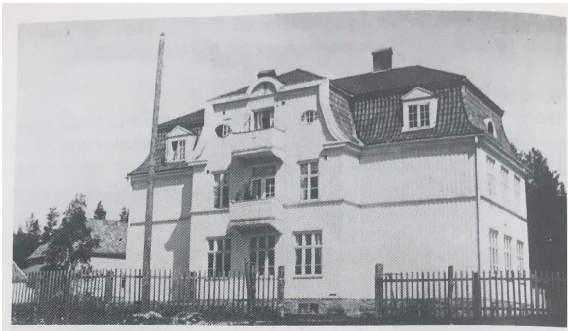
Figur 10 Gamle Svullrya skole var siste stopp i stedsvandringen.

De hålla nu på att resa ett flott palats like invid Solhem. Det är det nye skolhuset.