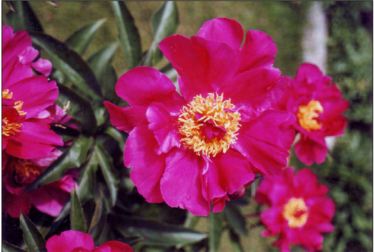
Figur 4. Silkepeon Paeonia lactiflora fra ST Trondheim, Stubbsvingen 59 med halvfylt, klarrød blomst.

flyttet til Hopla i 1904. Huset ble i en årrekke brukt til butikk. Røsdal vokste opp i Hopla vestre, men flyttet derfra i 15-årsalderen for 40 år siden. Pionen har vært der så lenge han kan huske. Det betyr at den kan være 50-60 år gammel. Pionen blir ikke stelt, men gjødsles av svaler som har reir oppunder takskjegget på låna.