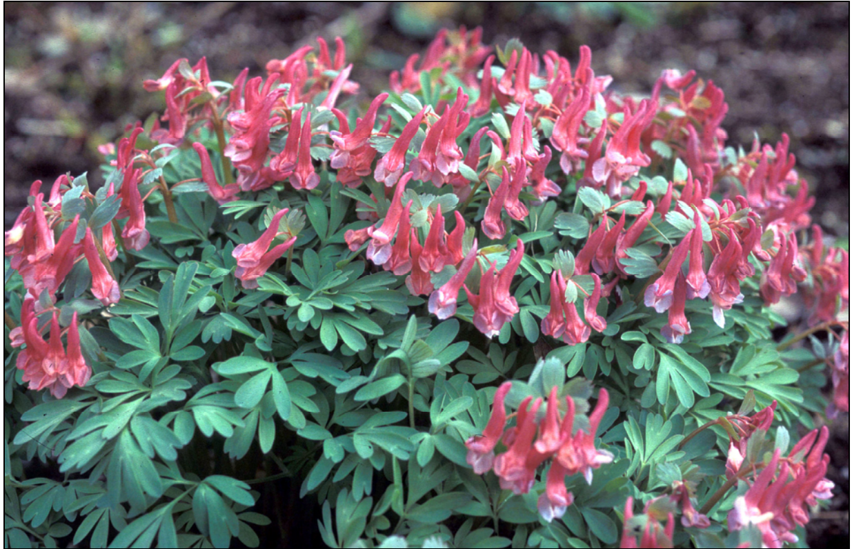
Figur 1. Hagelerkespore Corydalis solida har en form ('George Baker') med lakserøde blomster og tette tuer. Det er en dekorativ, tidligblomstrende plante. Plante fra ST Trondheim Hyllveien 11B, fotografert i RBH våren 2005.