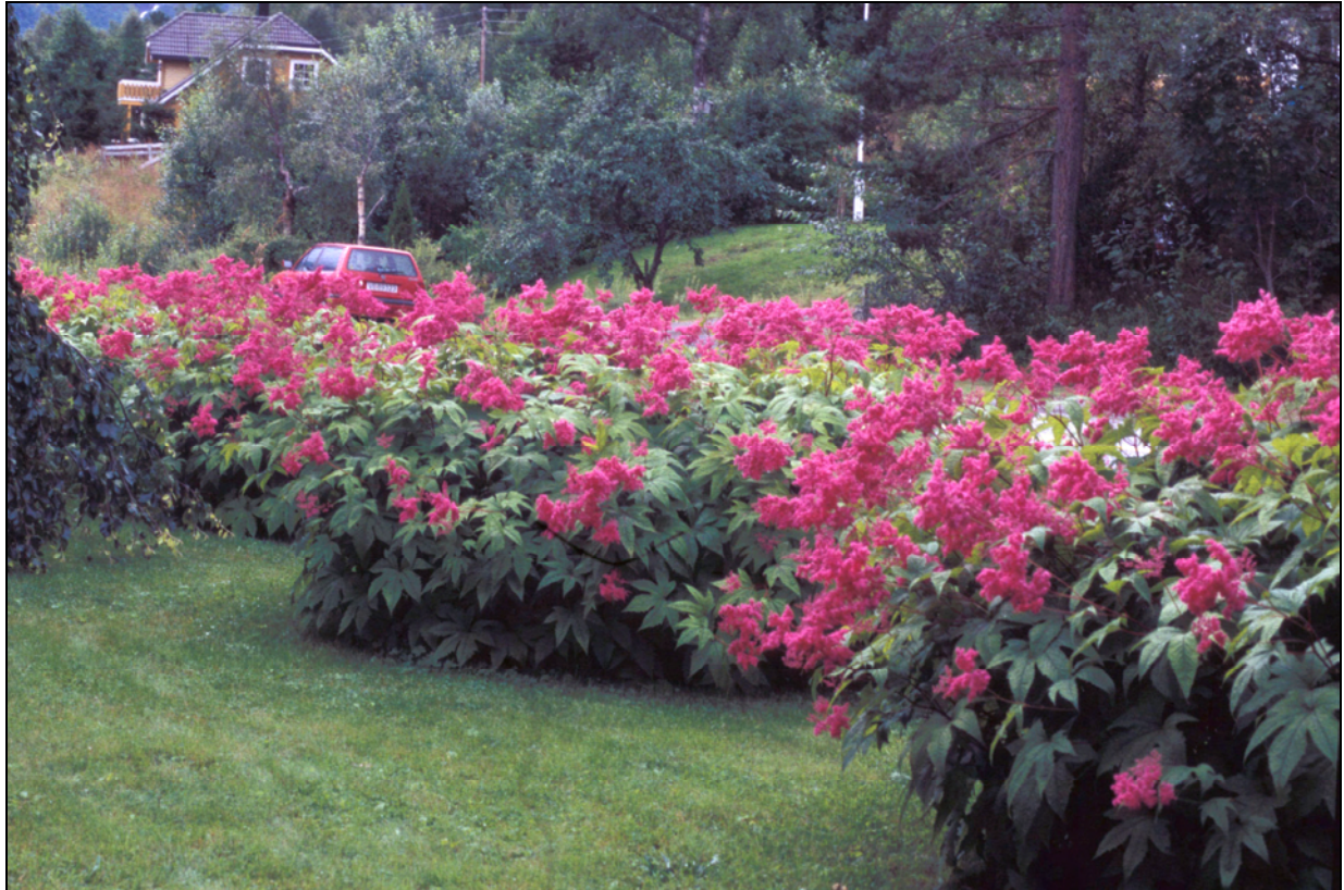
Figur 3. A Rosemjøduert Filipendula purpurea er lavere enn kjempemjøduert og danner tette ”busker”.