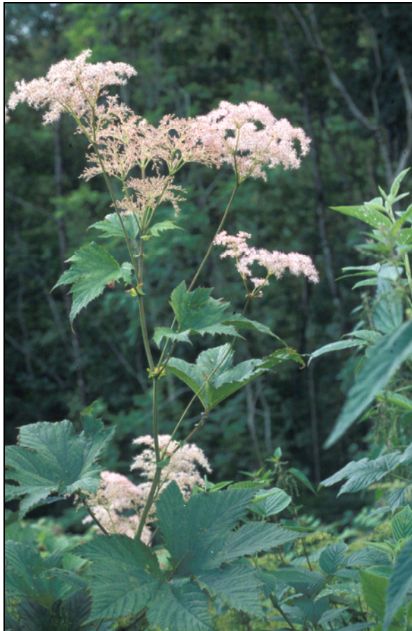
B Form med rosa blomster, SF Førde, Føde.

med en lysebrun farge, mens de er rent gule på den andre formen. Vi har foreløpig ikke grunnlag for å kalle den mørke formen noe annet enn gul daglilje. Begge formene er plantet ut i ventebed i RBH.