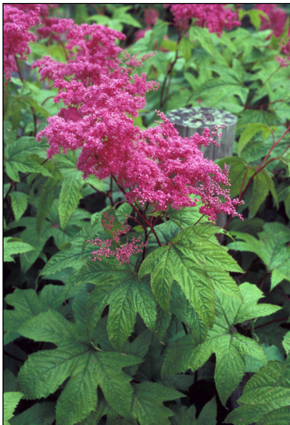
B Den har vanligvis sterkt purpurfargete blomster i store mengder. Fra MR Sykkylven, Velledalen.