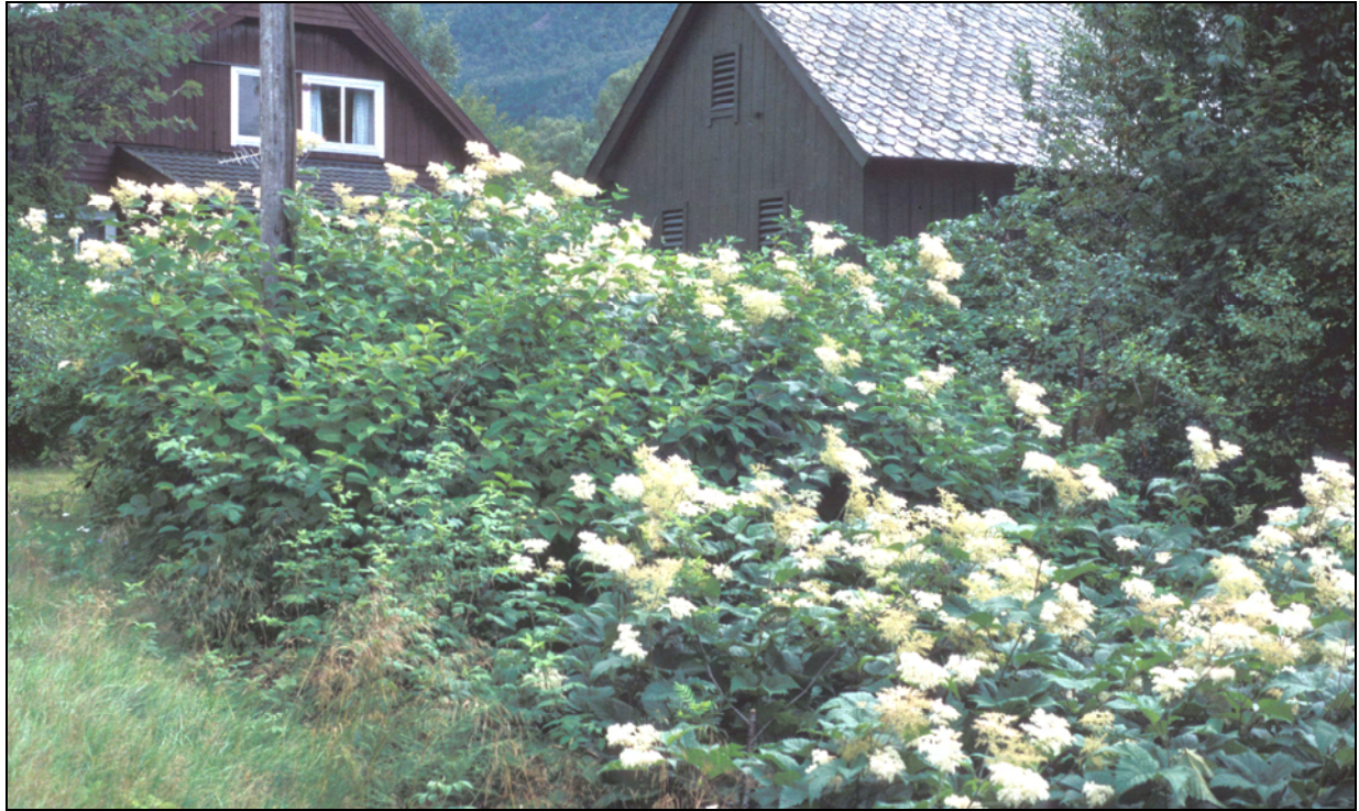
Figur 2. Kjempemjødurt Filipendula kamtschatica er en av de største hagestaudene og kan danne tette bestander som nok må holdes i sjakk for ikke å ta overhånd i bedene. A Hvitblomstret form, SF Jølster, Vassenden.