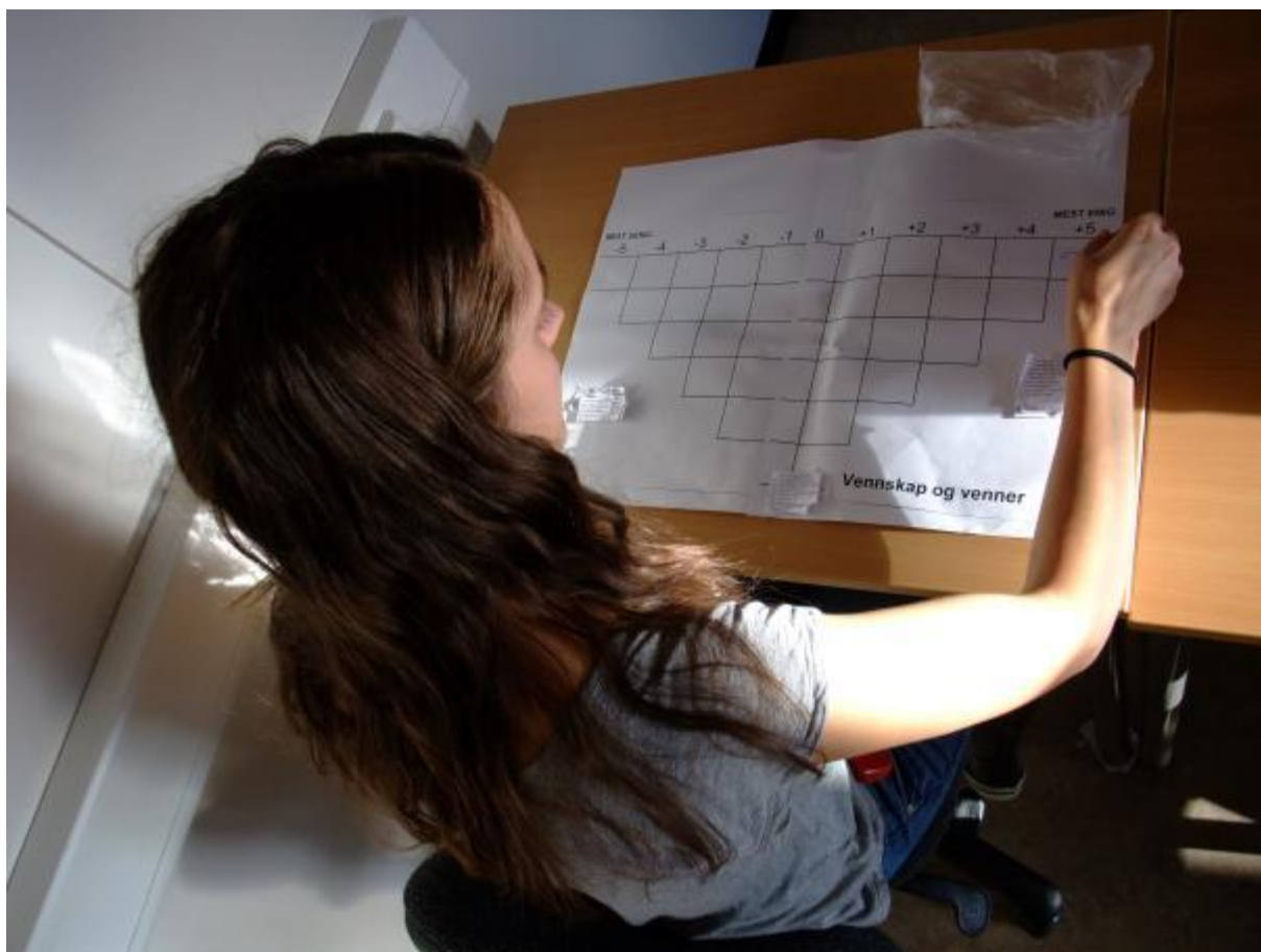
Illustrasjonsfoto ved Pia-Liisa Savonius Nystad