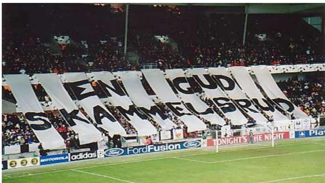
Figur 11- Tifo frå kampen mellom Rosenborg og Lyon i 2002.