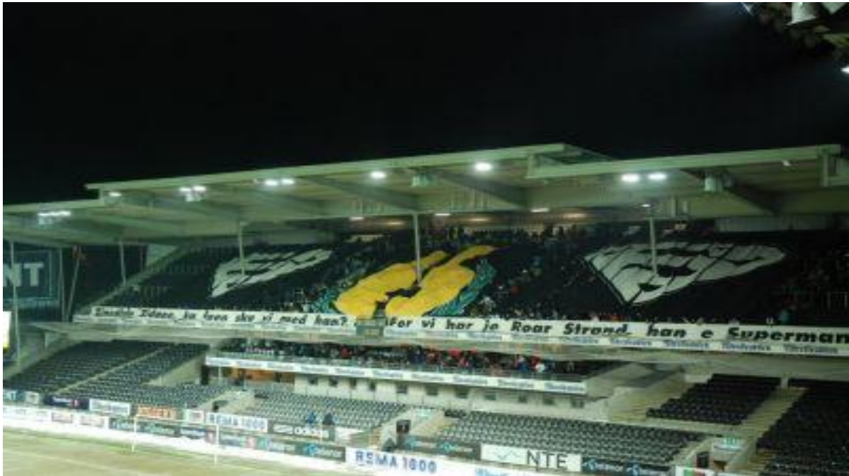
Figur 13- Tifo frå hyllestkampen til Roar Strand på Lerkendal stadion i 2011.