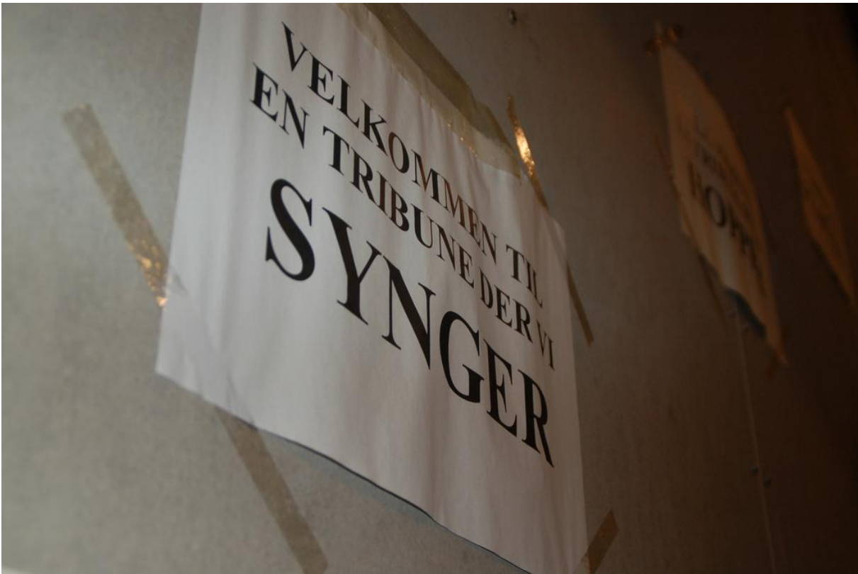
Figur 7- Plakatar som heng på veggane på veg opp til Øvre Øst.

Både blant medlemmar av Kjernen og blant andre supporterar er det eit varierende syn på grupperingar som Ultras Nidaros. Dette kan det vere mange årsakar til. At ein ikkje veit kva ei gruppering som Ultras Nidaros eigentleg er ein av grunnane. Dei er lett å forveksle med fenomen som «hooligans» og «casuals», noko eg vil kome meir innpå i neste avsnitt. Då eg prata med tidlegare Rosenborgtrenar Nils Arne Eggen kom han med ein kommentar som gjekk på at han ikkje likte grupperingar som Ultras Nidaros, eigentleg utan å argumentere kvifor. Han meinte at dei hadde ein dårleg åtferd, og han likte ikkje det dei dreiv på med. Denne kommentaren frå Eggen kan tyde på lite kunnskap om ultrasgrupperinga, men først og fremst kan det tyde på at ein har vanskelig for å plassere ultras inn i ein kategori som gjev mening.