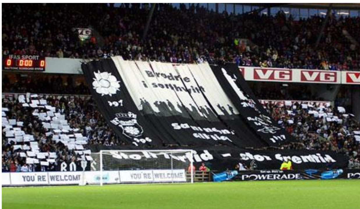
Figur 2- Stolt fortid-stor framtid-bannaret laga til Vålerenga-kampen i 2005.