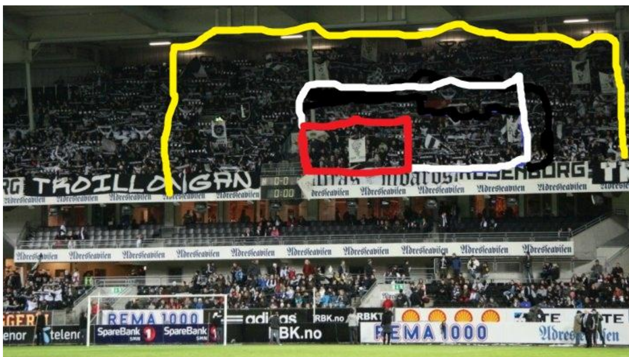
Figur 6- Plasseringa til dei ulike supportergrupperingane oppe på Øvre Øst tribunen.