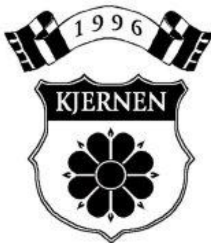
Figur 4- Logoen til Kjernen (Illustrasjon: Kjernen.com).

Dersom ein studerer logoen til Kjernen og tenkjer over kva supporterklubben eigentleg heiter, kan ein samanlikne denne Kjernen med diverse andre kjernar. Det som først kjem opp hjå meg er atomkjernen i eit atom. Ein har ei kjerne og fleire, mindre kjernepartiklar som dannar denne atomkjernen. Akkurat uttrykkje «fleire kjernepartiklar» skal eg kome tilbake til. Det er tydeleg at symbolet i logoen til Kjernen ikkje er tilfeldig vald, det symboliserer drivkrafta og grunnfjellet blant Rosenborgsupporterar. Bykjernen og kjernen i ei frukt er kjernar ein kan samanlikne symbolet med. Bykjernen er noko sentralt, viktig og har ein viss størrelse, mens i fruktkjernen finn ein frøa og fruktkjøtet. I ein artikkel publisert på RBK web, ein nettstad for og av Rosenborgsupporterar, skriv forfattaren om «fleire kjernepartiklar» som han kallar det (Myren 2006). I avsnitta som følgjer vil eg skrive litt om dei ulike «kjernepartiklane» ein kan finne i supportermiljøet rundt Rosenborg.