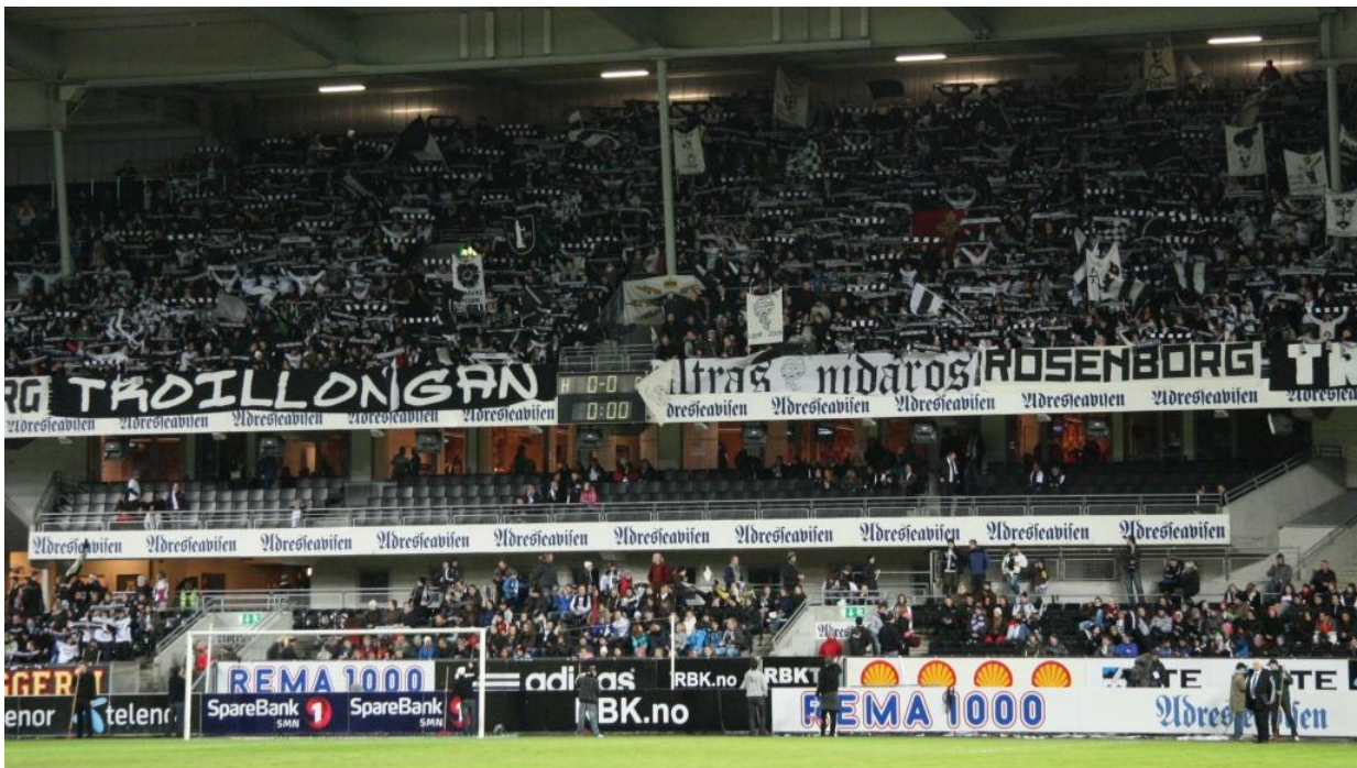
Figur 5- Øvre Adressa tribunen, kalla Øvre Øst (Foto: Kjernen.com).

Tribunen der dei aktive supporterane stand, kallar dei sjølve for Øvre Øst. Tribunen heiter eigentleg Øvre Adressa, og er staden Kjernen blei flytta til frå tribune Nedre Vest på motsett side, men då hadde dei plassering rett bak målet. Eg kjem til å omtale tribunen som Øvre Øst gjennom oppgåva, då eg føler at det blir feil å omtale tribunen som Øvre Adressa sidan det så og seie aldri blir brukt blant supporterane sjølve, iallfall ikkje blant dei eg hadde noko med å gjere. Bilete over viser tribunen til Kjernen, og der finn ein òg dei andre kjernepartiklane i supportermiljøet som eg har nemnd. Målet til Kjernen har lenge vore å fylle opp Øvre Øst tribunen mest mogleg, men tendensen er at det er trengt om plassen akkurat på midten, der alle dei aktive stand, mens det er godt med plass og lite liv ute på kantane. Det viser seg å vere vanskeleg å få med dei som stand ute på kantane, av uvisse grunnar i følgje supporterane sjølve. Dei hadde sine forventningar om kvifor det var slik, men kunne eller ville ikkje påstå noko spesielt.