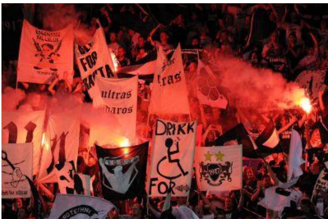
Figur 12- Tifo frå kampen mellom Rosenborg og Molde på Lerkendal stadion i 2011.