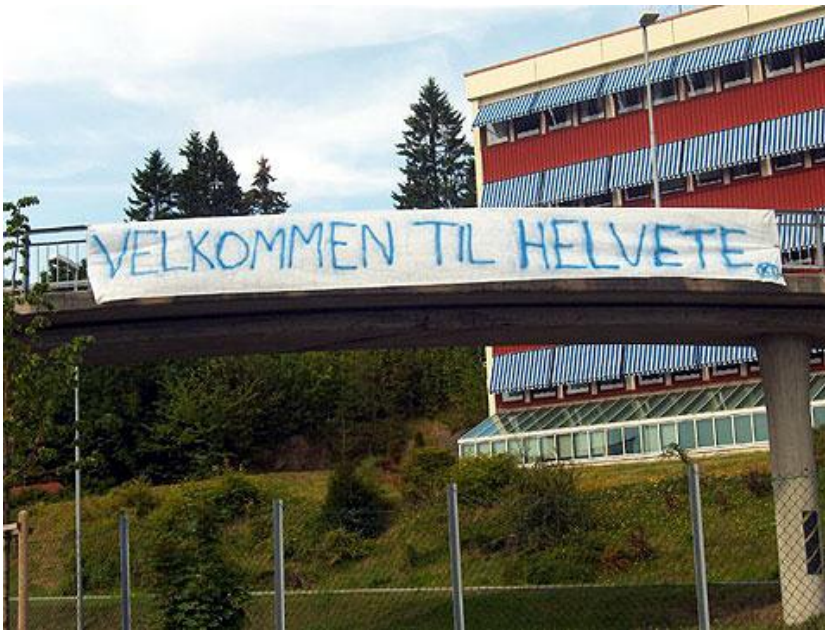
Figur 9- Baner hengt opp av Molde sin supporterklubb, Tornekraftet, før ein kamp mellom Molde og Rosenborg i 2006.