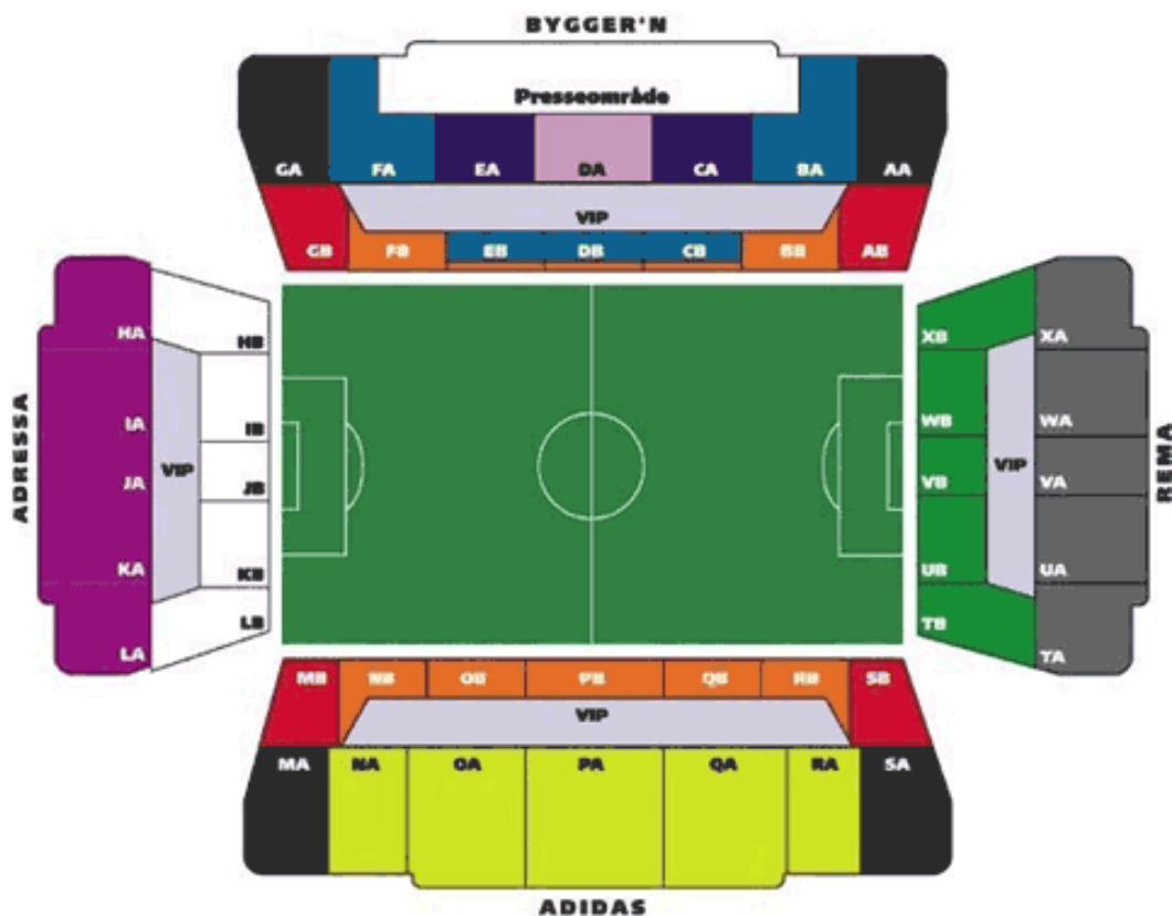
Figur 3- Ei skisse av Lerkendal stadion, og korleis dei ulike delane av stadion er delt inn i ulike felt.

motstand, som moglegvis kan vere hovudgrunnen til at dei ikkje tok gull meiner mange fotballekspertar. Trass i mykje motgang og ein sesong fylt med mykje konflikhtar, greidde Rosenborg og ta sølv i 2011, og er dermed kvalifisert til neste års Europacupspel, som er eit av hovudmåla til klubben å bli betre på. Kjernen sin promosjonsvideo for 2012 inneheld mykje om å kome tilbake og å erobre Europa på ny. Økonomisk har klubben slitt i fjorårets sesong, og indre uro har prega biletet. Det har vore utskiftingar både på sjølve laget og i administrasjonen då sentrale personar i styret har velt å gå. Dette vil eg gå meir inn på seinare i kapittel seks om kommersialiseringa.