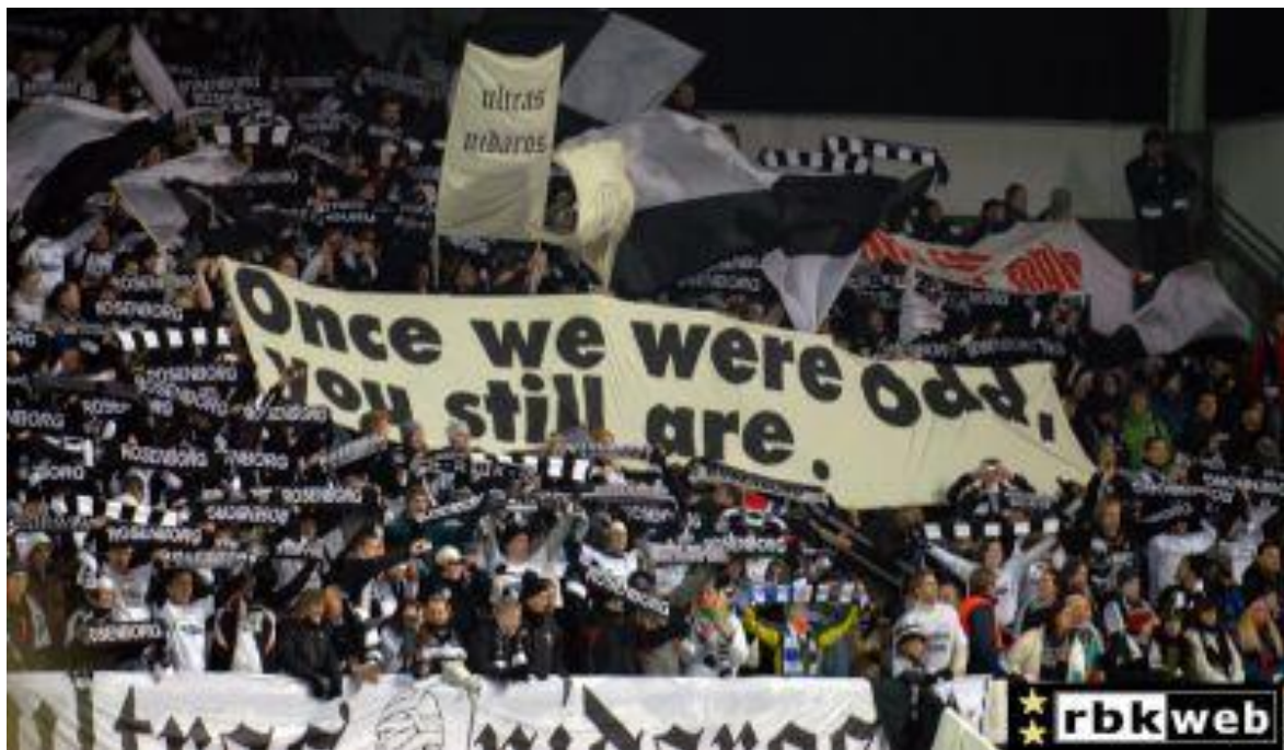
Figur 14- Tifo frå kampen mellom Rosenborg og Chelsea i 2007.