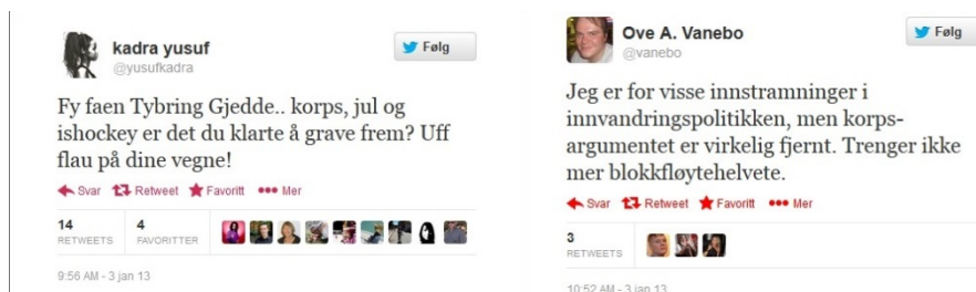
Figur 1: Kommentarer på Twitter etter et av Tybring-Gjeddes utsagn i kulturdebatten, 3. januar 2013.