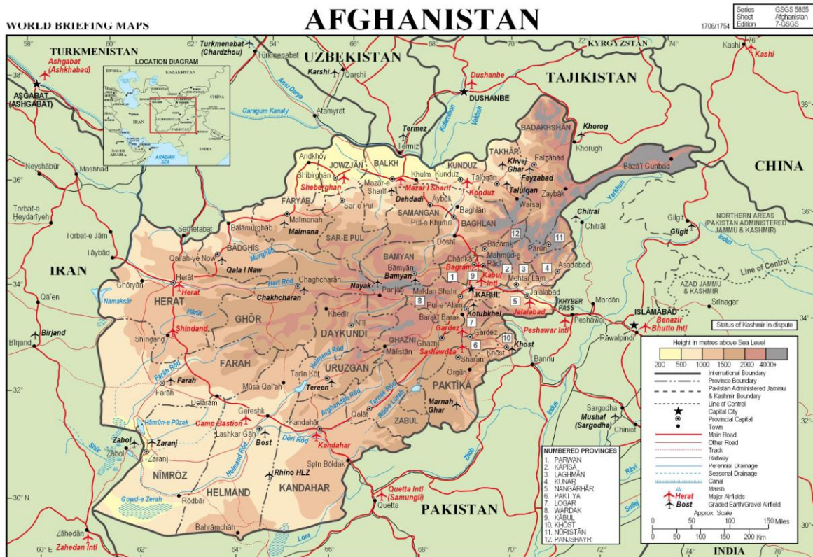
Kart 1: Topografisk kart over Afghanistan