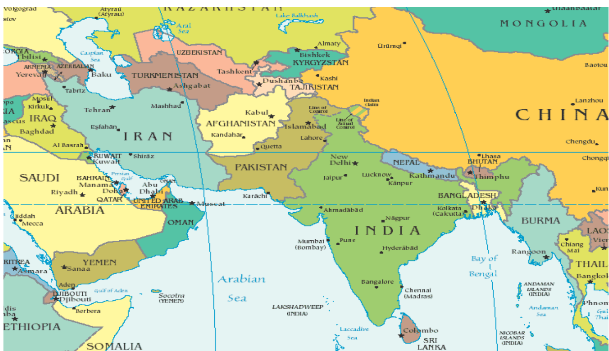
Kart 2: Sentral-Asia

Enhver stat i det internasjonale samfunn handler i en anarkisk verden, fordi det er ingen overordnet autoritet som har mulighet til å slå ned på en stat som ikke følger de satte spillereglene (Waltz 2001: 187-210). For hver enkelt stat er det å forholde seg til de andre aktørene, statene, det som blir gjeldende for å ivareta sin egen sikkerhet. Til syvende og sist er det statens egen overlevelse som er hovedmålet, og det målet som ligger til grunn for all politikk staten fører (Waltz 2001: 187-210). Med systemet menes det altså en region med flere aktører som på en eller annen måte må ta hensyn til hverandre i utarbeidingen av sin egen politikk. Ved en gjennomføring av en viss politikk, vil dette kunne være med å utløse en reaksjon fra noen av de andre aktørene. For denne oppgaven vil systemet bli sett på som regionen Afghanistan befinner seg i, Sentral-Asia. For den nyklassiske realismen spiller systemet en viktig rolle, og den aktuelle stats kapabiliteter vil være en viktig faktor i dets ambisjoner (Rose 1998). En økning av statens kapabiliteter vil også øke statens ambisjoner i systemet det er en del av.