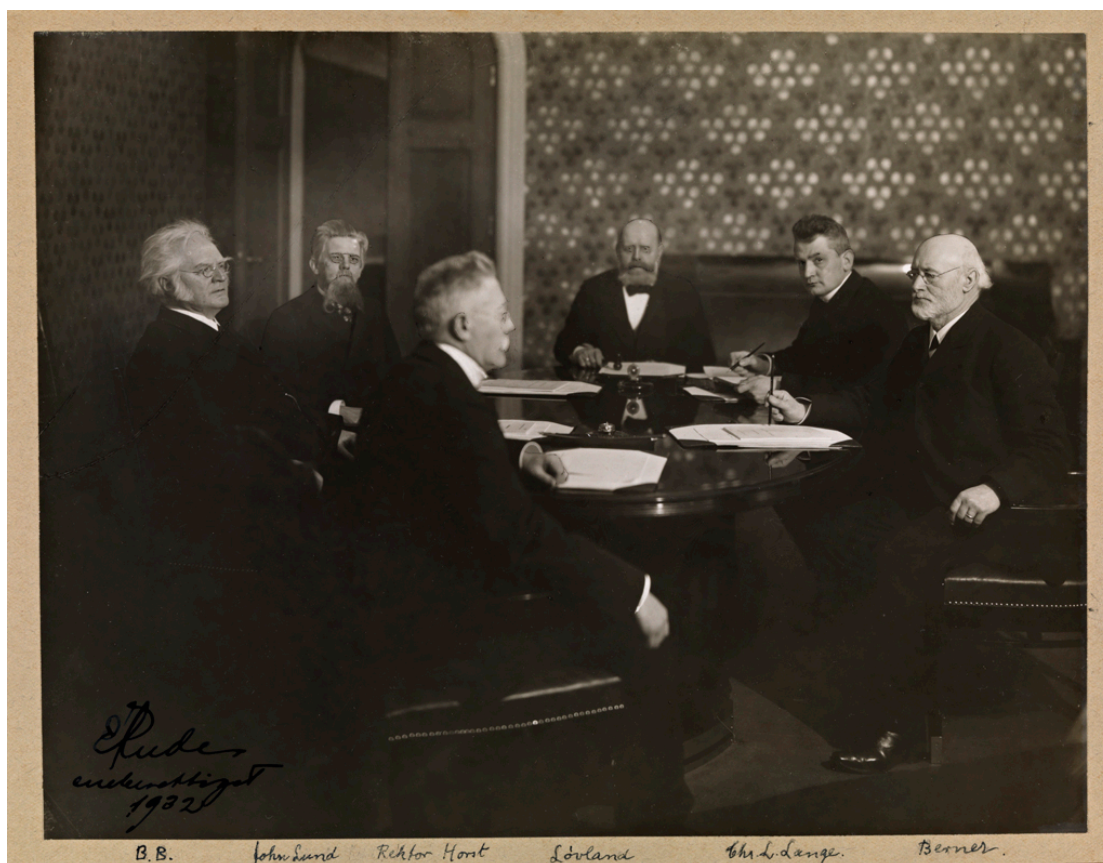
Møte i Nobelkomiteen, november 1905. F.v.: Bjørnstjerne Bjørnson, John Lund, Hans Jacob Horst, Jørgen Løvland, sekretær Christian L. Lange og Carl Berner.