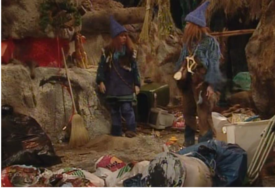
Episode 9: Søppelet i Blåfjell

Det har blitt bevist at det er en tydelig sammenheng mellom overforbruk og miljø og klimakrisa (Bazilchuk, 21). Miljøaktivister kritiserer også sterkt Norges salg av olje, som slipper ut Co2-gasser (Miljødirektoratet, 2020). Mulighet for å økonomisk fortjenelse kan gå over naturens og klimaets grenser, og dette ser vi at Mamsen og Lillegutt gjør. Kortsiktig profitt og bygdas overforbruk går utover den urørte naturen i Blåfjell.