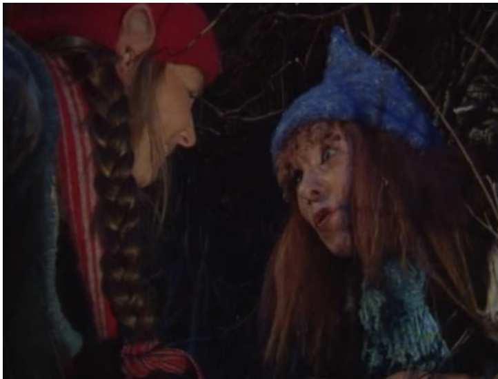
Episode 10: Turte møter Rødnissejenta

''Hva skjer hvis du og jeg blir venner? Blir jeg litt rød, og du litt blå? Hva skjer hvis jeg holder dine hender, Er vi fremdeles de samme som vi er nå? Jeg tror de gamle ble litt redde, Hvis de fikk se en som er rød De tror at noe farlig kanskje skjedde At de fikk prikker i fjeset og begynte å klø Tenk om vi sa til dem vi kjenner At rød og blå er like bra Og at nisser som oss kan være venner Samme hvor i denne verden vi kommer fra'' (Hagen, 1999)