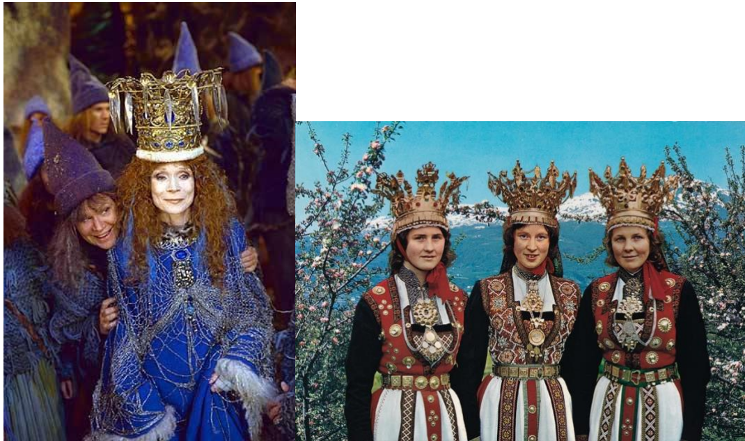
Dronning Fjellrose og bilder av brudekroner fra Hardanger

Dronning Fjellrose minner om en monark fra norske folkeeventyr, som ofte inkluderer konger, dronninger, prinser og prinsesser. Kronen til dronningen er tydelig inspirert av tradisjonelle brudekroner fra Hardanger.