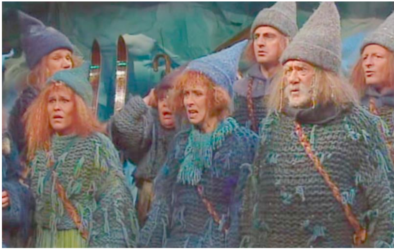
Episode 14: Blånissene sjokkert over å få se rødnissen. En bekymret Erke til høyre

og Blåmor reagerer direkte aggressivt på den nye nissen, da de blant annet skriker at hun ikke kan ha på seg det røde skjerfet Rødnissejenta ga til henne.