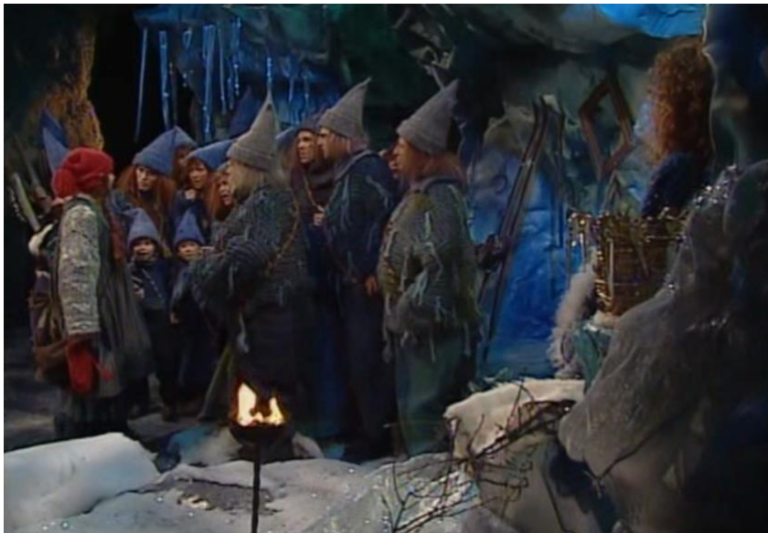
Episode 14: Rødnissejenta skiller seg visuelt ut

Julekalenderen legger vekt på hvordan Rødnissejenta beriker Blåfjell, og at det ikke er negativt med nye farger og inntrykk. Det tar lengre tid før Blåmor og Blåfar lærer å akseptere den nye nissen. De får en oppgave av dronningen om å lage en ny dronningkappe til jul. Denne kappen skal ha fargen som de kaller for "den gylne farge". De får en stein med fargen som skal lede dem. Blåmor og Blåfar er frustrerte av at de ikke klarer å få til fargen. Når de snakker med rødnissen og Turte, og gjør direkte narr av rødnissen, innser de at det er fargen rød som må til for den nye fargen. Dette var en lekse dronningen ga dem for å se verdien av den nye nissen. De skjønner fort at måten de har behandle rødnissen på ikke var riktig. Blåmor forklarer dette med at de var så redde for sin egen blåfarge, sin egen kultur, og at den ville ta skade av det som var rødt. De blir motbevist med at rødt og blått kan leve side om side, og til og med blandes til en helt ny farge de kan få glede av.