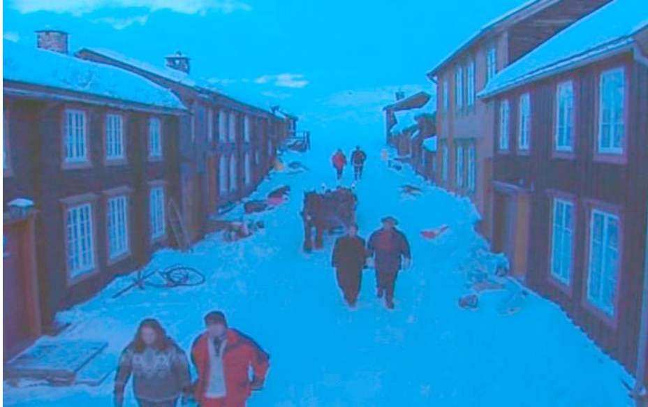
Episode 1: Kameraet viser Bygda for første gang