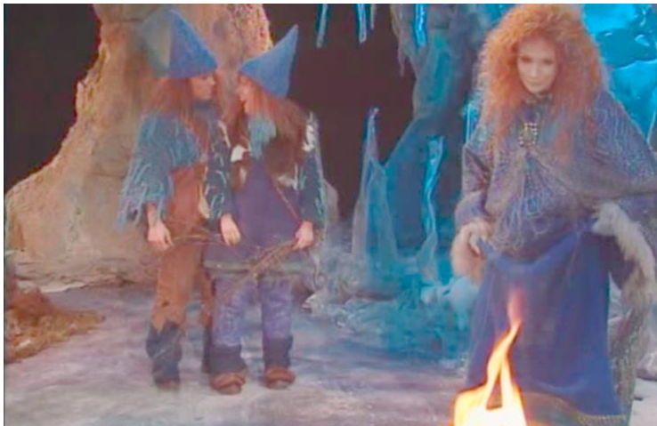
Episode 9: Innsiden av fjellet

Serien bruker også musikk, da blånissene bryter flere ganger ut i sang. Sangene skal forklare og utdype ulike situasjoner nærmere. Turte starter og avslutter hver episode med sangen "Blålokk", som forteller oss hvilken dag det er i desember og hvilken episode publikum ser på. Musikken inneholder for det meste egne "blåseinstrumenter". Serien har en egen "blånissemusikk" hvor sangene har likhetstrekk. Det blir også brukt mye lydeffekter i Blåfjell for å skape atmosfæren av at man er inne i et fjell, slik som ekko fra dråper av vann som faller. Musikken blir også brukt til å skille mellom når vi er i Bygda og når vi er i Blåfjell, da hvert sted har egen temamusikk som scener kan innledes med.