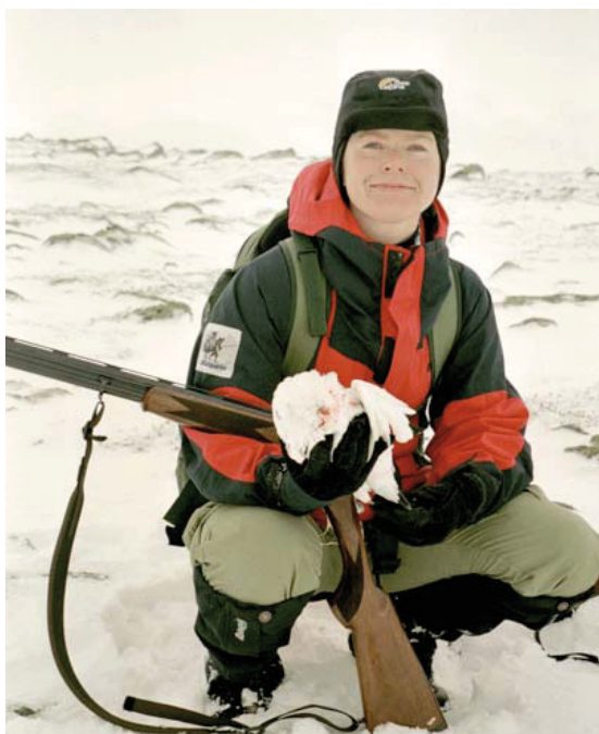
Bilde 2: Min første rype

til. Men i stedet for å jakte sammen med de mennene som jeg allerede hadde intervjuet og sette meg selv i en vanskelig følelsesmessig situasjon (se artikkel 2), valgte jeg å fokusere på mine personlige erfaringer som «gjestejeger» i bygdesamfunnet, samt tilegne meg kunnskap om jaktas meningsinnhold ved å observere og snakke med de menn og kvinner som vi møtte under våre gjentatte jaktturet i området de neste to årene.