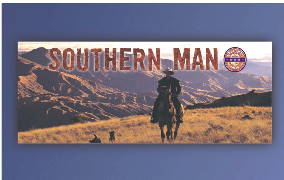
Bilde 1: Øl-reklamen til Speight's

Et eksempel på hvordan «det rural i det maskuline» kommer til uttrykk, ser vi i øl-reklamen (Law 1997, 2006). I New Zealand er «the southern man» selveste stereotypien på den rurale mannen. Speight's reklamen, som er situert i det rurale landskapet i Otago provinsen på sørøya, spiller på ideen om det barske og ensomme livet i det rurale landskapet. Reklameplakatene viser bilder av rurale menn som lever «det enkle livet» på hesteryggen, som sover under åpen himmel, og som parkerer sauene utenfor den lokale puben, når de har fått samlet flokken. Vi snakker om et vilt, vakkert og ugjestmildt landskap som byr på det tøffe, tidløse og harde livet – et liv som ikke er for pyser, men «ekte» mannfolk som søker de autentiske verdiene i livet og som vet å sette pris på en kald Speight's etter en strevsom arbeidsdag.