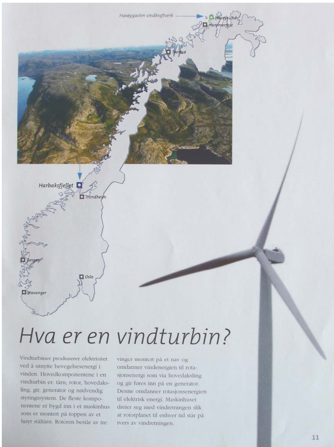
Figur 2: Faksimile av informasjonsfolder som illustrerer hvor i Norge Harbaksfjellet ligger. Trykket med tillatelse (Norsk Hydro 2003:11)