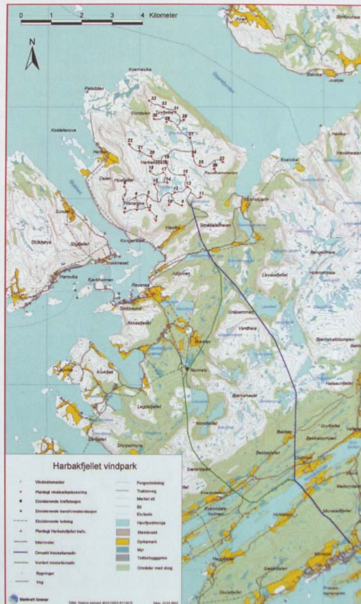
Figur 3: Faksimile av kart over planlagt vindmøllepark på Harbaksfjellet. Fra Informasjonsfolder, også gjengitt i konsekvensutredningen. Trykket med tillatelse (Norsk Hydro 2003:3)

Fra transformatorstasjonen er det planlagt bygget en ny kraftledning over heia, fram til eksisterende transformatorstasjon på Hubakken, nær kommunesenteret i Åfjord. Kraftledningen vil bli ca. 12,5 km. De siste tre km fram til Hubakken er ledningen planlagt bygget parallelt med eksisterende kraftledning.