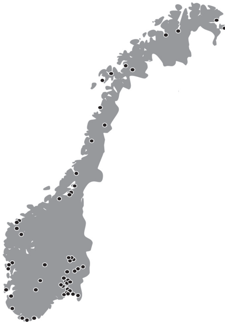
Minnesteder etter 22. juli 2011, etablert i tidsrommet 2011–2019.