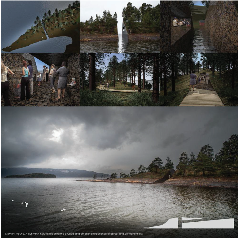
ILL. 3.2: Jonas Dahlberg, Memory Wound , 2014. Faksimile fra konseptbeskrivelsen.