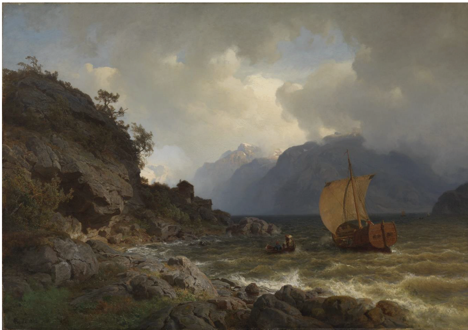
ILL. 3.4: Hans Gude, Vestlandsfjord , 1862.