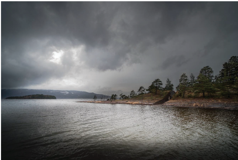
ILL. 3.1: Jonas Dahlberg, Memory Wound , 2014.