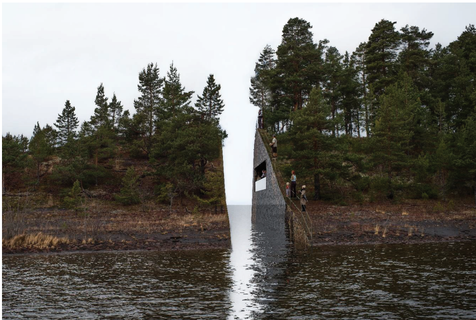
ILL. 1.2: Jonas Dahlbergs vinnerdesign Memory Wound for det nasjonale minnestedet på Sørbråten.