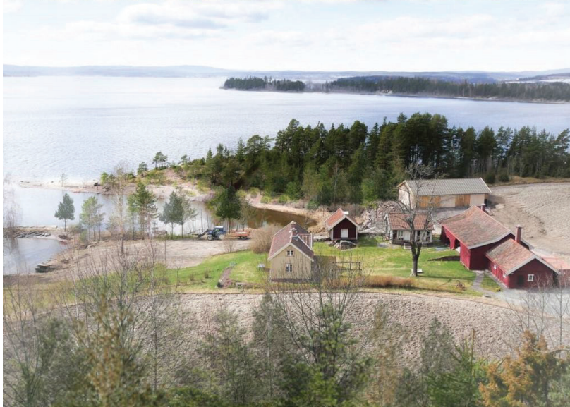
ILL. 3.3: Illustrasjon av Memory Wound, basert på fotografi tatt i mars 2016. Før og etter planlagte skjermingstiltak.