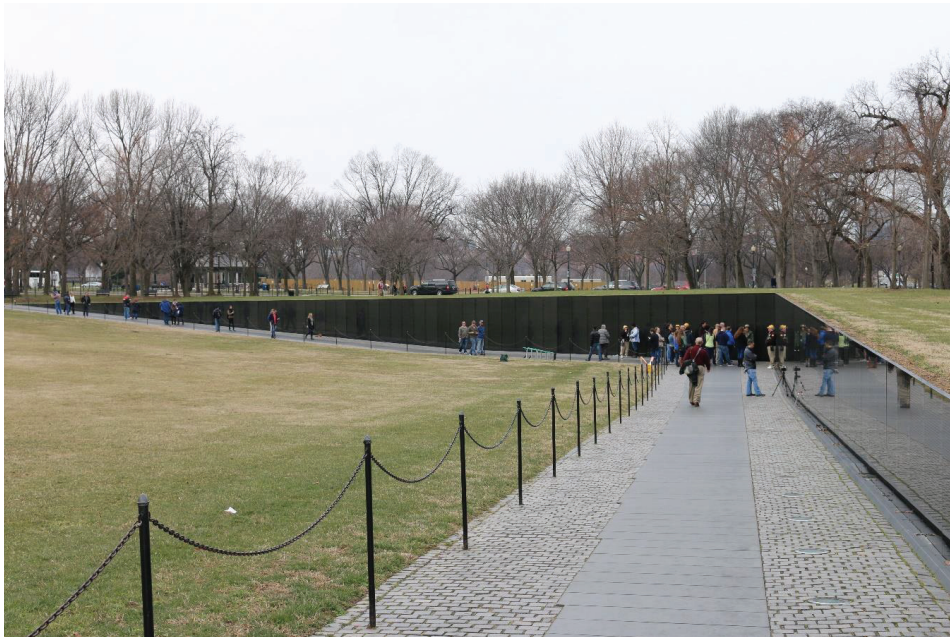
ILL. 3.5: Maya Lin, Vietnam Veterans Memorial, 1982.