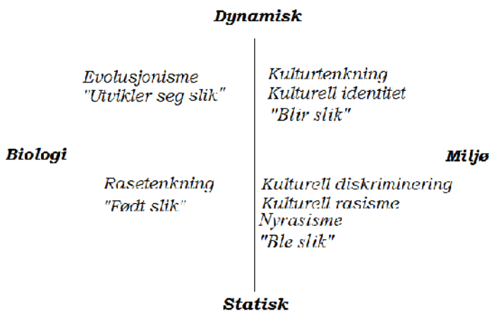
Figur 1. Varianter av biologiske og miljøbaserte diskurser

Selv om perioden eventuelt preges av en endring i de begreper som skribenter benytter i sin pressedekning av minoriteter, fra rasebegrepet til kulturbegrepet, er det ikke gitt at dette er synonymt med en reelt endret logikk omkring minoritetene. Dersom det har funnet sted et reelt skifte i diskurs, mot en ny mental klassifisering med basis i etnisitet, må en kunne forvente mer enn kun en begrepsendring fra det ene til det andre. Hva det nye begrepet viser til av logikker og ideer, må også ha endret seg fra noe biologibasert til noe miljøbasert. Overser man dette momentet, vil en risikere å tolke en ekstensiv henvisning til kulturbegrepet som en overgang til noe nytt, mens det i realiteten like gjerne kan være et uttrykk for rasetenkningens ideer og logikker iført en ny begrepsform. For å få grep om dette kan det være til hjelp å klargjøre hvilke grunnleggende logikker og bruksmåter henholdsvis rasebegrepet og kulturbegrepet antas å ha. Avisartikkelens språkføring kan så sammenlignes med disse kjennetegnene for å avgjøre om vi står overfor et reelt og grunnleggende diskursivt brudd eller ei. Vår definisjon av diskurs er med andre ord serier med utsagn som fremkommer i konkrete kontekster . Det samme begrepet kan i så måte brukes i ulike diskurser, avhengig av hvilken logikk som legges til grunn. Den følgende figuren fremstiller noen varianter av biologidiskurser og miljødiskurser og plasserer dem i dimensjonen statisk eller ubevegelig og dynamisk eller bevegelig: