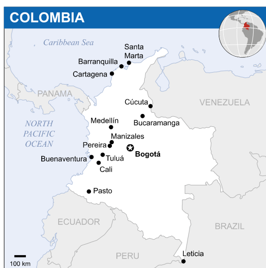
(Figur1. Kart over sentrale byar i Colombia frå Wikipedia Commons) 9