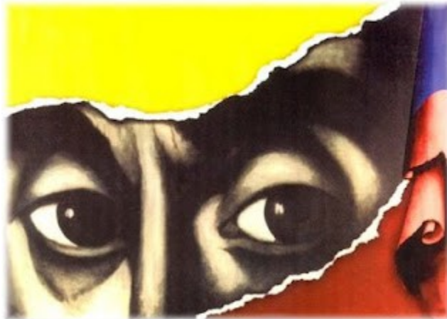
(Figur 5. Bilete av Simón Bolívar, henta frå nettstaden boltxe) 160