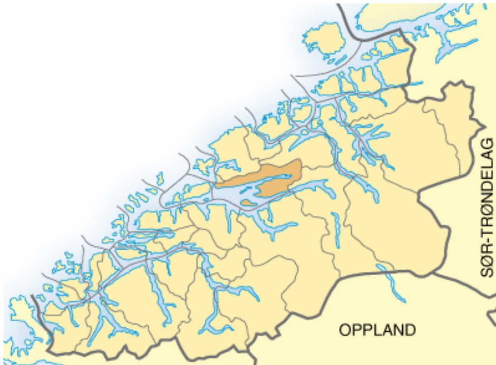
Figur 0:1: Kartutsnitt av Møre og Romsdal. Molde kommune er markert (Stokkan & Thorsnæs, 2018)

Per 4. kvartal i 2018 var det 27 001 innbyggere i Molde kommune - en økning på 0,63 prosent fra året før. Ifølge Kommunestatistikken til Statistisk Sentralbyrå (2018) er det fødselsoverskudd, innenlands flytting og innvandring som fører til at kommunen ikke opplever nedgang i innbyggertall. Møre og Romsdal har samlet sett opplevd en sterk folketallsøkning som følge av arbeidsinnvandring. Molde kommune hadde i 2017 en arbeidsplassdekning på ca. 123 prosent og i 2017 var det 16 609 sysselsatte som hadde arbeidssted i Molde. Av disse arbeider 5 486 i servicenæringer, 3 879 i helse- og sosialtjenester, 3 464 i sekundærnæringer, 1 659 i offentlig administrasjon, forsvar og sosialforsikring, 1 256 i undervisning, 640 i personlig tjenesteyting og 174 i jordbruk, skogbruk og fiske (Møre og Romsdal fylkeskommune, 2018b).