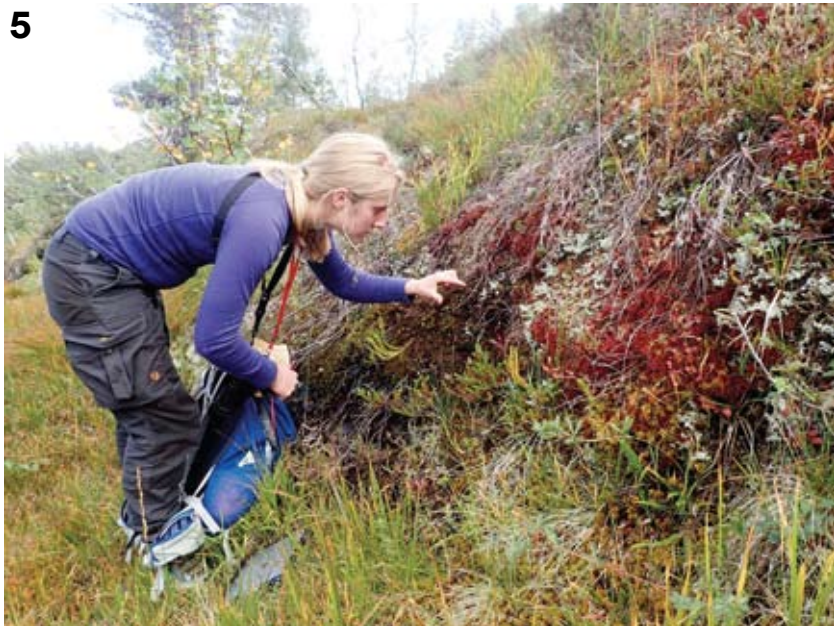
Figur 5. Voksested for nipdraugmose A. joergensenii i Sjørdalen i Bremanger.

Habitat of A. joergensenii in Sjørdalen, Bremanger municipality.