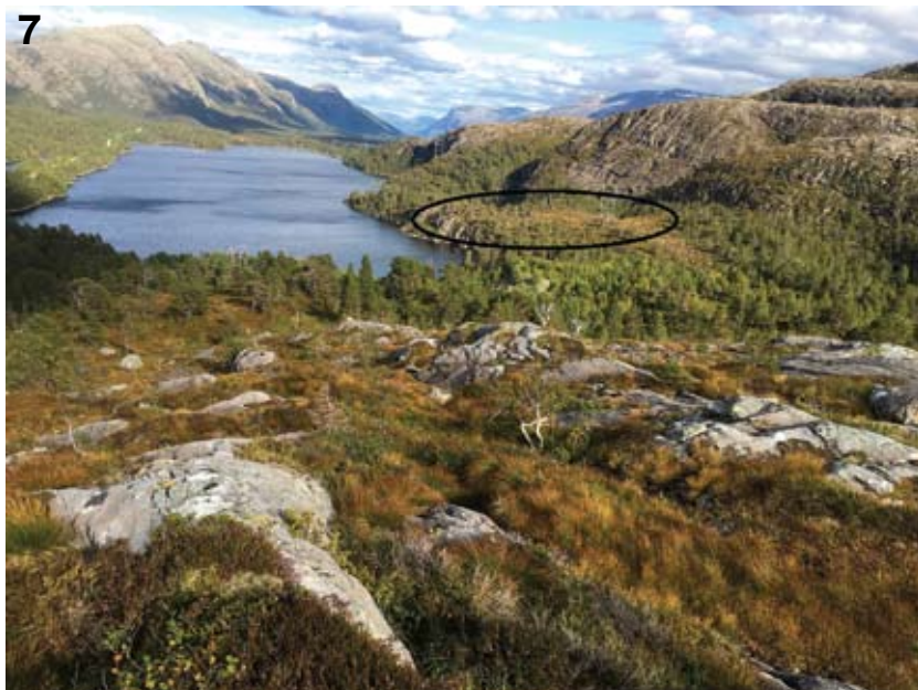
Figur 7. Ved Langevatnet i Bremanger. Her går både gammel og ny kraftlinje gjennom en lokalitet med nipdraugmose. Det er få inngrep rundt mastepunktene, men linja er bygd uten kunnskap om tilstedeværelsen av nipdraugmosen. Langevatnet in Sørдалen, Bremanger municipality. At one of the A. joergensenii localities (circled) both a new and old electric power line crosses the locality. The power lines were built without knowledge of the A. joergensenii population.

1995). Fjellet ble i 2015 undersøkt i kystfurusskog-prosjektet og gitt verdien nasjonalt verdifullt og svært viktig (verdiklasse 6 – på en skala fra 1 til 6; Hanssen et al. 2016). Både skogsområdene her og også noe av arealene ovenfor skoggrensa burde være en sterk kandidat til frivillig vern. Lokaliteten Langevatnet (Sørдалen nord) i Bremanger ble også undersøkt i samme prosjekt og ble gitt verdien nasjonalt verdifullt (verdiklasse 5 – på en skala fra 1 til 6) (Jordal 2016). Et argument som kan bli brukt mot frivillig vern her, er at det går to kraftlinjer gjennom lokaliteten. Forhåpentligvis finnes det mer av nipdraugmose enn det vi har funnet til nå, både i Sørдалen og rundt Endestadnipa. Det er også en mulighet for at det kan finnes flere uoppdagete lokaliteter. Arten bør derfor ettersøkes ytterligere. Nipdraugmose er en internasjonalt meget sjelden art som Norge har et stort ansvar for. Det er derfor gode grunner til at de kjente lokalitetene får et høyt fokus i fremtidig arealbruk og naturforvaltning.