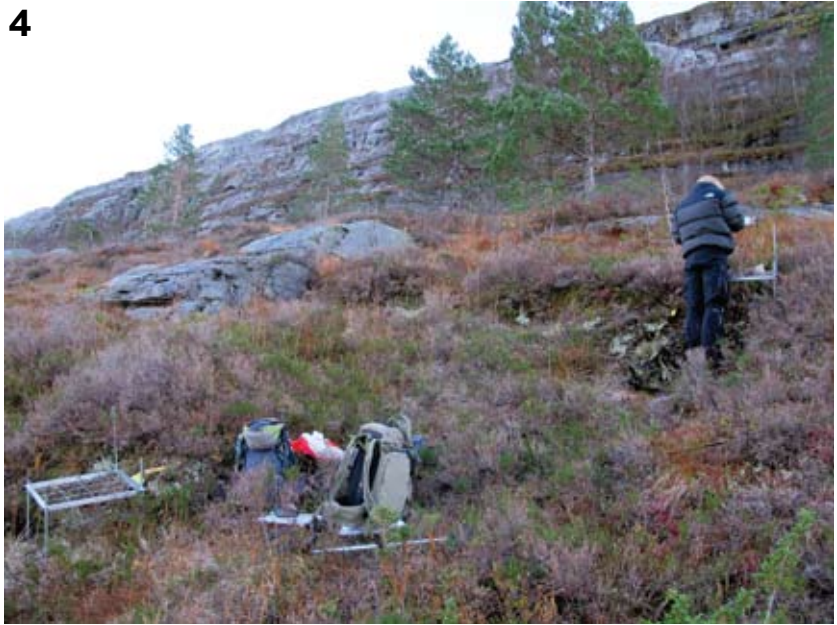
Figur 4. Voksested for nipdraugmose A. joergensenii på typelokaliteten Endestadnipa i Flora.

Habitat of A. joergensenii at the type locality Endestadnipa in Flora municipality.