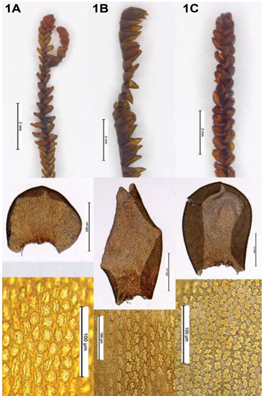
Figur 1. A Nipdraugmose Anastrophyllum joergense-nii fra Endestadnipa, Flora (typelokaliteten), B prakt-draugmose A. donnianum fra Samanger, Hordaland og C A. alpinum fra West Sutherland, Skottland. Bildene viser: skudd øverst, i midten blad (dorsalsiden opp) og nederst cellestruktur midt i bladet. Målestokk henholdsvis 2 mm, 500 µm og 100 µm

A Anastrophyllum joergense-nii from Endestadnipa, Flora municipality (type locality), B A. donnianum from Samanger municipality, Hordaland county, and C A. alpinum from West Sutherland, Skotland. The pictures from top to bottom shows: shoots, dorsal side of leaf and mid leaf cells. Scale bar 2 mm, 500 µm og 100 µm, respectively.