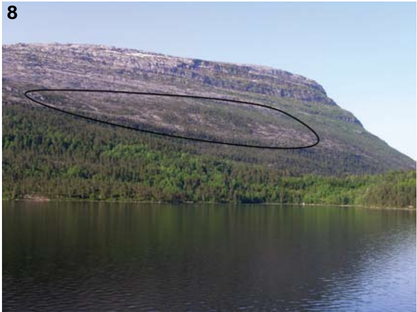
Figur 8. Endestadnipa sett fra avstand. Det er så langt få inngrep i de områdene der de oseaniske mosene vokser, men utbygging av småvassdrag kan være aktuelt i østlige deler. Sirkelen indikerer området hvor nipdraugmose er funnet i den vestlige delen av Endestadnipa. Endestadnipa seen from the north. The area where A. joergensenii is found (circled) is relatively undisturbed, but plans for small hydroelectric power production in the eastern part has been discussed and may be a threat in the future.