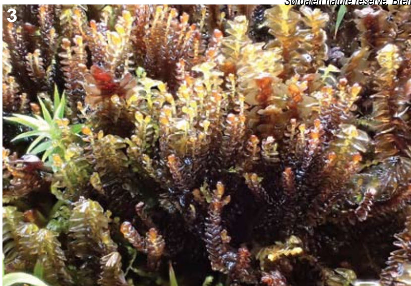
Figur 3. Liten tue av nipdraugmose A. joergensenii fra Sørtdalen i Bremanger. Her vokser den sammen med de andre store oseaniske levermosene praktdraugmose A. donnianum , praktvebladmose Scapania ornithopodioides , i tillegg ser vi et skudd av en bjørnemose Polytrichum sp. til venstre i bildet. Foto: JBJ. Small cushion of A. joergensenii from Sørtdalen in Bremanger municipality. Growing mixed with A. donnianum and Scapania ornithopodioides, one shoot of Polytrichum sp. is seen near the left edge of the picture.