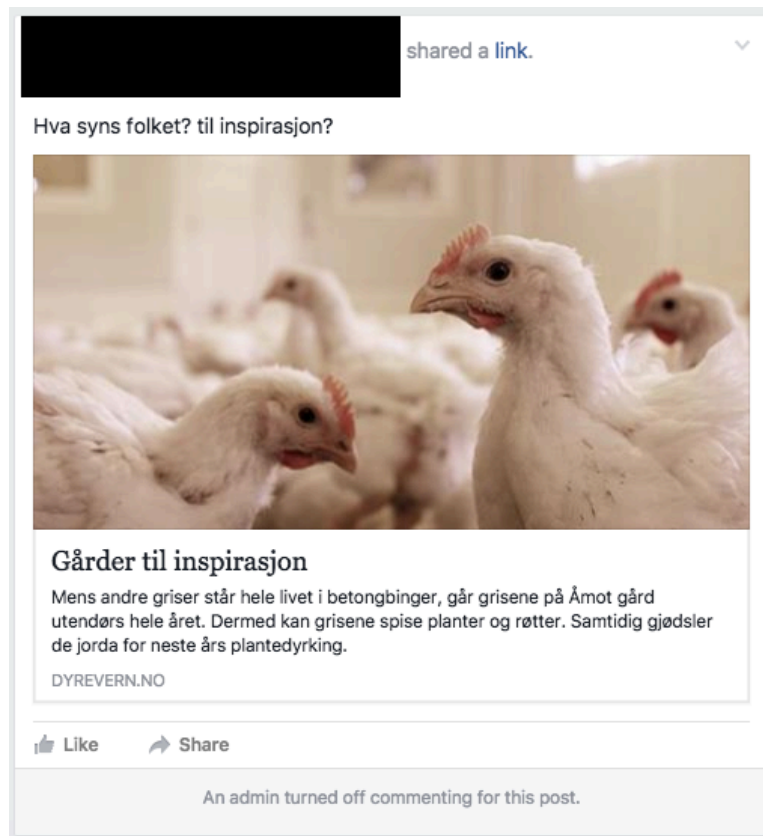
Figur 2. Skjermdump fra Facebooksiden til Venner av norsk landbruk.

Denne skjermdumpen er nok ett eksempel på en sak hvor nisje-bønder som velger å gå mot strømmen av vanlig produksjonsmåter, blir ignorert og forbigått av gruppen.