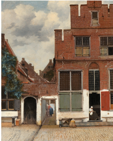
The little street in Delft av Johannes Vermeer (1657-58)