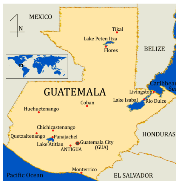
Figur 1: Kart over Guatemala.

Landet presenterer et kulturelt mangfold, og er en av de tettest befolkede landene i Mellom-Amerika (Ekern og Bendiksby, 2001). Guatemala beskrives som «Latin-Amerika i et nøtteskall» (ibid, s. 1), og jeg opplevde som et land fylt av kultur og tradisjoner, rytme, musikk, farger, vakker natur med fjell og vulkaner, og med store kontraster mellom rike og fattige. Guatemala holder en interessant historie blant annet om diktatorer og en langvarig kamp om rettigheter, særlig blant landets urfolk.