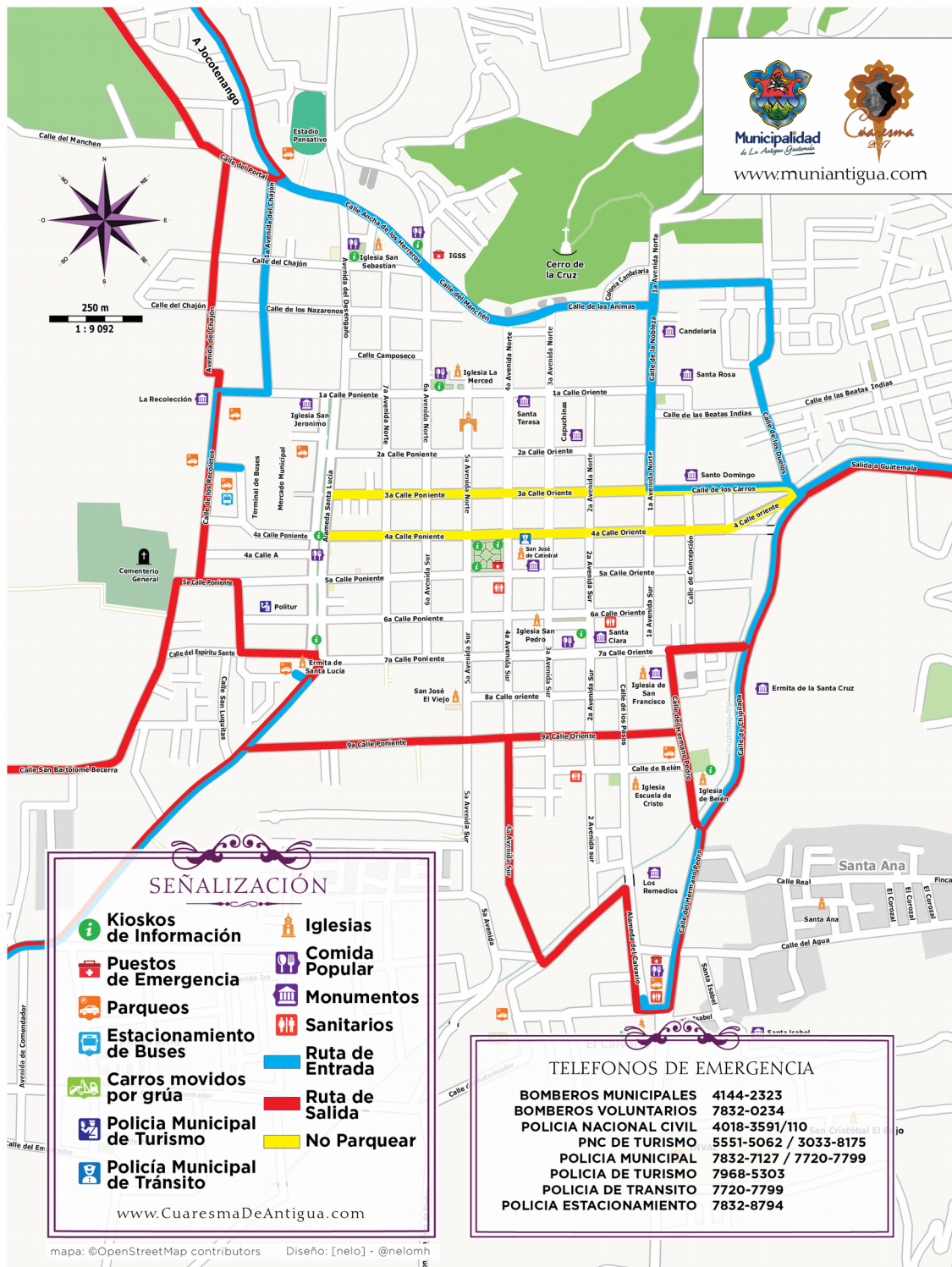
Figur 2: Kartillustrasjon av Antigua, med oversikt over veier, kirker og monumenter, og populære spisesteder.