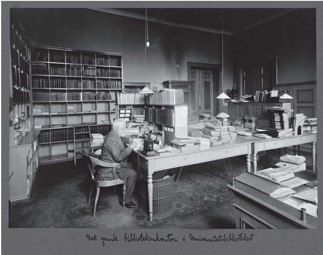
Det gamle bibliotekkontor i Universitetsbiblioteket

Fotografi tatt for 1913.