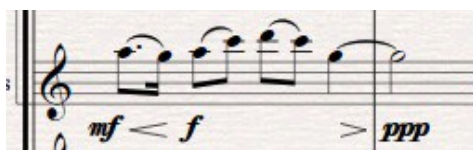
Tema 1. (t. 1 – 2)