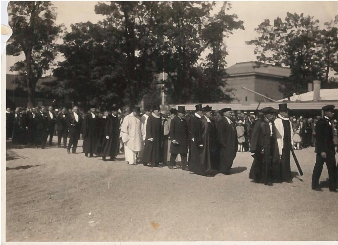
Prosesjonen på vei inn til Nidarosdomen. 78