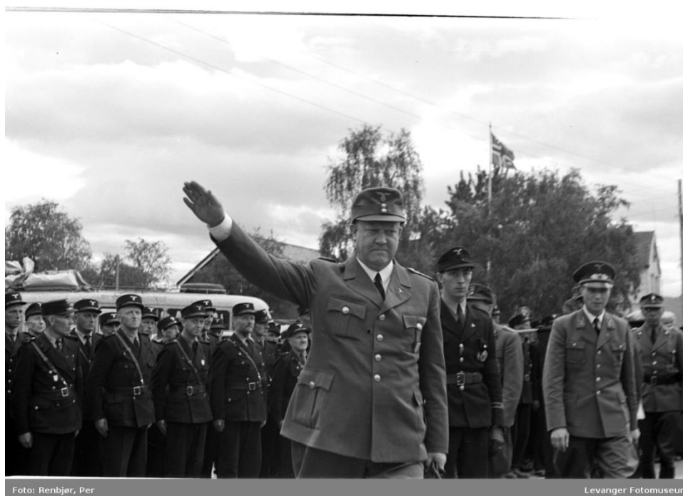
Nasjonal Samlings Riksstevne 29.juli 1944. Vidkun Quisling med Hirten i bakgrunnen ved anledning avdekking av bauta.

Specialavdelingen ble etter bare noen måneder til Hirten. Grunnen til navnebyttet var for å nå kvitte seg med sammenligningen til SA, altså det tyske NSDAPs paramilitære fløy. De høye herrer i NS med Vidkun Quisling i spissen ville ha et mer norsk klingende navn. Ønsket om en mer norsk-nasjonal profil på partiet og organisasjoner tilknyttet til det var samtidig sterkt. Hirten hadde først og fremst som oppgave å være Nasjonal Samlings væpnede maktmiddel, og skulle være en stormtropp som tok ansvar når det var nødvendig. Organisasjonen økte rekrutteringen og vokste i størrelse, samtidig som samholdet innad ble styrket tilnærmet ett slags brorskap. Nasjonal Samlings ledere mente at veien til total seier måtte gå gjennom omfattende maktbruk, noe som førte til at Hirten ble stadig mer brutale. 100