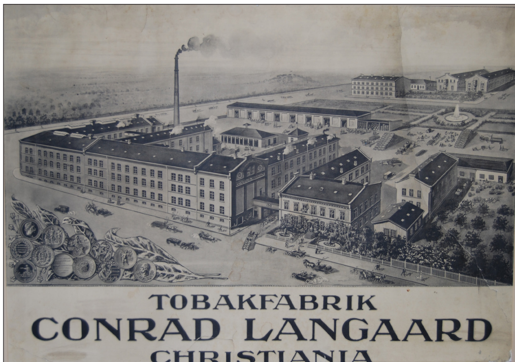
Fabrikbygningene til Langaard tobakkfabrikk, hvor de fleste typer tobakk ble produsert. I 1890 arbeidet 356 ansatte i disse lokalene, i 1915 hadde tallet steget til 554.

I 1890 hadde fabrikken med sine 356 ansatte over 20 prosent av den nasjonale sysselsettingen i industrien. I 1915 hadde antallet ansatte økt til 554, noe som var godt over dobbelt så mange som den nest største tobakkbedriften. Ved begynnelsen av 1890-årene produserte Langaard tobakkfabrikk de fleste typer tobakkvarer; det var spinneri og sauseri for skrätobakk, karveri for røyketobakk, samt egne avdelinger for produksjon av sigarer og snus. I tillegg fantes det en egen avdeling for sigarettproduksjon, som var den første i Norge da den ble opprettet i 1885. 5