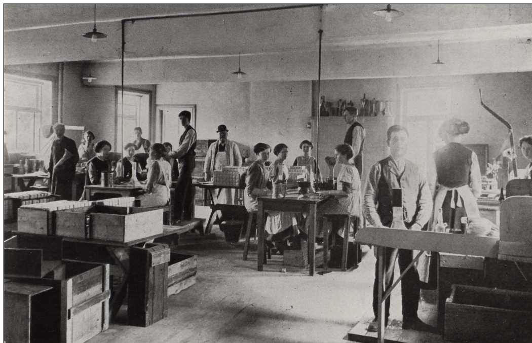
En relativ oppvurdering av mannlig arbeid og nedvurdering av kvinnelig arbeid medførte at mennene opplevde mer stolthet og mestring i arbeidet. Her fra innslageriet, hvor røyketobakken ble emballert.

arbeidsoppgavene var. Videre er det klare likheter i fortellemåtene innen hver kjønnsgruppe, uavhengig av bestemte arbeidsoppgaver: For eksempel forteller mannlige sjauere, rullere, forsprenkere og kjørere om at arbeidet var tungt og dermed vanskelig. Samtidig forteller kvinnelige oppløsere, dekksmakere og dekkсанleggere om sine arbeidsoppgaver uten å fremheve det utfordrende ved dem.