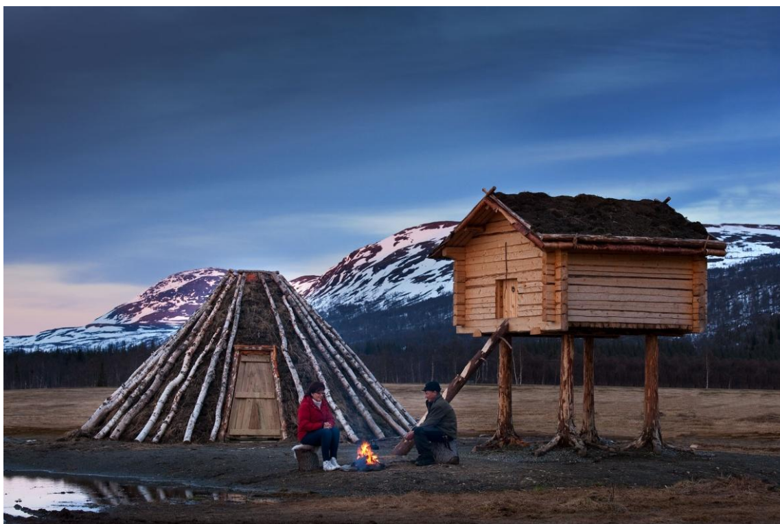
Destinasjon Dærga.