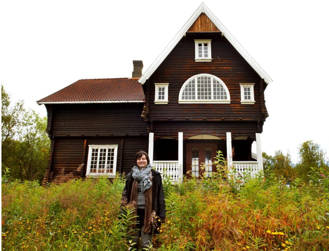
Villaen i Gjersvika, med meg selv i forgrunnen.