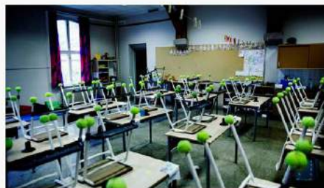
Fra 2017 vil lærerutdanningen bli en masteroppgave.