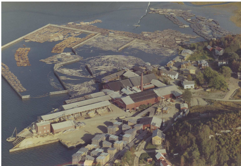
Bilde 1: Luftfoto av A/S Spillumbruket 1968