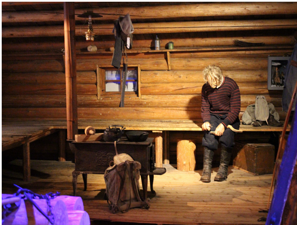
Bilde 5: Halvpart av koi, sto tidligere på Prestøya.