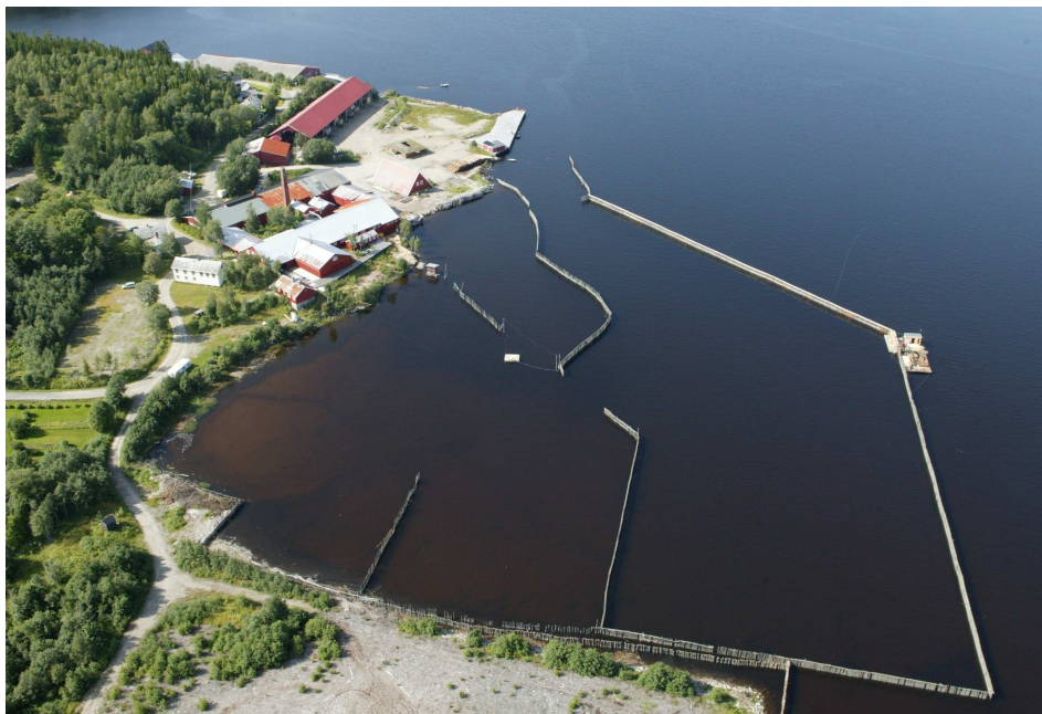
Bilde 2: Luftfoto av kulturminnet Spillum Dampsag & Høvleri 2010.