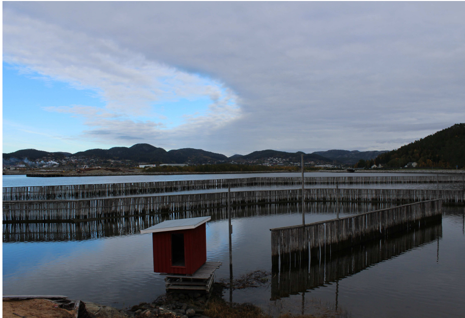
Bilde 3: Tømmerbom på Spillum. Christin R. A. Johansen 2015.

Ved hjelp av økonomisk støtte i form av ekstraordinære bevilgninger har museet også kunnet gjennomføre en rekke andre prosjekter, deriblant restaurering av industripipa og wirebua. Museet har satt opp nytt fyranlegg og restaurert bygget som kalles Kirka, hvor flis etter produksjon lagres. I tillegg har museet fått mulighet til å restaurere kjerraten som drar tømmeret fra tømmerbommen og opp til saga, restaurert trillebaner og utskipningslager. 129 Disse prosjektene hadde vært vanskelige å gjennomføre uten den økonomiske støtten.