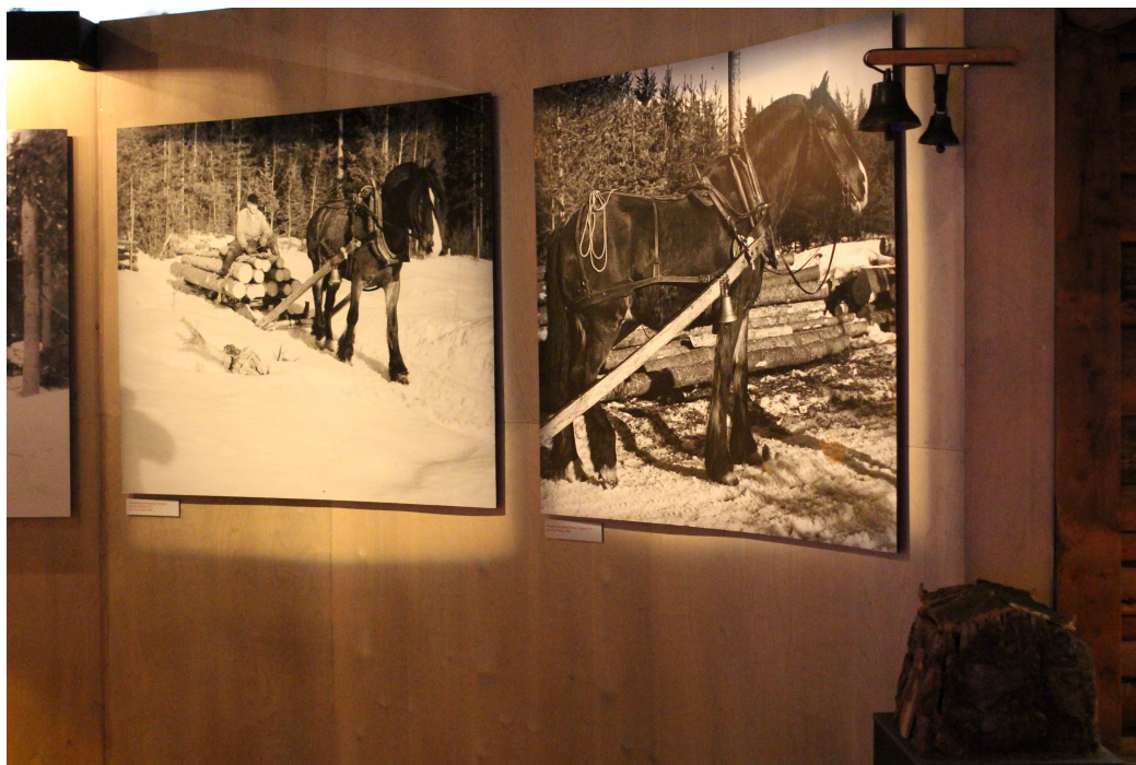
Bilde 4: Store bilder dominerer delen av utstillingen viet eldre skogbruk. Christin R. A. Johansen. 2016.