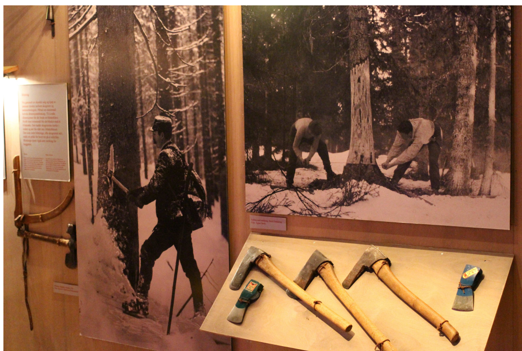
Bilde 7: Lite bruk av tekst i delutstillingen. Christin R. A. Johansen, 2016.