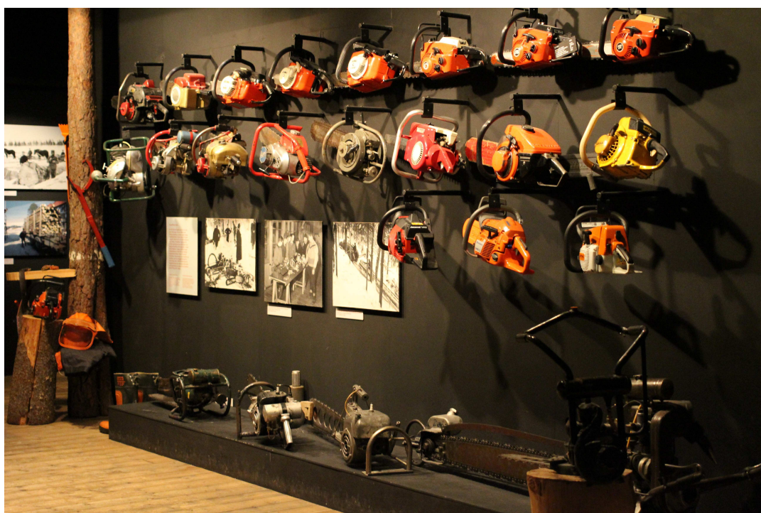
Bilde 9: Motorsagvegg.