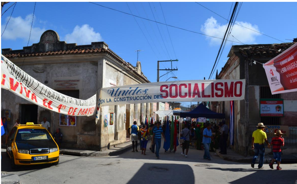
Feria del Tivoli.

Den 1. januar 1959 ble et vendepunkt for Cubas befolkning, da den tidligere diktatoren rømte landet og hadde innsett sitt nederlag – revolusjonen var et faktum. Tiden etter dette, ble det et