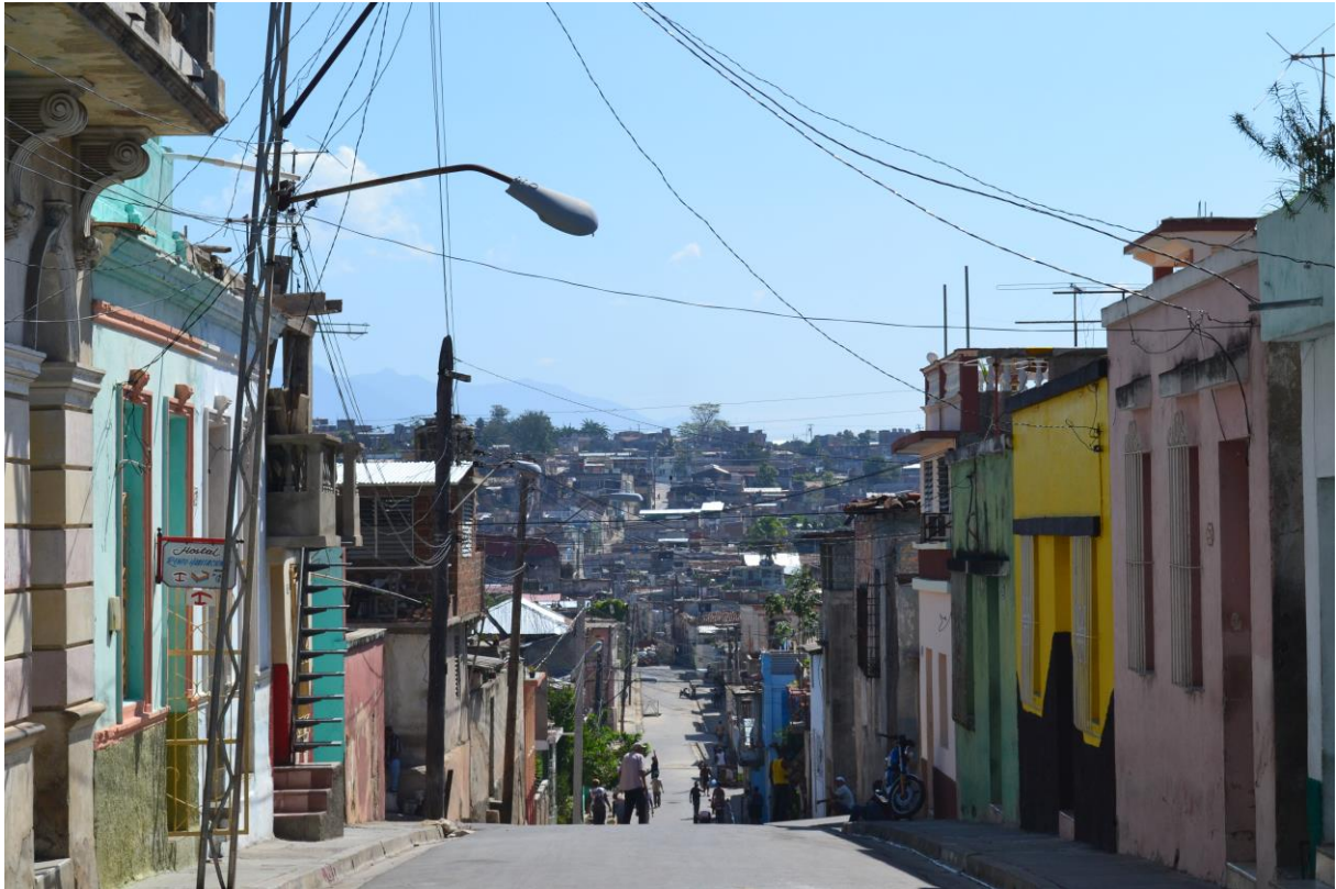
Santiago de Cuba.