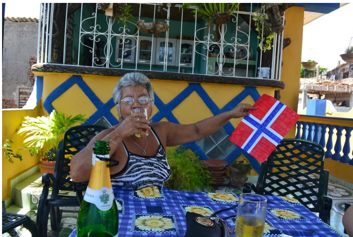
17. mai i Santiago de Cuba.

sigarettene regelmessig gjennom skiftene sine. Det er sjeldent man ser de i dårlig humør, selv om lønningene kanskje ikke strekker helt til og selv om føttene verker. Hun ene fortalte meg en dag jeg spiste lunsj, at lønnen her er hakket bedre enn da hun arbeidet i en statlig bedrift. Der statlige lønninger ligger på omtrentlig 10-20 CUC, blir de betalt 30 CUC pluss ulike tillegg og tips fra turister i dette huset. En dag kommer hun bort til meg og gir meg en liten pose – det er et armbånd i knallsterke farger som hun mente jeg skulle ha. Da jeg på slutten av oppholdet mitt gav henne en pose full av klær, en halv flaske sjampo og dusjsåpe var hun veldig takknemlig.