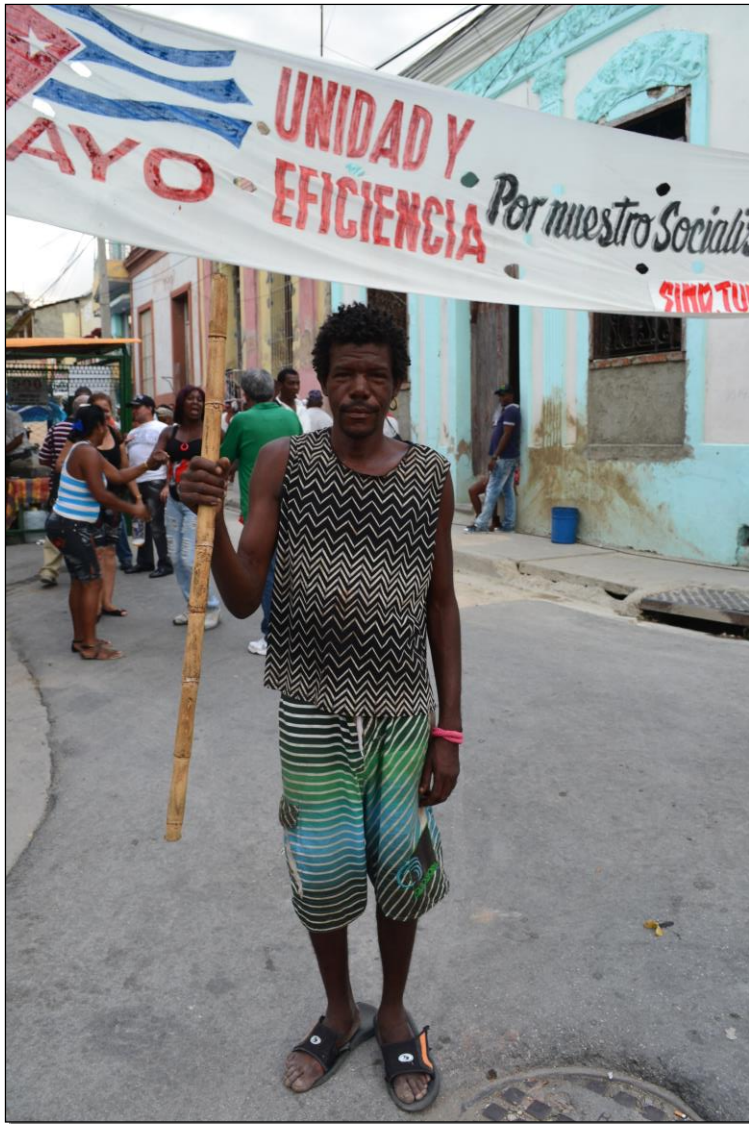
Kan du ta bilde av meg? Det koster 1 CUC.