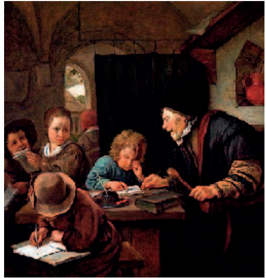
Figur 2: Jan Steen: Skolelærer. Ca. 1668.

scriffue-skoler (som mand dem kaller) for drenge og piger oc andre der icke due til at læse latin, maa effrigheden forsørge, dog skulle forstanderne for samme skoler see til med, at sand gudfrygtighed maa samme børn saa effterhaanden indgydis oc indgrundis aff børnelærdommen. 14