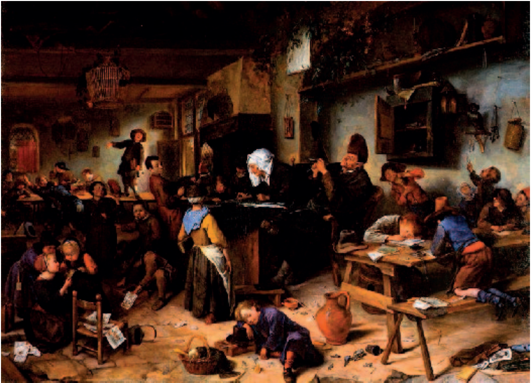
Figur 4: Jan Steen: Landsbyskole. Læreren og hans kone. Ca. 1670.