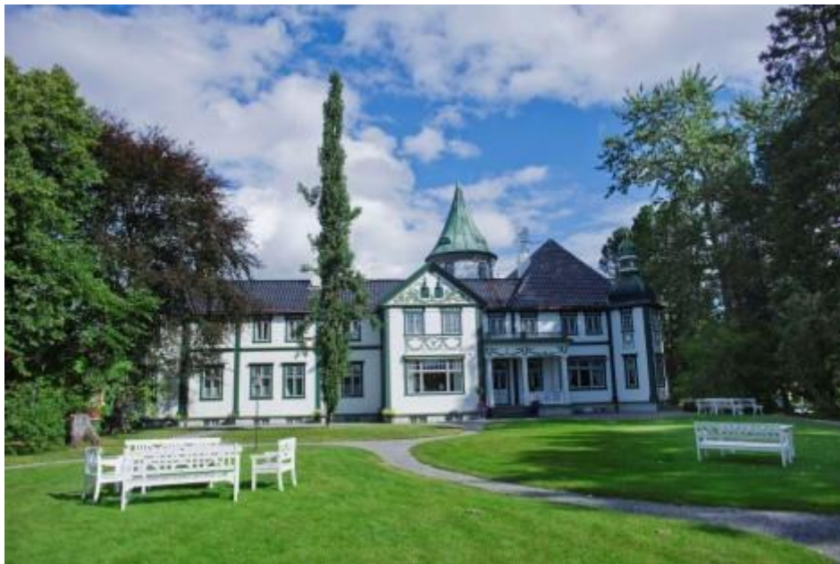
Figur 7: Baardshaug herregård