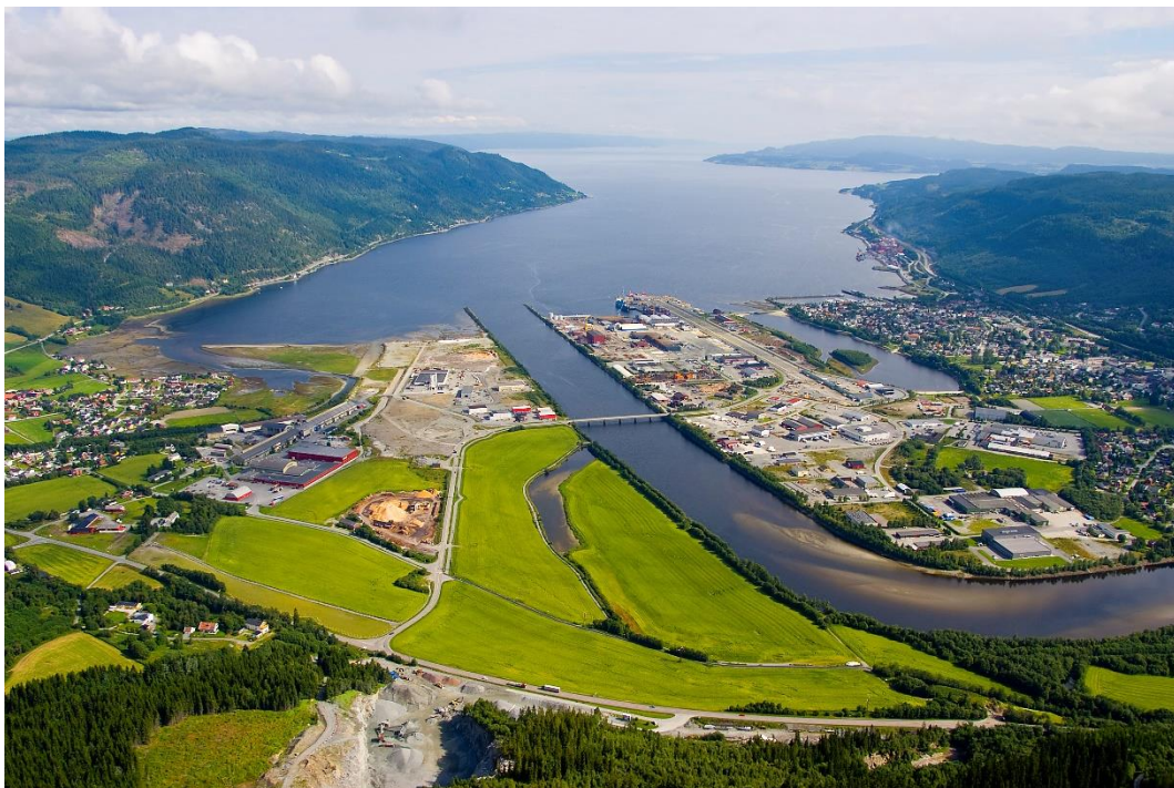
Figur 2: Orkdal kommune

Triple Helix beskriver effekten når næringsliv, forskning og det offentlige samarbeider. Begrepet er treffende for Orkdal kommune. De kombinerer tung prosessindustri med sterkt miljøfokus og er samtidig store leverandører til oljeindustrien (Trondheimsregionen, u.å.).