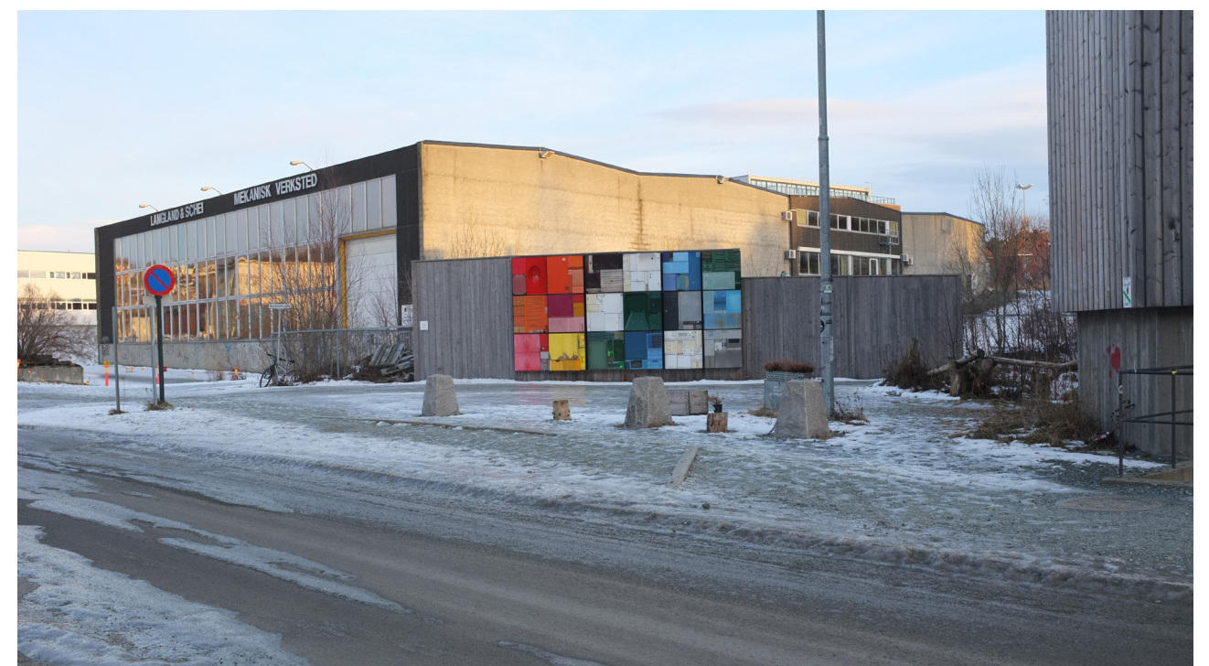
Tomta sett fra Strandveien.

Tomten ligger sentralt i Trondheim, med godt kollektivtilbud og gangavstand til sentrum. Det er 400 meter til nærmeste togholdeplass og busser passerer i Strandveien.